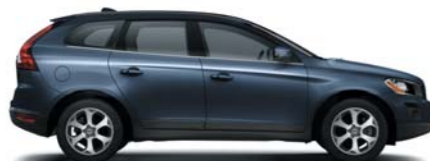
466 Barents Blue pearl