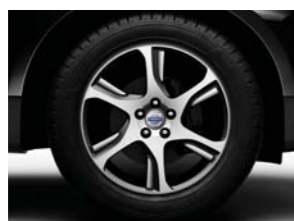
18" 235/60 ZEPHYRUS