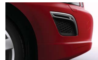
Без противотуманных фар в спойлере переднего бампера