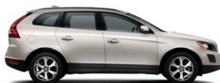
484 Seashell metallic