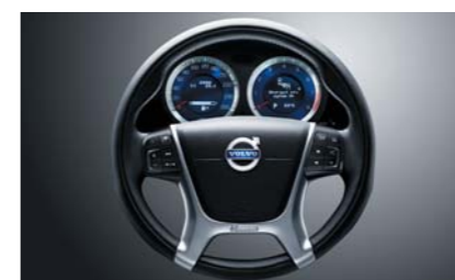
Рулевое колесо R-DESIGN. Спортивная панель приборов с синей подсветкой R-DESIGN