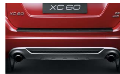
Двойная выхлопная труба R-DESIGN. Нижняя накладка заднего бампера R-DESIGN