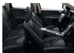
G600 — черного цвета в черном интерьере