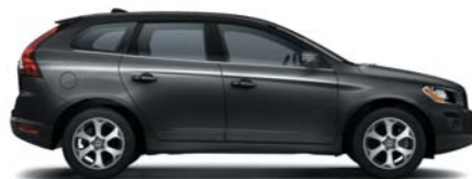
019 Black solid