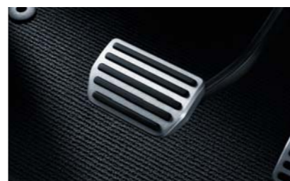
Спортивные накладки на педали R-DESIGN