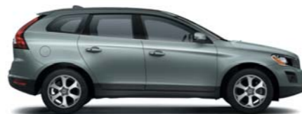
490 Chameleon Blue pearl