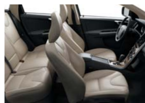
G10B — бежевого цвета в черном интерьере