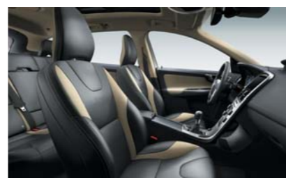
GM00 — Спортивная кожа R-DESIGN черного цвета с бежевыми вставками