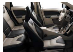
G116 — цвета светло-бежевый/коричневый в бежевом интерьере