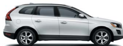
614 Ice White solid*