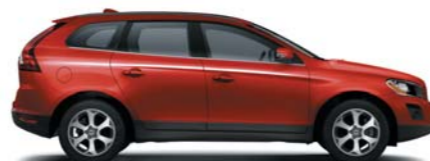
612 Passion Red solid*