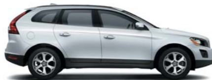
426 Silver metallic