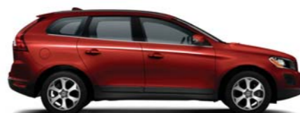
702 Flamenco Red pearl