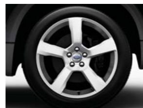
20" 255/45 CRATUS