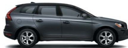
492 Savile Grey pearl*