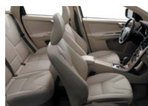
G612 — светло-бежевого цвета в бежевом интерьере