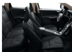
G000 — черного цвета в черном интерьере