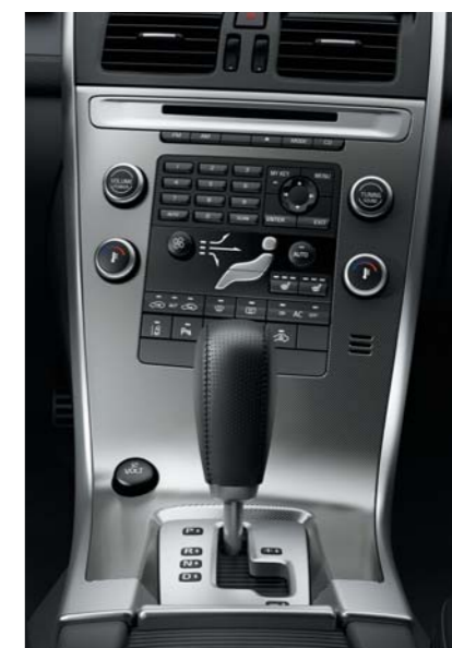
Рукоятка КПП R-DESIGN