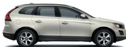
481 Cosmic White metallic*