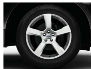
18" 235/60 CRATUS