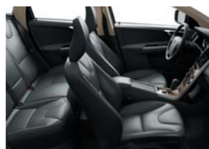
G100 — черного цвета в черном интерьере