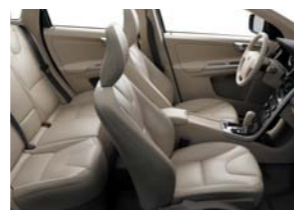
G112 — светло-бежевого цвета в бежевом интерьере