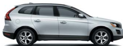
477 Electric Silver metallic*