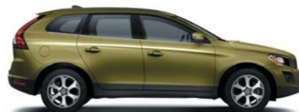
495 Lime Grass Green pearl*