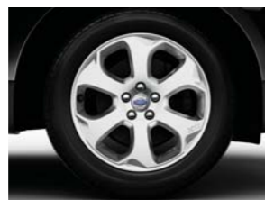
18" 235/60 MERAC