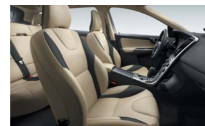
GM02 — Спортивная кожа R-DESIGN бежевого цвета с черными вставками