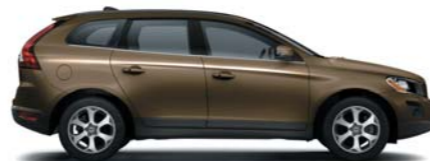
494 Terra Bronze pearl