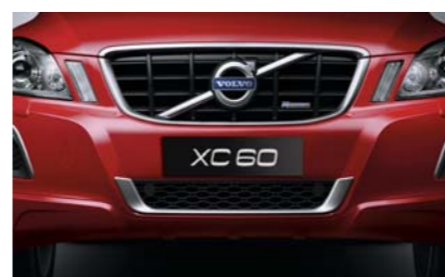
Решетка радиатора R-DESIGN