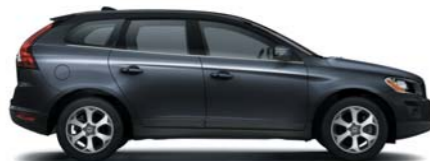
452 Black Sapphire metallic*