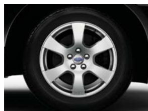
17" 235/65 SEGIN