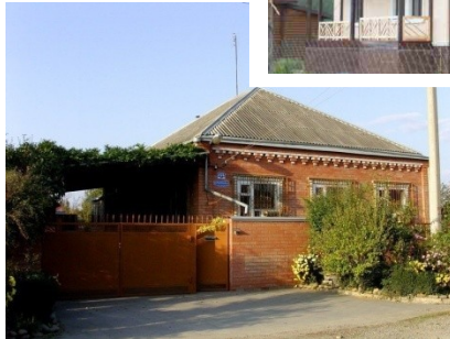
Дом в деревне