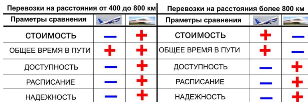
Таблица 2.2. Сравнение привлекательности перевозок для пассажиров авиационным и высокоскоростным железнодорожным транспортом в зависимости от расстояния.

Высокоскоростное железнодорожное сообщение по ВСМ-2 должно усилить экономическую конкуренцию, прежде всего с авиатранспортом, особенно в летний период с сезонным максимумом пассажиропотока. Такая конкуренция должна оказать положительное влияние на ценообразование в авиационных и в железнодорожных перевозках.