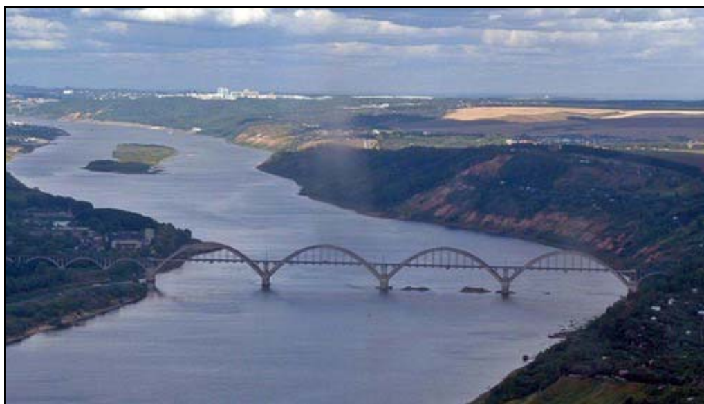
Рисунок 5.3.1. Река Ока в районе перехода ВСМ-2, Вариант 1 в районе Нижнего Новгорода

Наиболее загрязненными на территории Нижегородской области являются реки Кудьма и Ока в районе Нижнего Новгорода и Дзержинска. Река Волга испытывает наибольшую антропогенную нагрузку на участке ниже станции аэрации очистных сооружений Нижнего Новгорода.