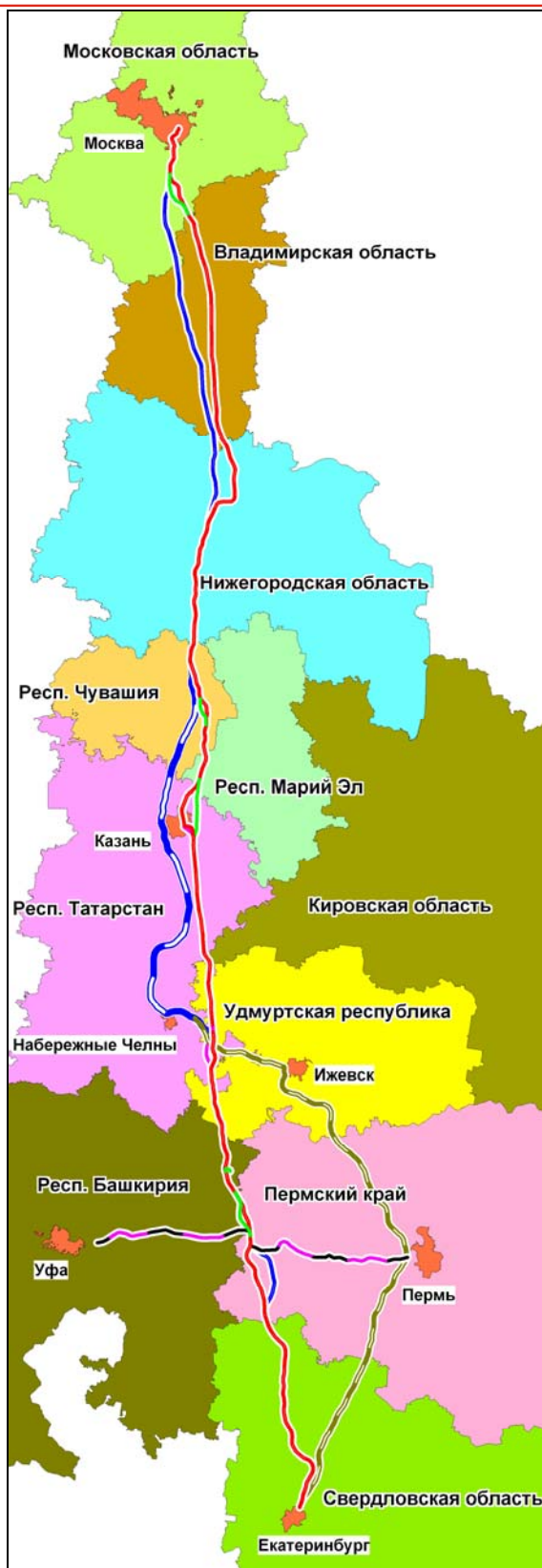
Рисунок 2.1. Схема рассматриваемых в ОВОС вариантов ВСМ-2.