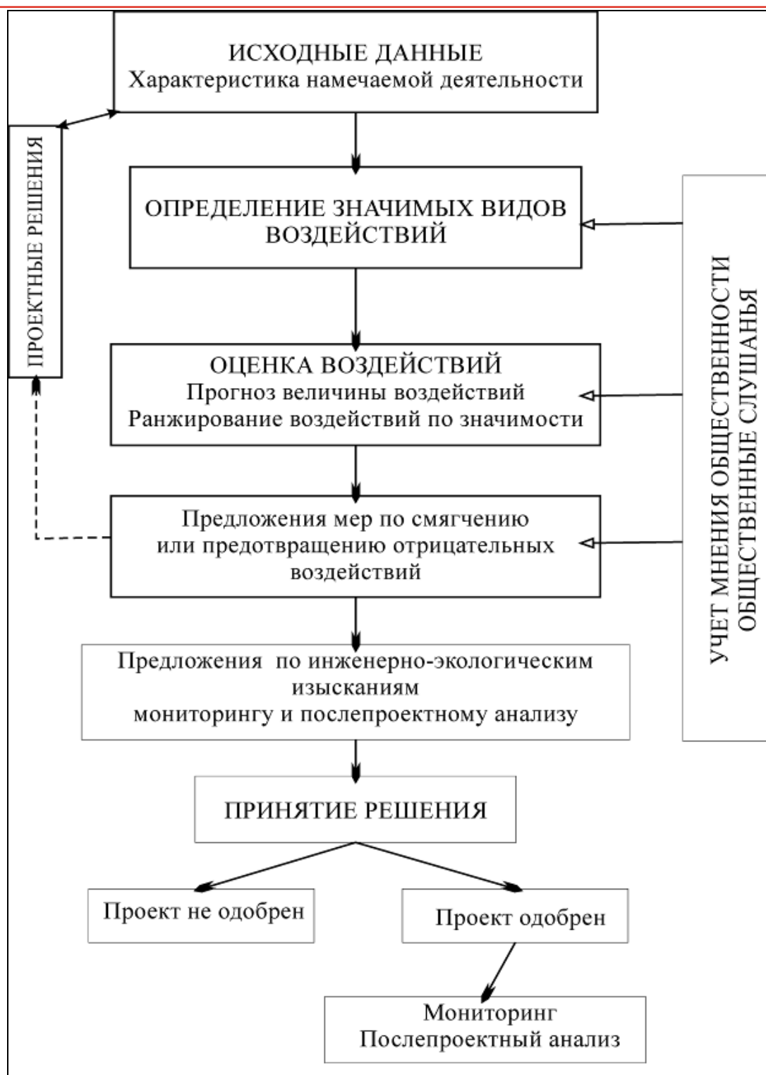
Рисунок 4.1 Обобщенная схема процедуры экологической оценки

(по Черп. О.М., Виниченко В.Н., Хотулева М.В., Молчанова Я.П., Дайман С.Ю. Экологическая оценка и экологическая экспертиза. М.: Социально - экологический союз, 2002 . – 312 с)