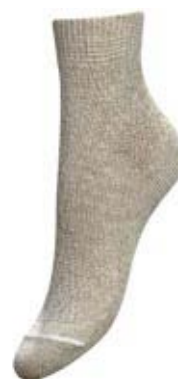
Артикул С 89 – 1