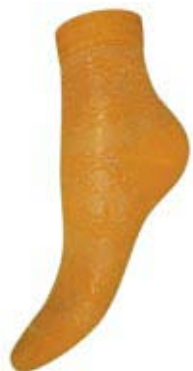
Артикул С 863