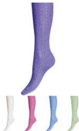
Артикул С 714