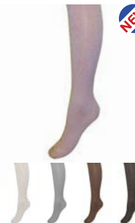
Артикул С 737