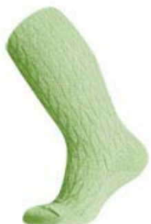
Артикул С 7038