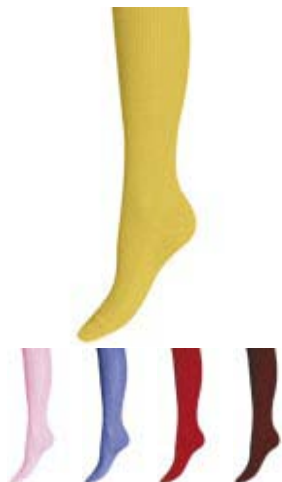
Артикул С 713