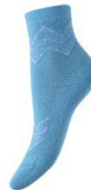
Артикул С 844