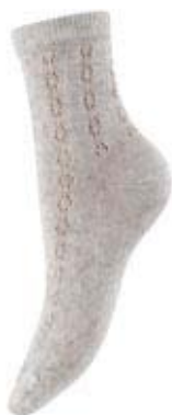
Артикул С 87