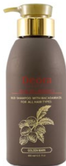
Шампунь грязевой с маслом макадамии для всех типов волос, 400 мл. / Mud shampoo with macadamia oil for all hair types, 400 ml

Шампунь обладает уникальным составом: сочетание минералов грязи и соли Мертвого моря, масел ореха макадамии, репейного и корня имбиря, масляного экстракта жгучего перца, протеинов овса и экстракта розмарина. Предотвращает выпадение и ослабление волос, укрепляя их корни. Заметно улучшает состояние кожи головы, питает корни волос для восстановления их роста, хорошо увлажняет волосы, обогащая их протеинами и минералами. Предотвращает появление перхоти. Шампунь подходит для частого использования.