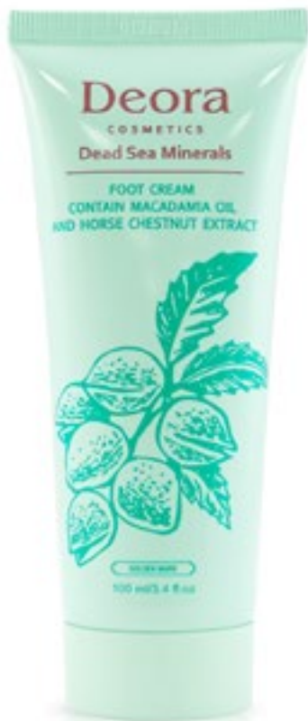
Крем для ног с маслом макадамии и экстрактом каштана конского, 100 мл. / Foot cream with macadamia oil and horse chestnut extract, 100 ml

Крем, в сбалансированную формулу которого, включены масла макадамии, кокоса, ши, экстракты каштана, мирта и сапонарии, известные своими уникальными свойствами. В сочетании с минералами Мёртвого моря оказывает благоприятное воздействие на кожу ног, уменьшая сетку кровеносных сосудов, увлажняет и питает.