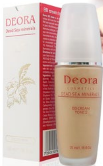
BB крем Тон 2. 35мл. /Blemish Balm (BB) Cream tone 2. 35ml