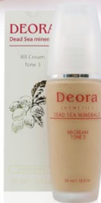
BB крем Тон 3. 35 мл. /Blemish Balm (BB) Cream tone 3, 35 ml