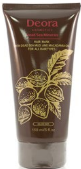
Маска грязевая для всех типов волос с маслом макадамии, 150 мл. / Hair mask with Dead Sea mud and macadamia oil for all hair types, 150ml

Благодаря уникальному сочетанию минералов Мёртвого моря и масла ореха макадамии, маска оказывает интенсивное восстанавливающее действие на волосы и кожу головы. Содержит масла арганы, ши, каротины моркови, протеины овса и грязь Мёртвого моря. Эффективно восстанавливает повреждённые волосы, обогащая их витаминами и микроэлементами. Укрепляет и увлажняет волосы. Усиливает микроциркуляцию крови в волосяных луковицах, что способствует росту волос. Быстро и заметно улучшает качество волос, делая их крепкими и упругими. Предотвращает появление перхоти.