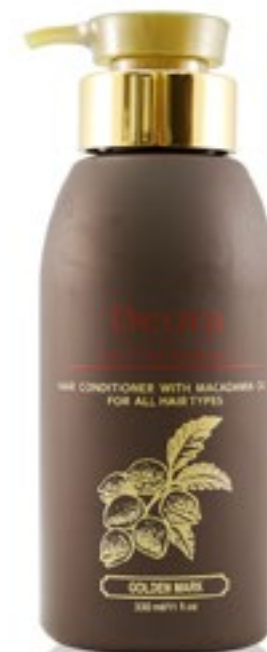
Кондиционер с маслом макадамии для всех типов волос, 330 мл. / Hair conditioner with macadamia oil for all hair types, 330ml

Кондиционер смягчает, увлажняет и питает волосы по всей длине. Придает здоровый вид, мягкость и блеск, предотвращает ломкость. Препятствует появлению секущихся кончиков и укрепляет корни волос. Кондиционер содержит масла макадамии, каротины моркови, протеины овса, экстракт мирта и минералы Мертвого моря. Кондиционер подходит для всех типов волос, особенно для окрашенных и повреждённых, а также склонных к выпадению. Облегчает расчесывание и укладку волос. Защищает от неблагоприятных факторов окружающей среды.