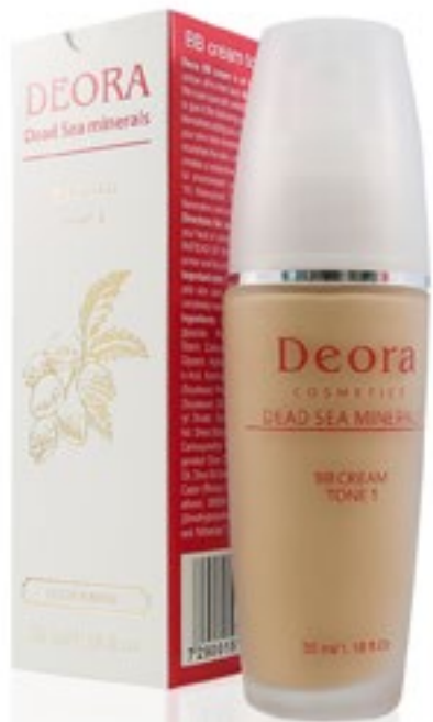
BB крем Тон 1. 35мл. /Blemish Balm (BB) Cream tone 1. 35ml

Blemish Balm Cream Deora- это инновационное, уникальное и универсальное средство для ухода за кожей лица. Благодаря специально разработанному нами составу обладает следующими свойствами: маскирует недостатки на коже лица, заменяя корректор, выравнивает цвет лица, подстраиваясь под особенности вашей кожи, увлажняет и питает кожу, разглаживает морщины и создаёт защитный барьер от вредного воздействия окружающей среды и солнечного излучения (SPF 10) . Водостойкий. Обладает противовоспалительным и антиоксидантным свойством.