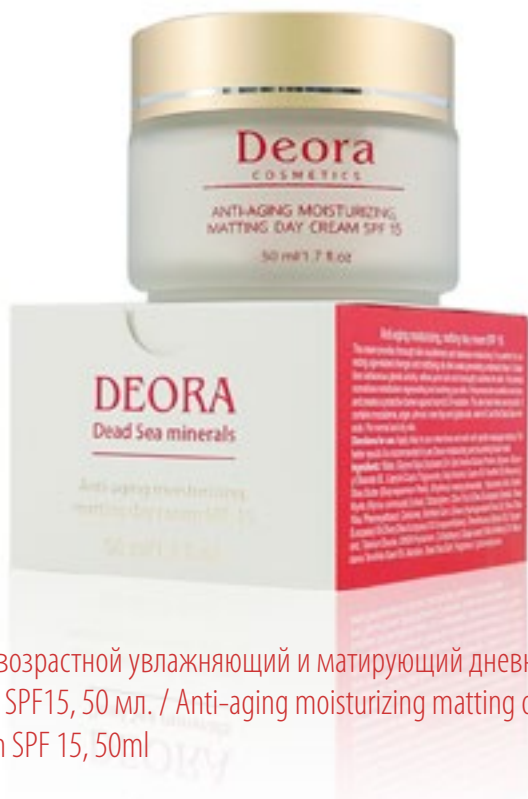
Антивозрастной увлажняющий и матирующий дневной крем SPF15, 50 мл. / Anti-aging moisturizing matting day cream SPF 15, 50ml

Крем обеспечивает комплексное питание и интенсивное увлажнение кожи. Прекрасно корректирует возрастные изменения, матирует жирные участки кожи, предотвращая появление нежелательного блеска. Стабилизирует деятельность сальных желез, обладает поросуживающим и интенсивным успокаивающим свойствами. Нормализует обмен веществ, оказывая обновляющее и успокаивающее воздействие на кожу. Улучшает ее внешний вид и цвет. Создает защитный барьер от вредного воздействия солнечного излучения. Придает коже ощущение свежести и мягкости.