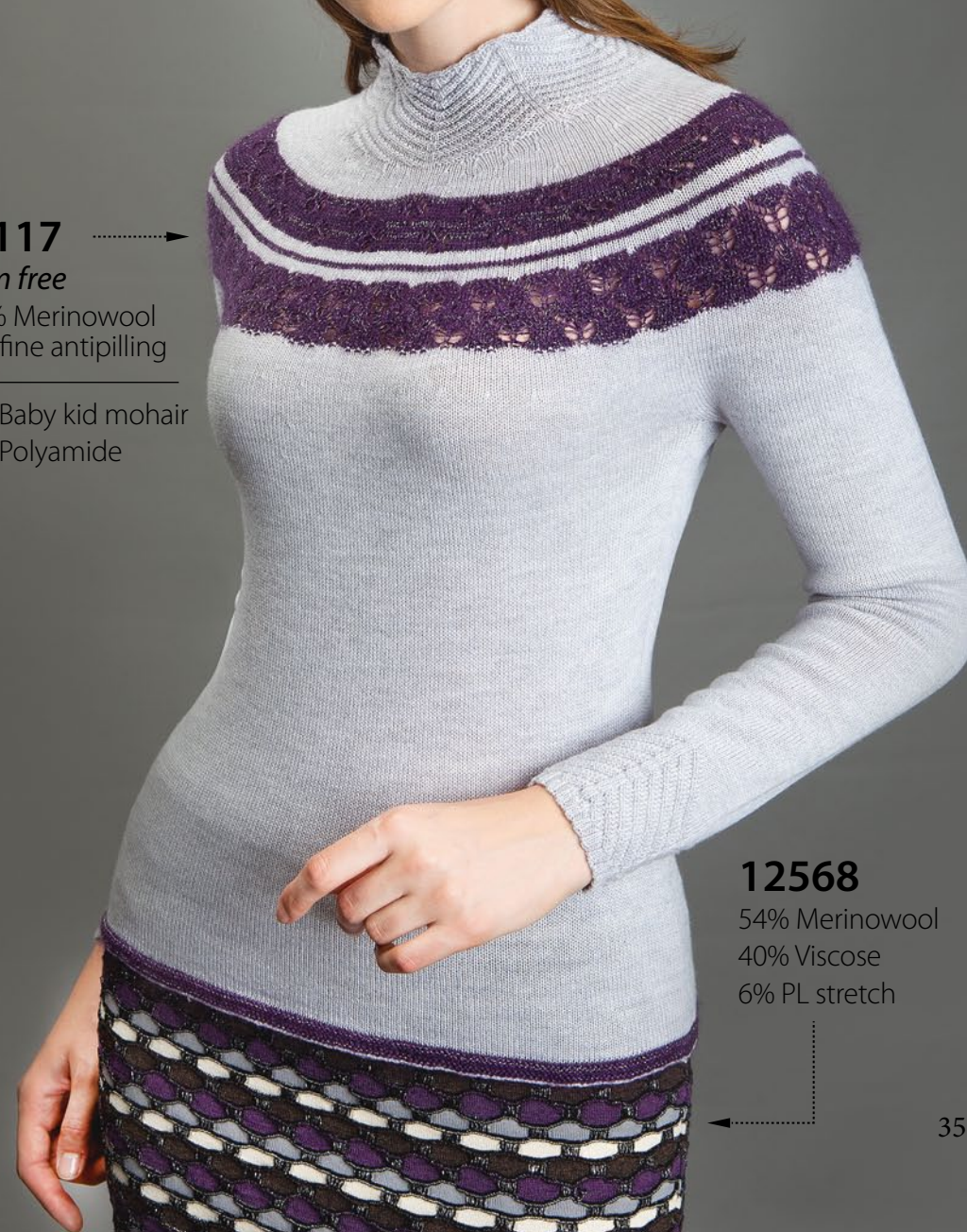
12568 54% Merinowool 40% Viscose 6% PL stretch