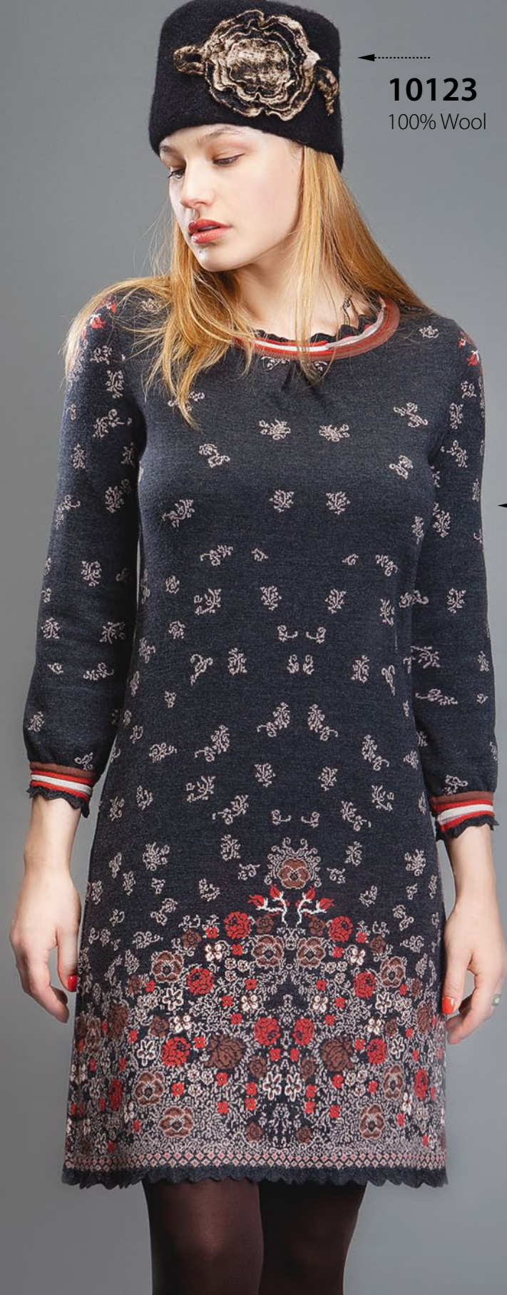
10123 100% Wool