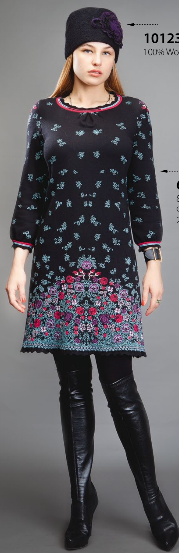
10123 100% Wool