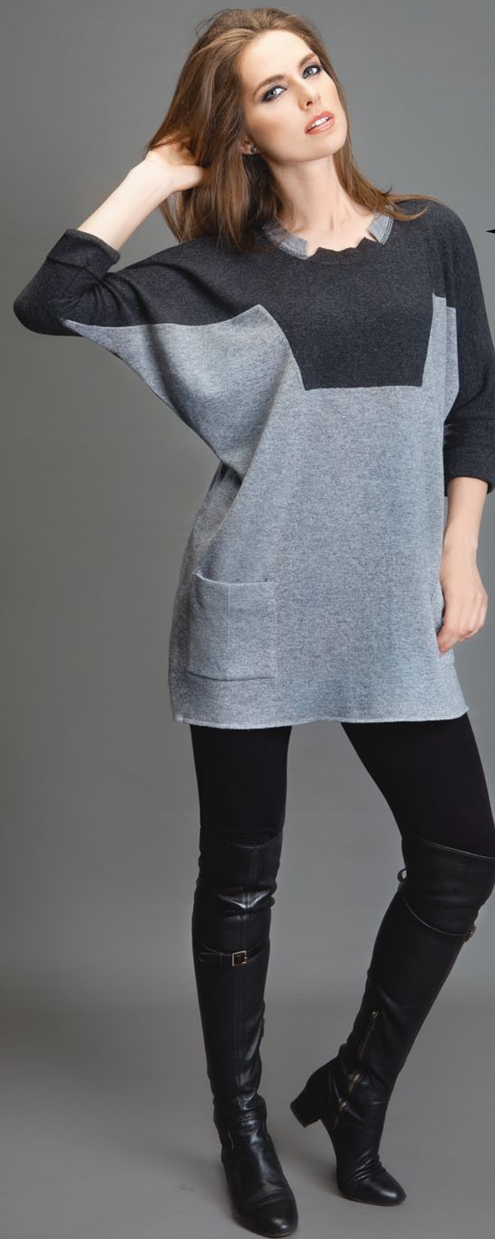
← 67319 seam free 20% Cashmere 35% Merinowool 30% Viscose 15% Microfiber