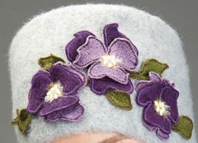
10113 100% Wool