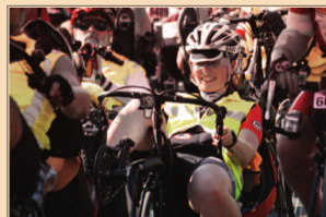
Календарь французских и международных бrevетов: www.paris-brest-paris.org

С 21 февраля по 10 мая С 4 апреля по 25 мая С 18 апреля по 1 июня С 8 мая по 28 июня