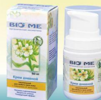
Крем особенно рекомендуется использовать в качестве дневного питательного крема людям со склонностью к пигментации

Состав: гелевая основа, гель хитозановый, вода, масло льняное, масло виноградной косточки, лецитин соевый, титана окись, молаки лососевых рыб, толокнянки трава, масло ши, экстракт лимонника, цветки суданской розы, лавитол, калия сорбат, витамин С, эфирное масло розы, витамины А и Е, соль морская, кислота гиалуроновая, эфирное масло нероли, цинка сульфат.