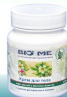
Крем можно использовать для массажа или в качестве питательного и увлажняющего крема для тела

Состав: масло жожоба, масло абрикосовой косточки, воск пчелиный, масло вазелиновое, витамин Е, эфирное масло мяты.