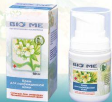
Крем содержит шикониновое масло

Состав: гелевая основа, гель хитозановый, масло авокадо, вода, экстракт календулы, масло виноградное, масло каритэ (ши), масло шикониновое, воск пчелиный, бетаин, калия сорбат, соль морская, цинка сульфат, лавитол, кислота гиалуроновая, эфирное масло лаванды, эфирное масло розы.