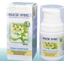
Крем учитывает потребности кожи жителей городов в защите от внешних влияний среды; питает, увлажняет и укрепляет капилляры; может быть использован в качестве дневного крема под макияж.

Состав: гелевая основа, гель хитозановый, вода, масло виноградное, масло соевое, сок яблочный, норковое масло, титана окись, соль морская, травы манжетки и бадана, лавитол, калия сорбат, толокнянки трава, отдушка, витамин С, эфирное масло иланг-иланг, кислота гиалуроновая, витамин А.