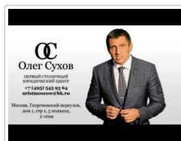
Притворность сделки ЗАО как основание обращения в суд