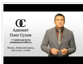
Компенсация в случае, если квартира приобретается не по закону 214 ФЗ