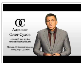
Взыскание убытков при неисполнении договора поставки