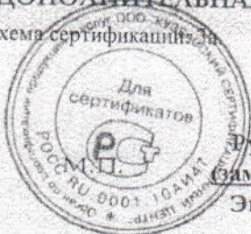
Схема сертификации: За

Руководитель органа (заместитель руководителя) Эксперт