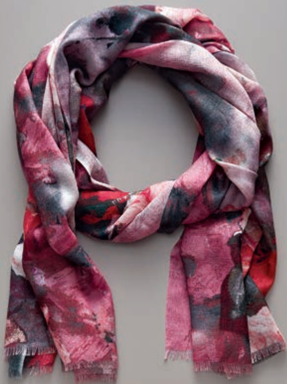
page 114 A0127 V