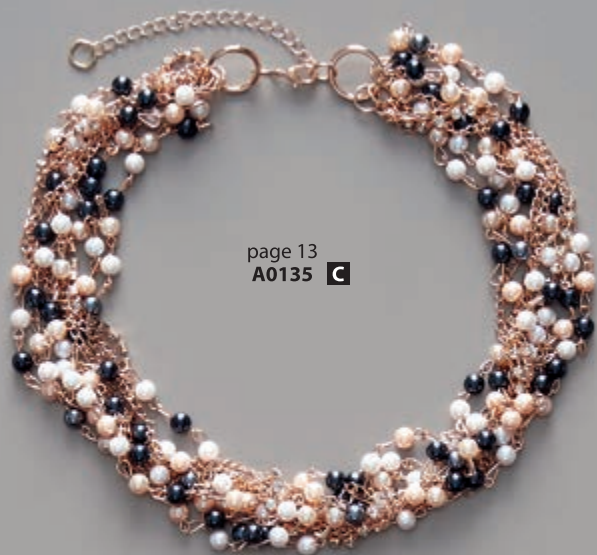
page 13 A0135 C