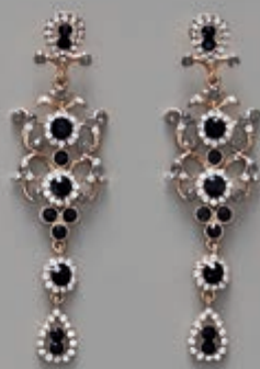
page 123 A0137 C

A0137 C Gari auskari, garums 10 cm. / Длинные серьги, длина 10 см. / Long earrings, length 10 cm. B