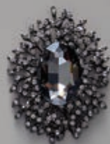
page 80 A0141 B

A0133 Z Piekariņš ar metāla ķēdīti. Piekariņa izmērs 3,5 cm, ķēdītes garums ~ 100 cm. / Кулон на цепочке, из металла. Размер кулона 3,5 см. Длина цепочки ~ 100 см. / Pendant with metal chain. Pendant size 3,5 cm. Chain length ~ 100 cm