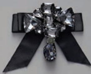
page 87 A0142 B