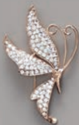
page 83 A0143 C

A0135 C Krāsainu krellišu un akmentiņu kaklarota, garums ap. 45 cm. / Ожерелье, состоящее из разноцветных бусин и страз, длина прим. 45 см. / Necklace, consisting of multicolored beads and rhinestones. Length approx. 45 cm.