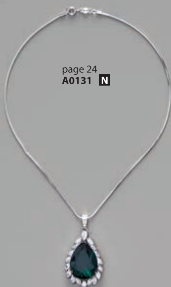
page 24 A0131 N