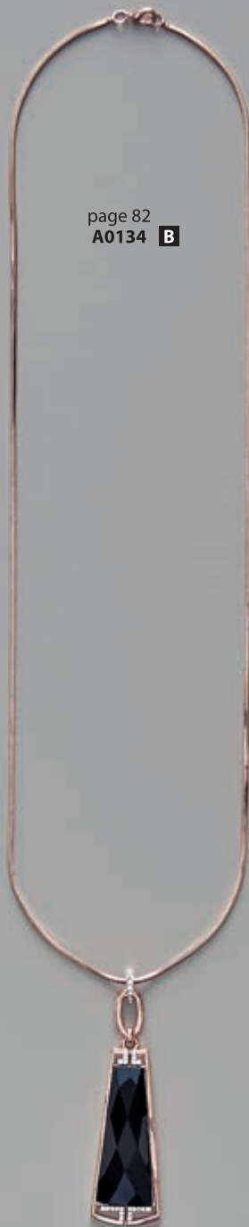
page 82 A0134 B