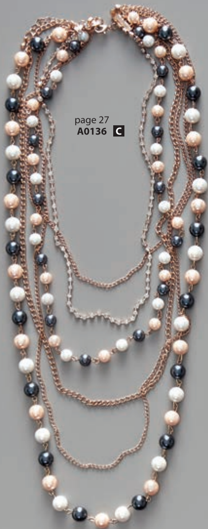
page 27 A0136 C