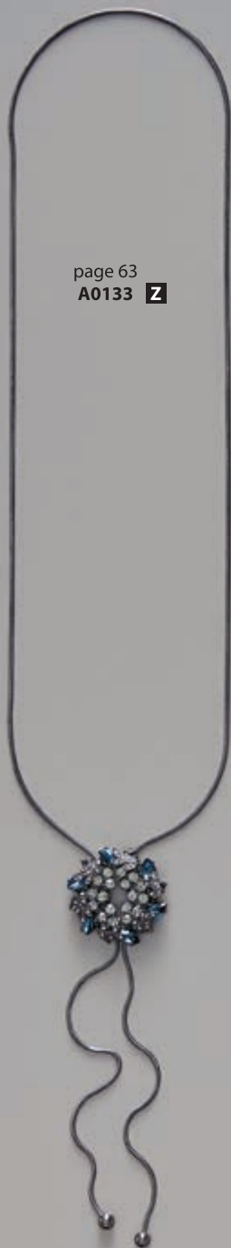
page 63 A0133 Z