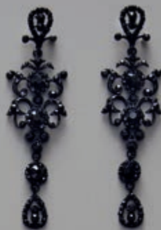
page 128 A0137 B