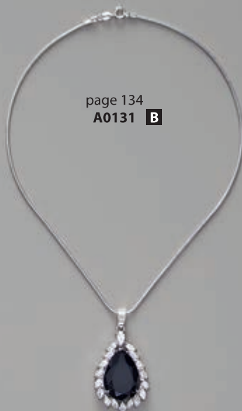
page 134 A0131 B

A0135 R Piekariņš uz sudraba imitācijas metāla ķēdītes. Piekariņa garums 5 cm. Ķēdītes garums apm. 45 cm. / Кулон на цепочке, из металла, имитация серебра. Длина кулона 5 см. Длина цепочки прим. 45 см. / Pendant with faux silver chain. Pendant length 5 cm. Chain length appr. 45 cm.