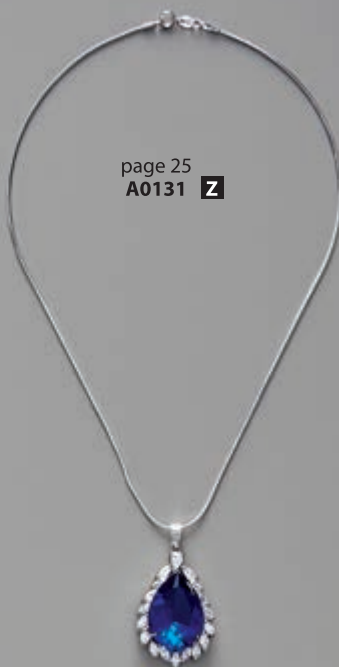
page 25 A0131 Z