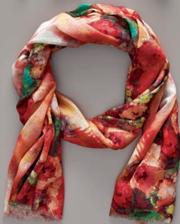
page 120 A0127 O

A0127 V Vilnas šalle. Sastāvs: 100% vilna. Izmērs: 190x67 cm. / Шерстяная шаль. Состав: 100% шерсть. Размер: 190x67 см. / Woolen shawl. Contents: 100% wool. Size: 190x67 cm.