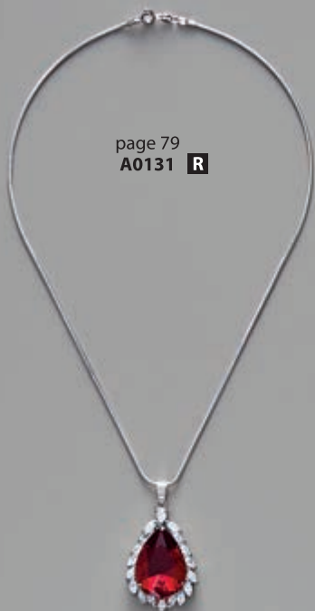
page 79 A0131 R