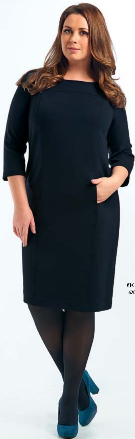
❶ Classic 62000 A