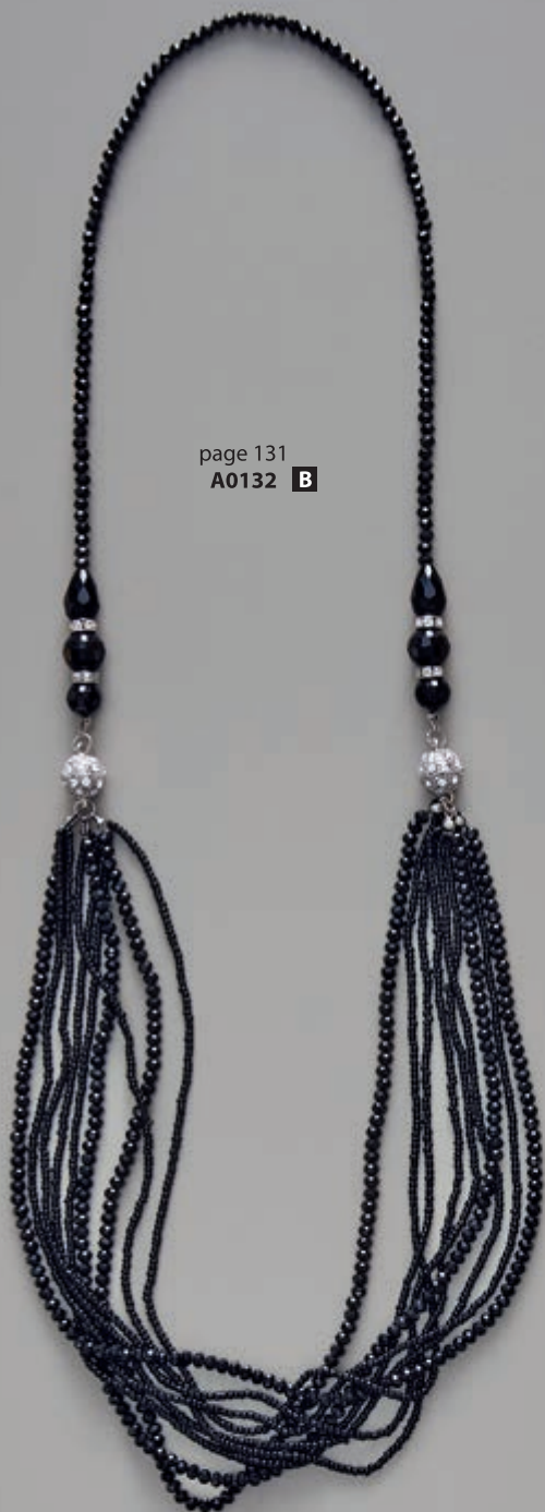
page 131 A0132 B