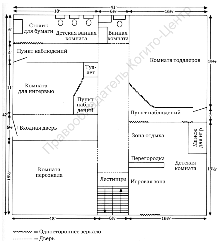
Рис. 3. План этажа. Конечный сеттинг

экспериментировали со своим телом и его возрастающими возможностями: усаживались и опрокидывались на спину, тянулись к игрушке, пытаясь ее ухватить, вытягивались, стараясь повернуться в сторону матери, чей голос они могли слышать, когда она не находилась в их поле зрения. Они смотрели на нее из манежа и улыбками и агуканьем приглашали ее подойти и поиграть. Они самостоятельно играли с игрушками, особенно с теми, которые могли бы послужить для создания «увлекательных зрелищ» (Piaget, 1937). Матери были вольны разговаривать друг с другом и взаимодействовать со своими детьми, как им того захочется.