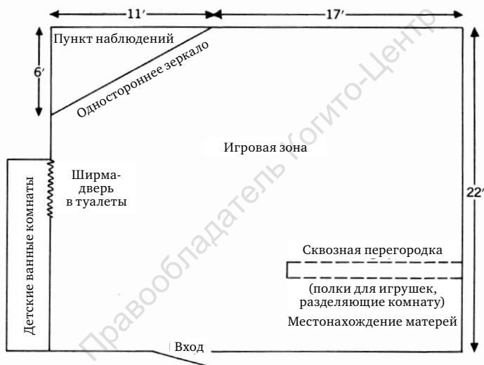
Рис. 1. Комната матерей и маленьких детей. Первоначальный сеттинг

данных (ориентирующие вопросы, наблюдение по зонам исходя из наших психоаналитически заданных рамок установления взаимосвязей, построение формулировок относительно ранних образований характера как производных процесса сепарации-индивидуации).