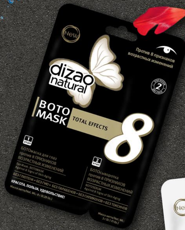
БОТОмаска для глаз Total Effects Против 8 признаков возрастных изменений