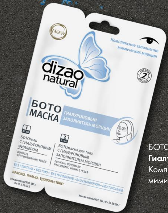
БОТОмаска для глаз Гиалуроновый наполнитель морщин Комплексное заполнение мимических морщин