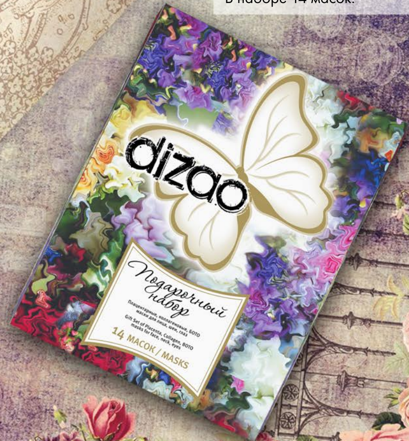
Подарочный набор. Плацентарные, коллагеновые, БОТОмаски для лица, шеи и глаз. В наборе 14 масок.