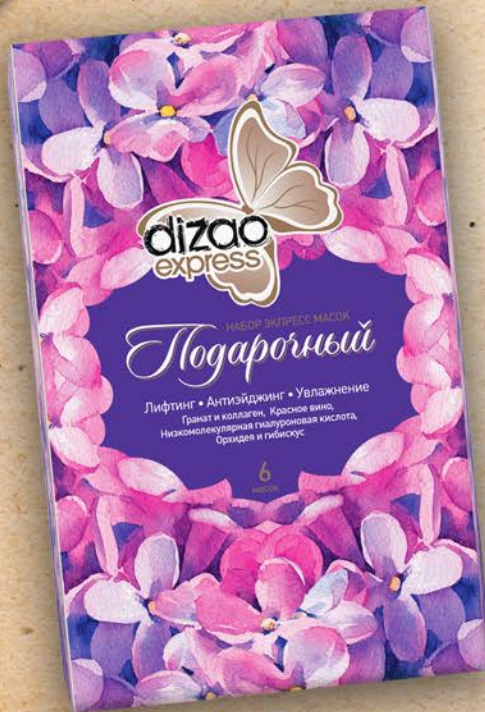
Подарочный набор экспресс масок. Лифтинг, Антиэйджинг, Увлажнение. В наборе 6 масок.