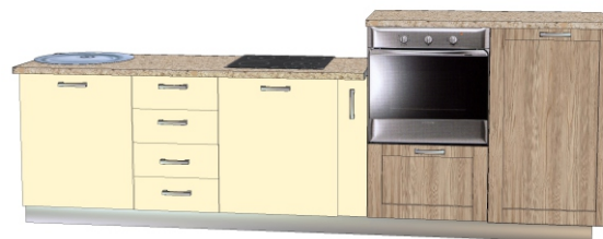
Фасад- ЛДСП «Каньон песчаный» Пластик - «412/S Слоновая кость (АВЕТ)» Столешница - «2236 СЕМОЛИНА БЕЖЕВАЯ»