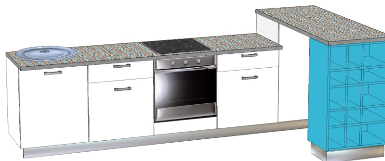
Фасад- ЛДСП «Пикард» Пластик -0001_LU_Белый_(АРПА) Столешница - «0110 МАРАКЕШ» Цветные полки ЛДСП «Топаз»