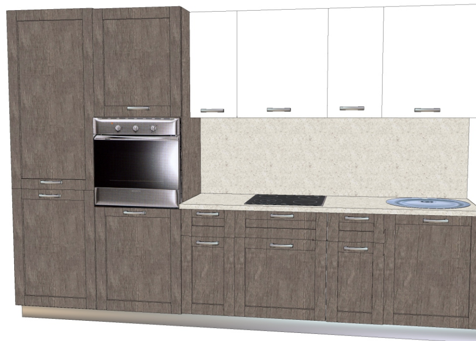
Фасад- ЛДСП «Дуб антик» Пластик -«130/S Белый (АВЕТ)» Столешница - «2236 СЕМОЛИНА БЕЖЕВАЯ»

Темные фасады в цвете «Дуб антик» рекомендуется сочетать со светлыми тонами пластиков и светлыми столешницами