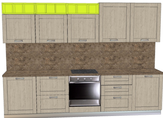
Фасад- ЛДСП «Пикард» Столешница - «4035К_АЛАМБРА ТЕМНАЯ» Цветные полки ЛДСП «Лайм»