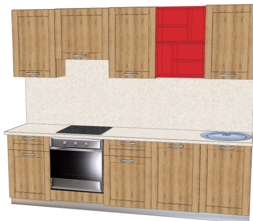
Фасад- ЛДСП «Дуб баррик светлый» Столешница - «2236 СЕМОЛИНА БЕЖЕВАЯ» Цветные полки ЛДСП «Красный»