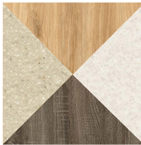
Дуб баррик светлый

2237_СЕМОЛИНА КАРАМЕЛЬНАЯ 2236 СЕМОЛИНА БЕЖЕВАЯ 3231_СОНОМА ТЕМНЫЙ