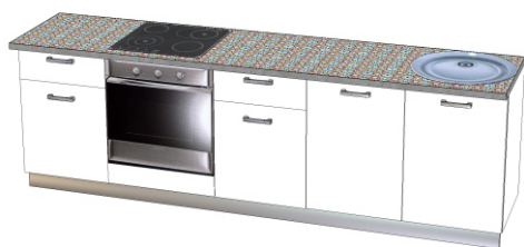
Фасад- ЛДСП «Пикард» Пластик - «130/S Белый (АВЕТ)» Столешница - «110 МАРАКЕШ» Цветные полки ЛДСП «Топаз»