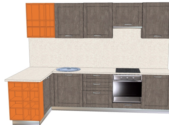
Фасад- ЛДСП «Дуб антик» Столешница - «2236 СЕМОЛИНА БЕЖЕВАЯ» Цветные полки ЛДСП «Оранжевый»