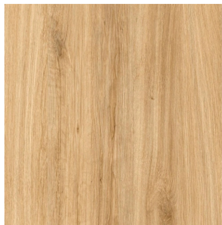
Дуб баррик светлый