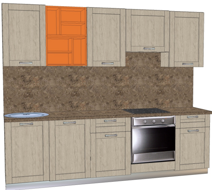
Фасад- ЛДСП «Пикард» Столешница - «Браун 0627 А» Цветные полки ЛДСП «Оранже»