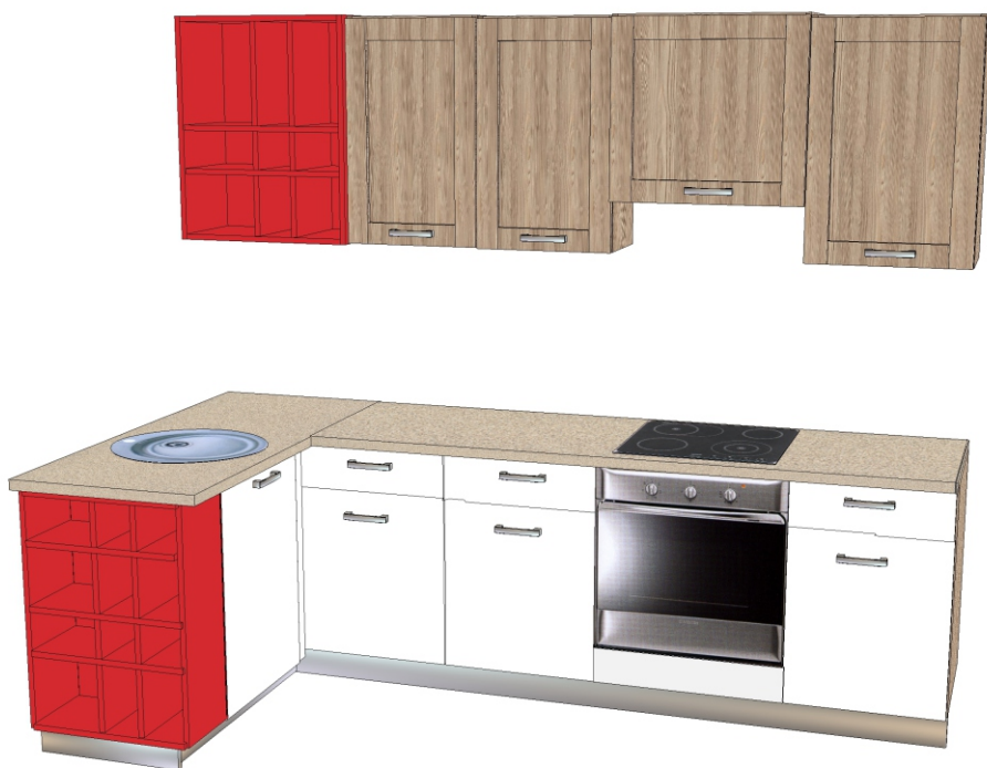
Фасад- ЛДСП «Каньон песчаный» Пластик - «130/S Белый (АВЕТ)» Столешница - «4039_ТАУРУС» Цветные полки ЛДСП «Красный»

Каньон песчаный имеет ярковыраженную полосатую текстуру дерева, и в большом объеме может утомлять, поэтому рекомендуется разбавлять его светлыми тонами пластиков.