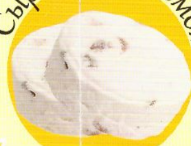
Сырники с изюмом