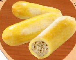
Трубочки картофельные с мясом