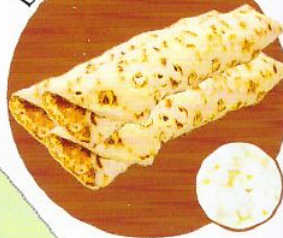
Блины с творогом