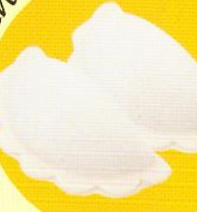
Вареники «Любимые» с творогом