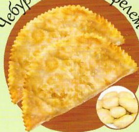
Чебуреки с картофелем