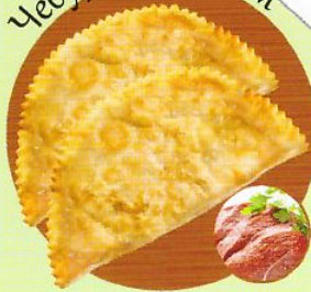
Чебуреки с мясом