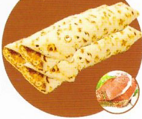
Блины с мясом