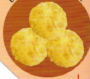
Беляши с мясом