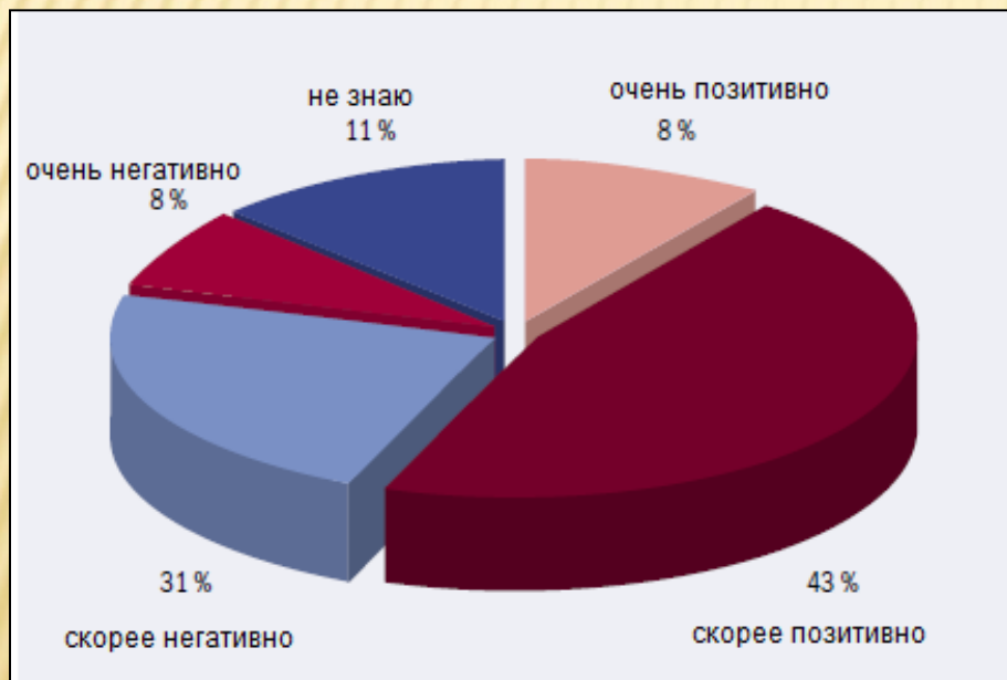
Ожидания граждан о влиянии введения ЕВРО в Словакии 2007