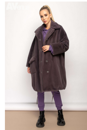
24 - св. антрацит