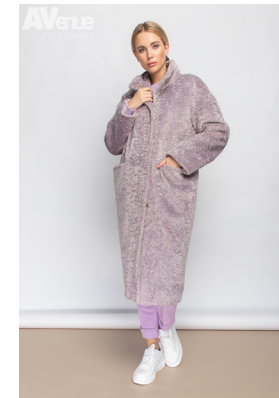
40 - серо-сирен-й