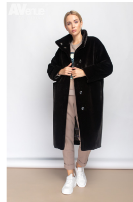
26 - т. шоколад