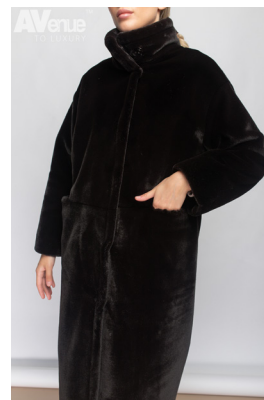
26 - т. шоколад