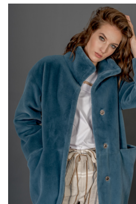
49 - лагуна