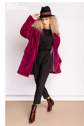
73 - малиновый