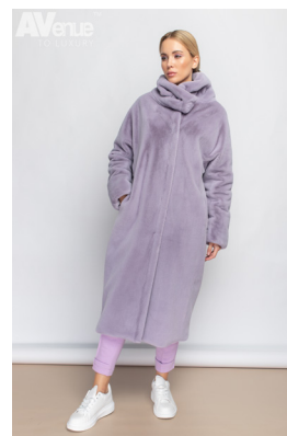
36 - св. сирень