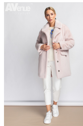
19 - лаванда