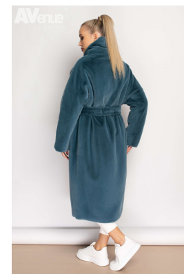
49 - лагуна