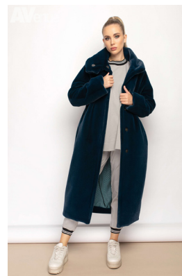
50 - сине-зелёный