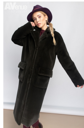
56 - зелёный мох