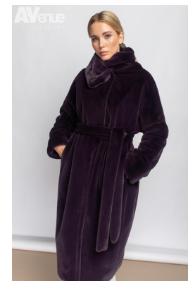
54 - фиолетовый