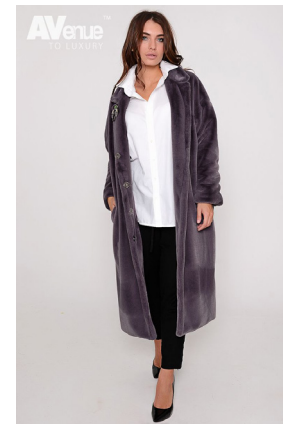
24 - св. антрацит