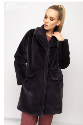
23 - т. антрацит