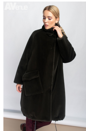
56 - зелёный мох