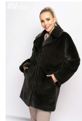
56 - зелёный мох