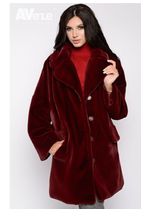
31 - вишнёвый