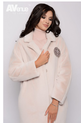
19 - лаванда