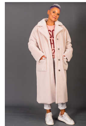
19 - лаванда