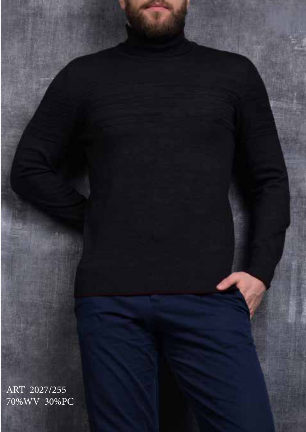
ART 2027/255 70%WV 30%PC