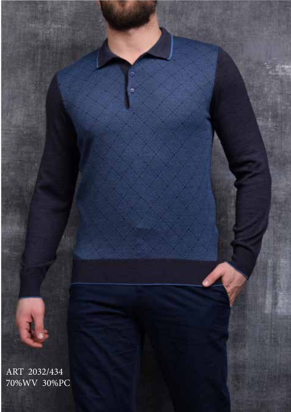
ART 2032/434 70%WV 30%PC