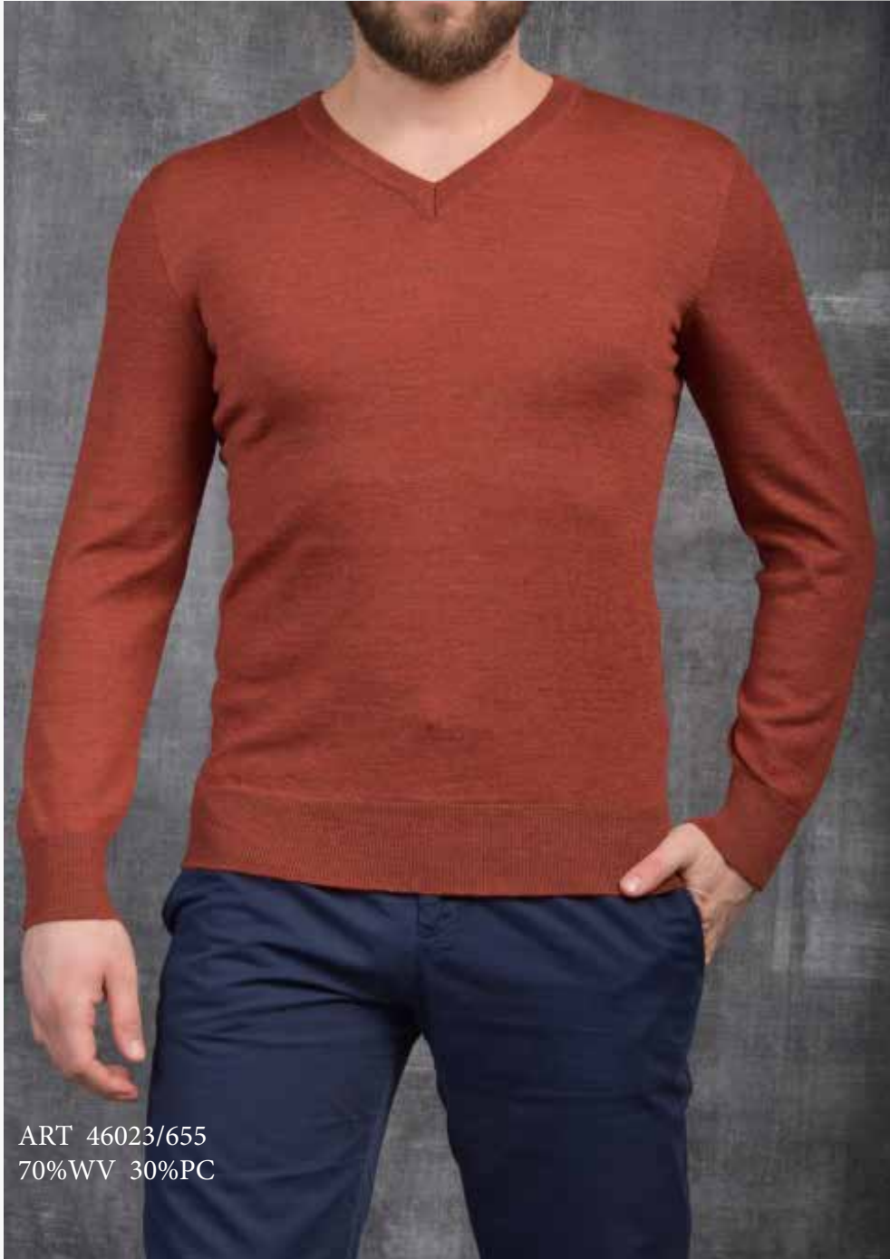
ART 46023/655 70%WV 30%PC