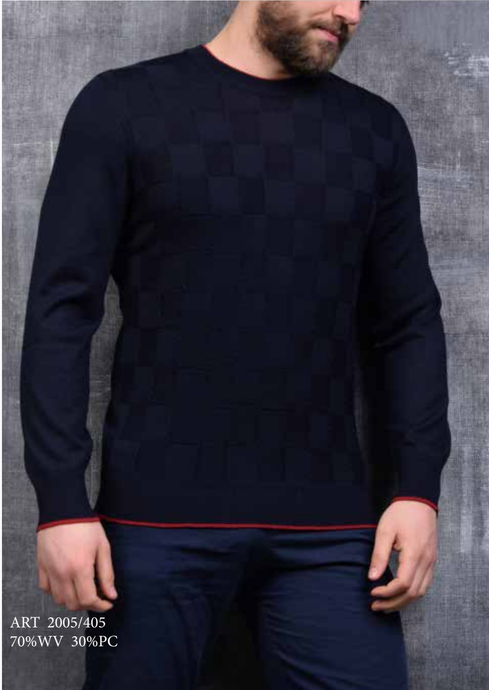
ART 2005/405 70%WV 30%PC