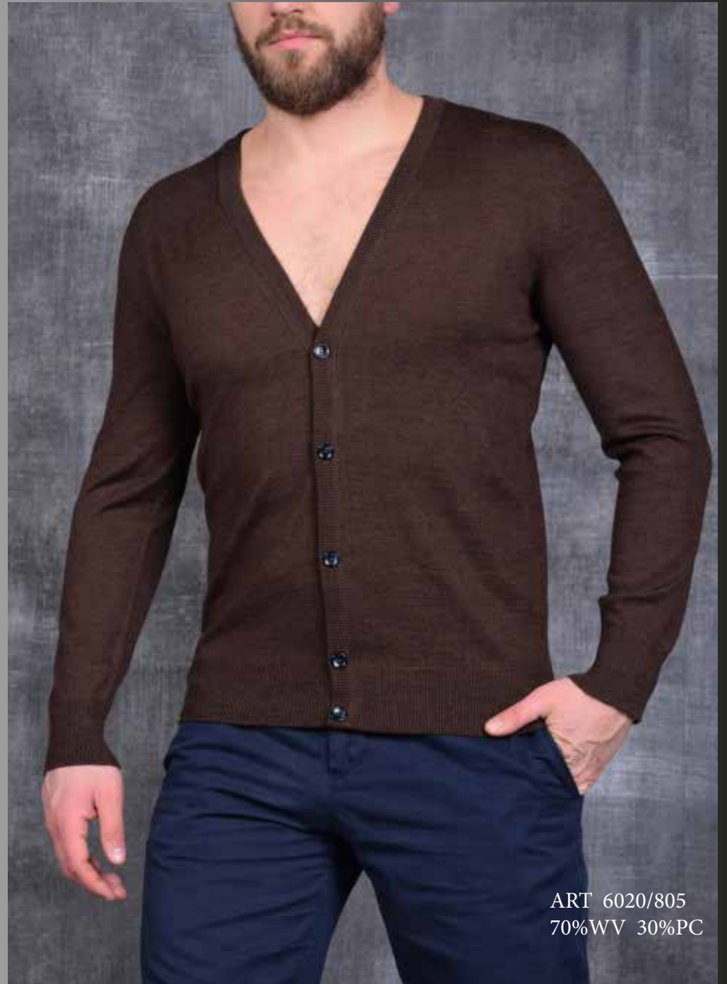
ART 6020/805 70%WV 30%PC