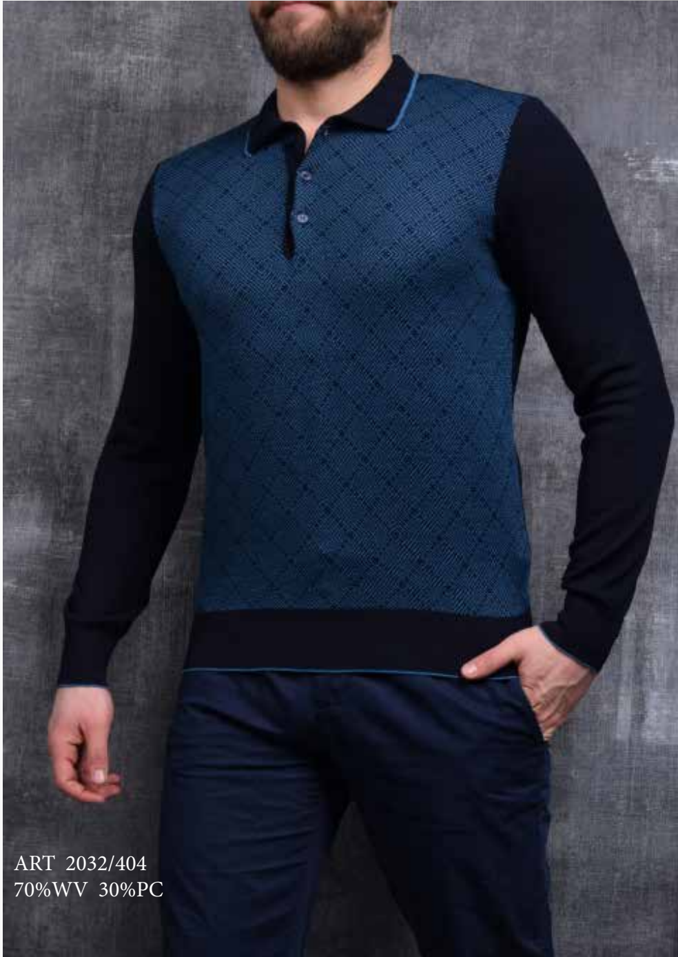
ART 2032/404 70%WV 30%PC