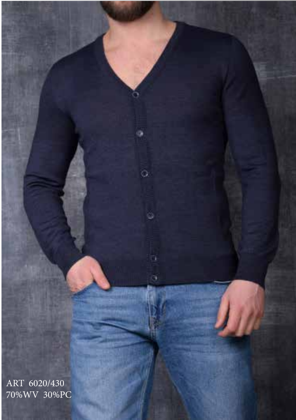
ART 6020/430 70%WV 30%PC