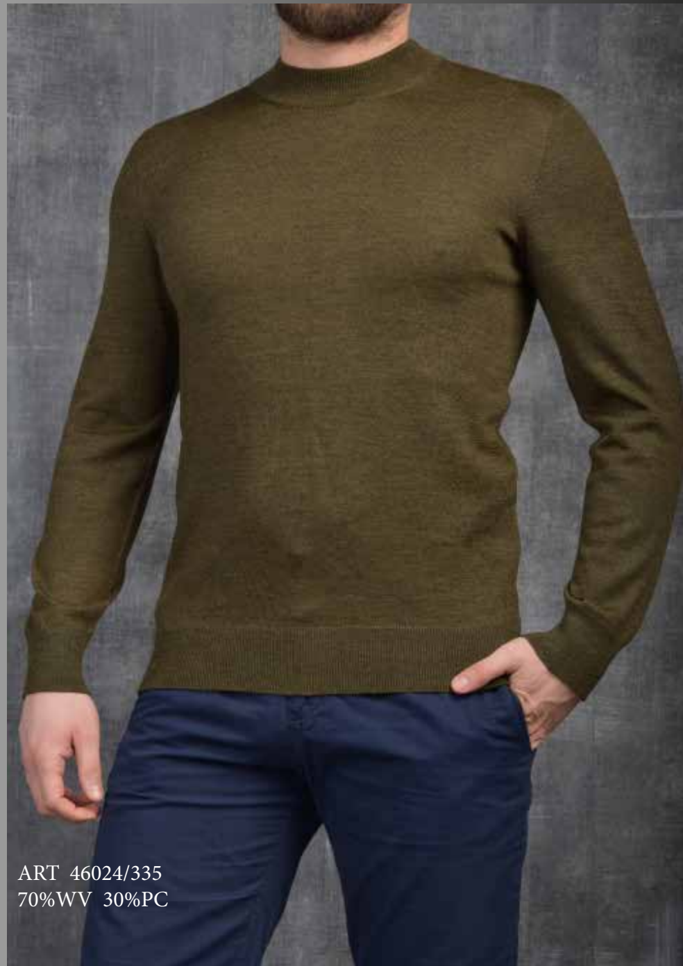
ART 46024/335 70%WV 30%PC