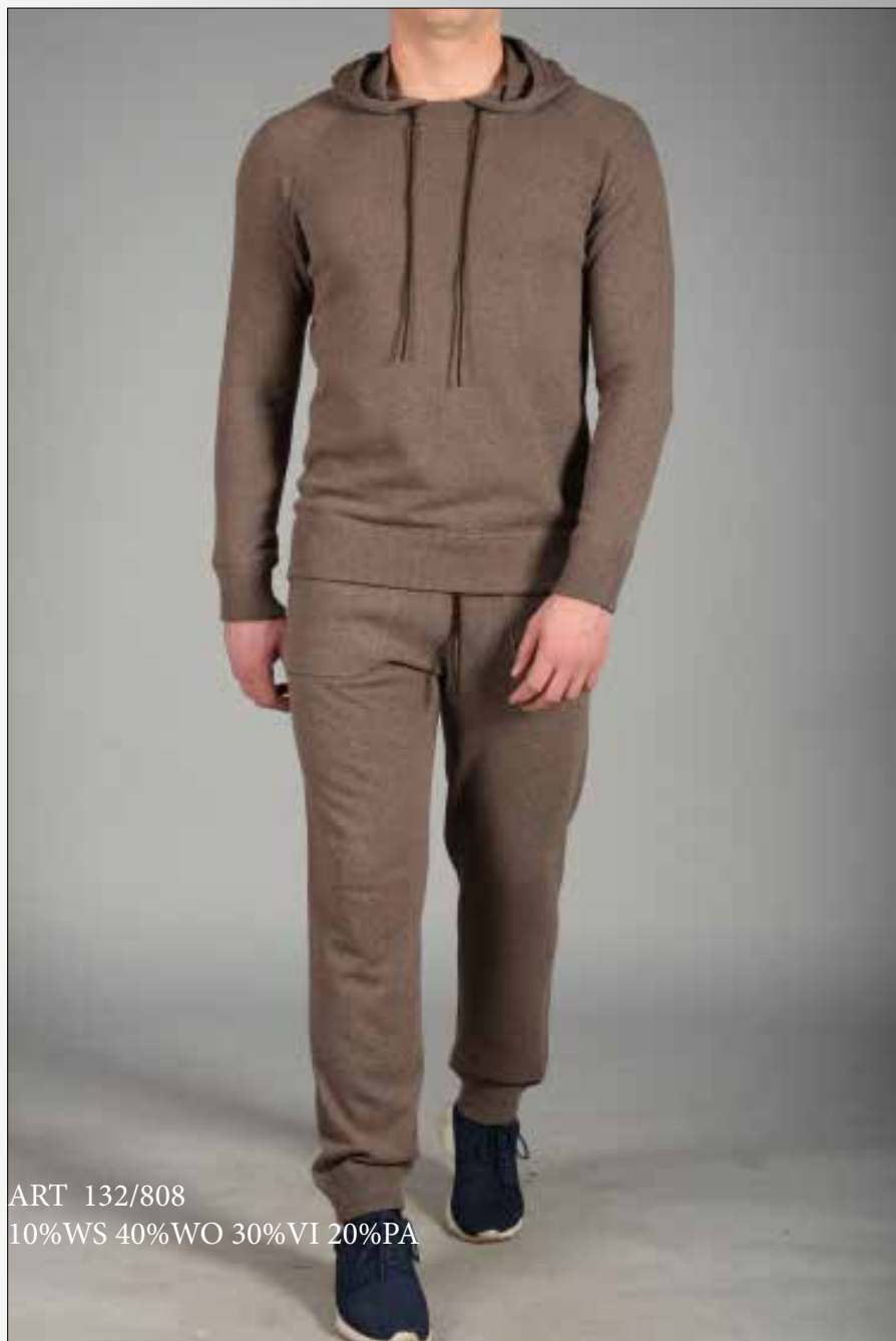
ART 132/808 10%WS 40%WO 30%VI 20%PA