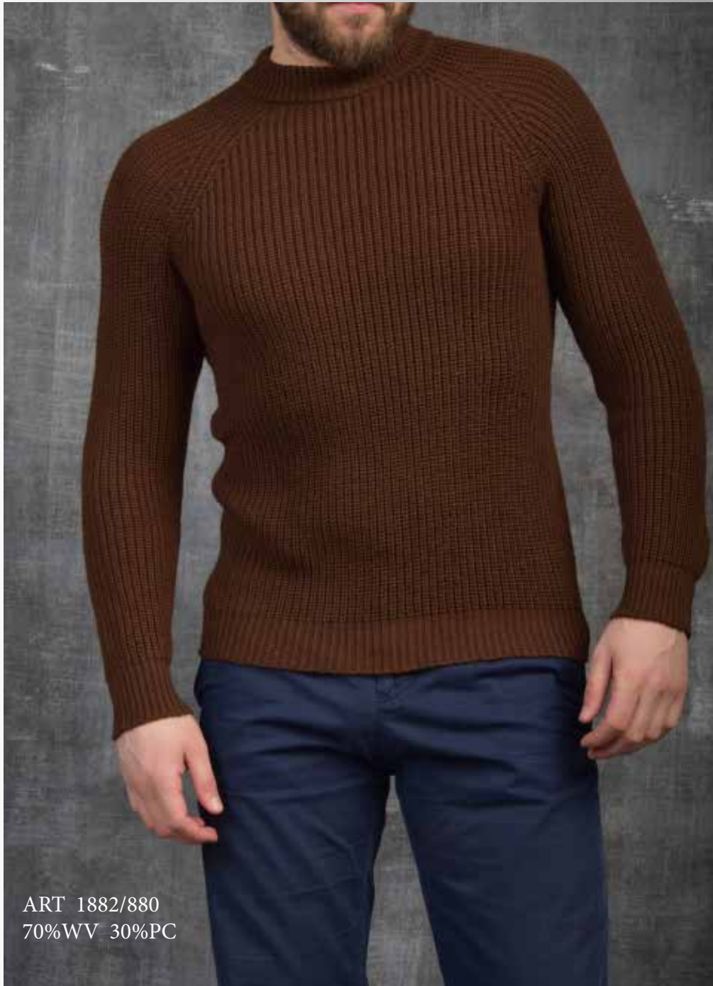
ART 1882/880 70%WV 30%PC