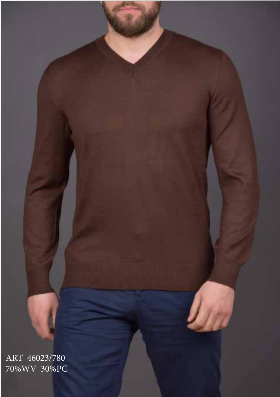
ART 46023/780 70%WV 30%PC