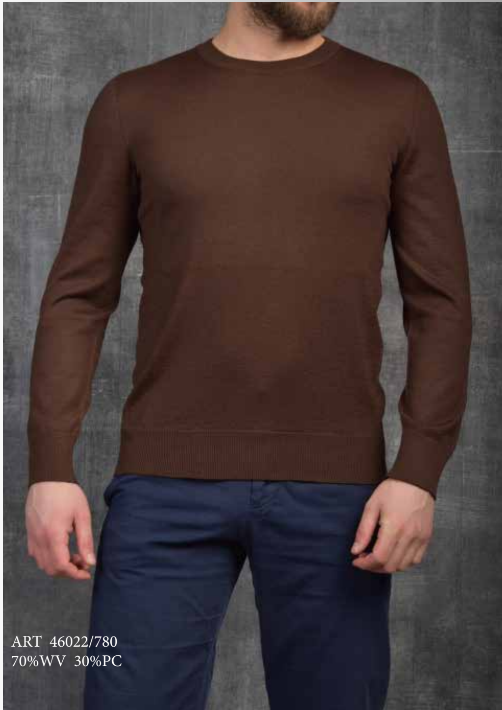
ART 46022/780 70%WV 30%PC