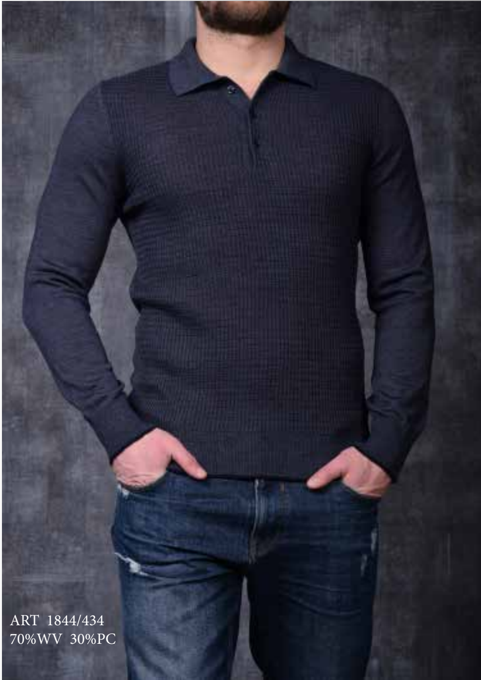
ART 1844/434 70%WV 30%PC