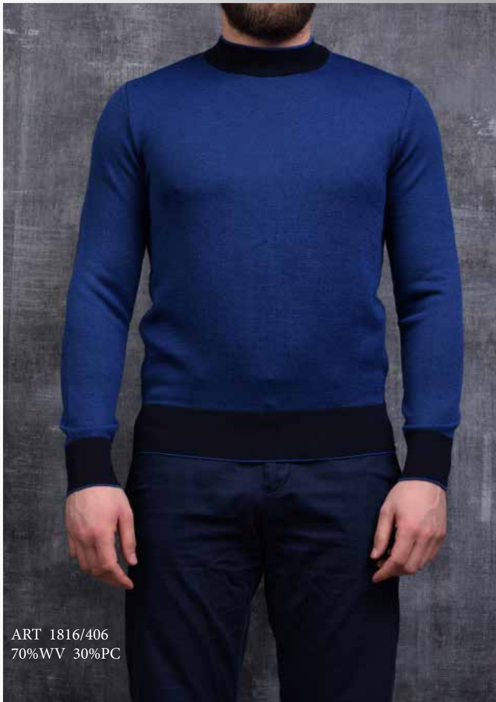
ART 1816/406 70%WV 30%PC