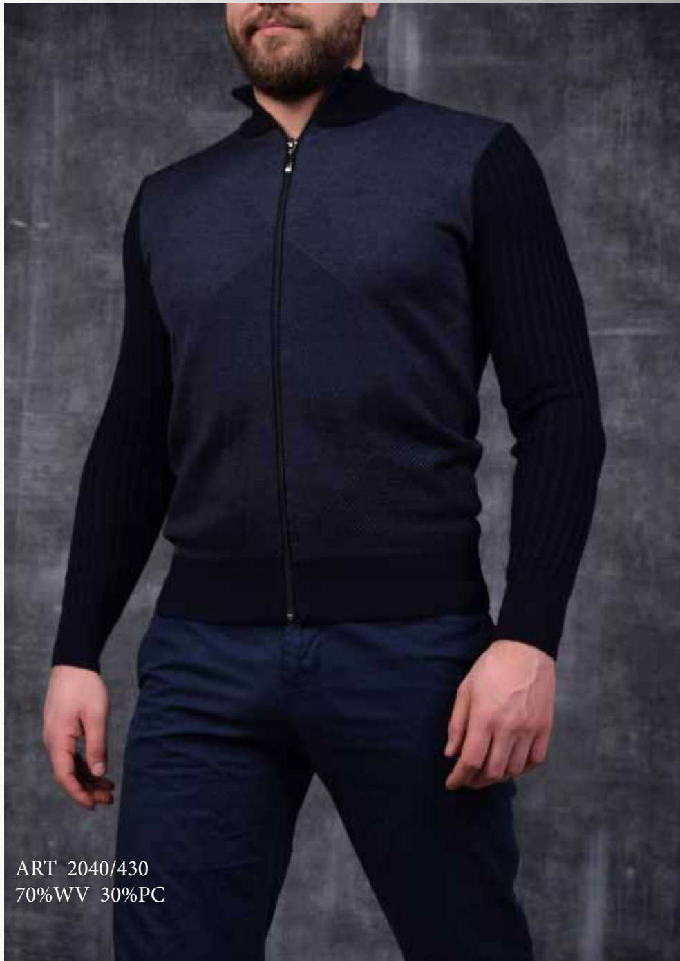
ART 2040/430 70%WV 30%PC