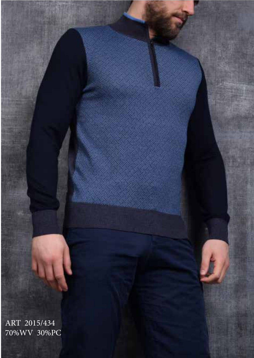
ART 2015/434 70%WV 30%PC