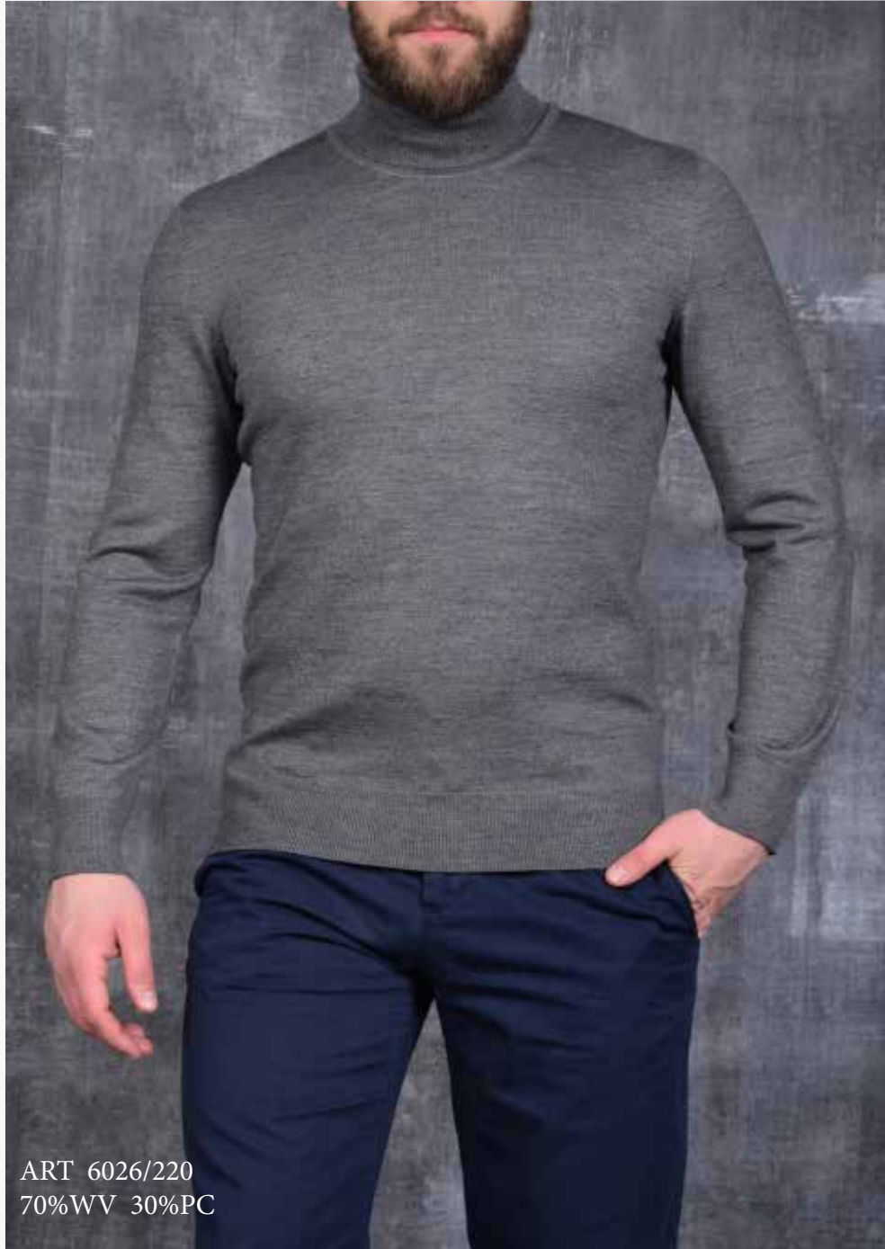
ART 6026/220 70%WV 30%PC