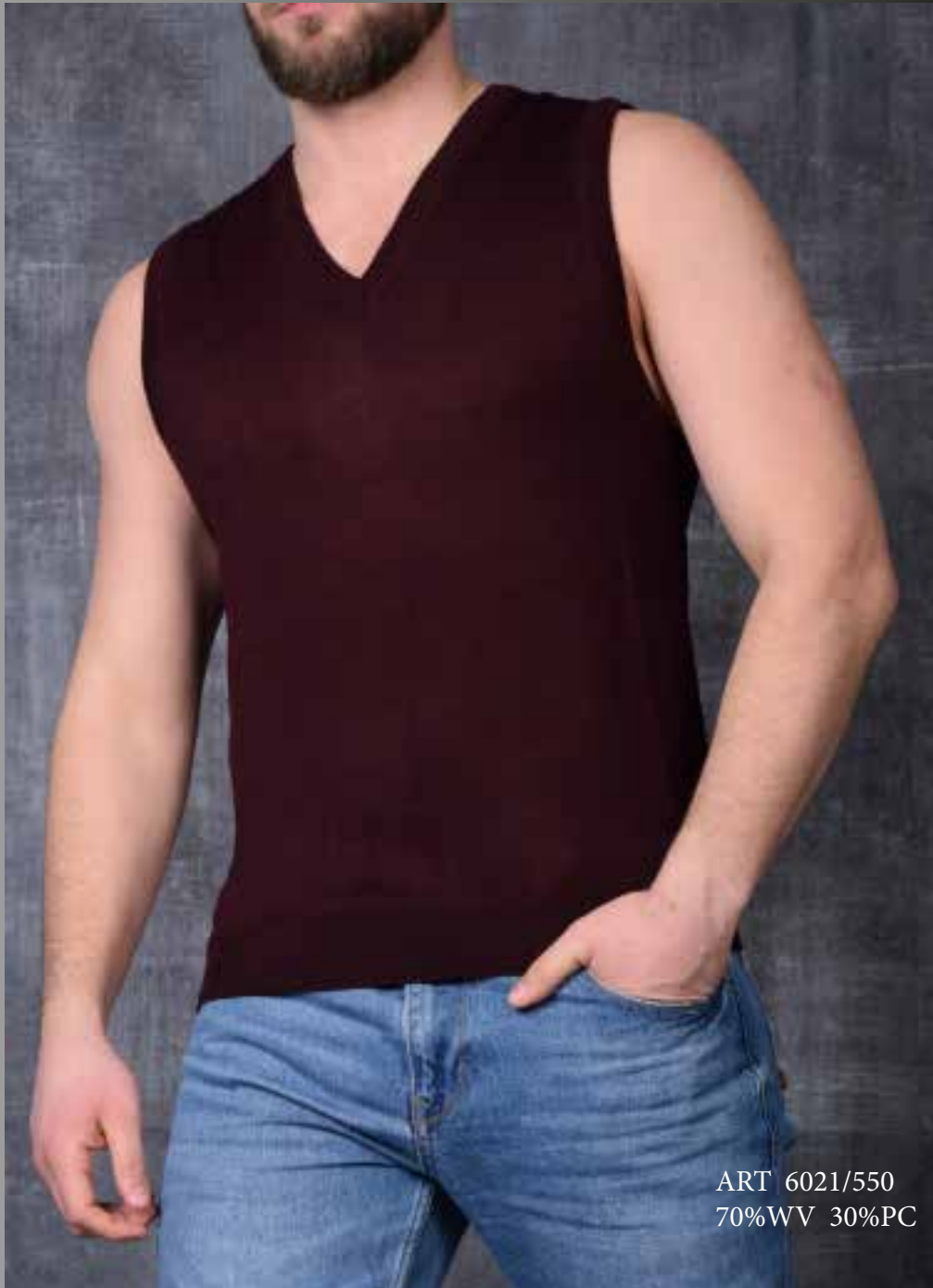
ART 6021/550 70%WV 30%PC