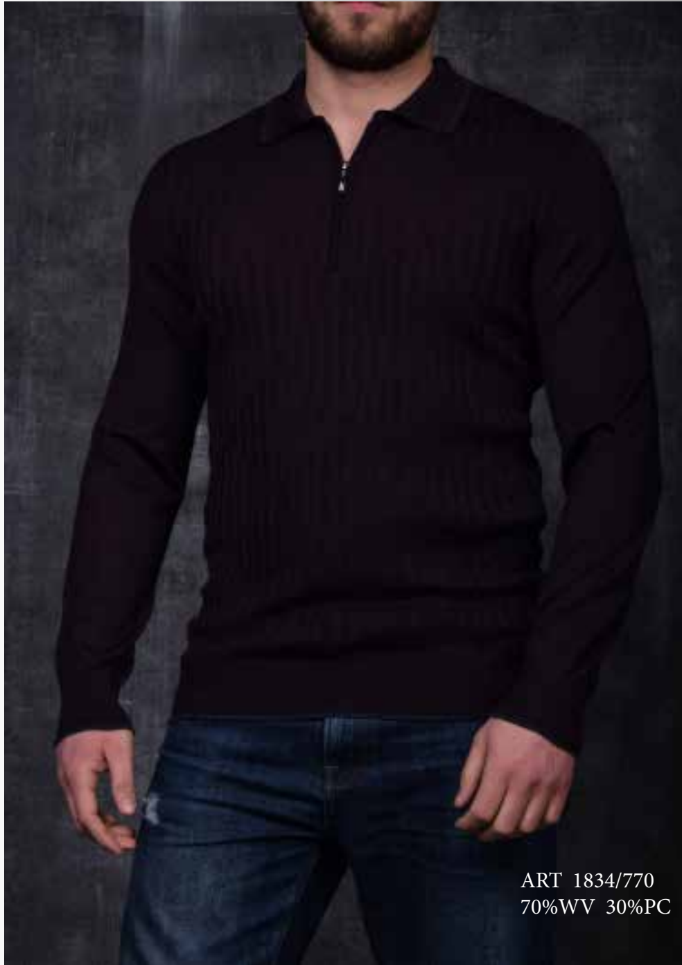
ART 1834/770 70%WV 30%PC