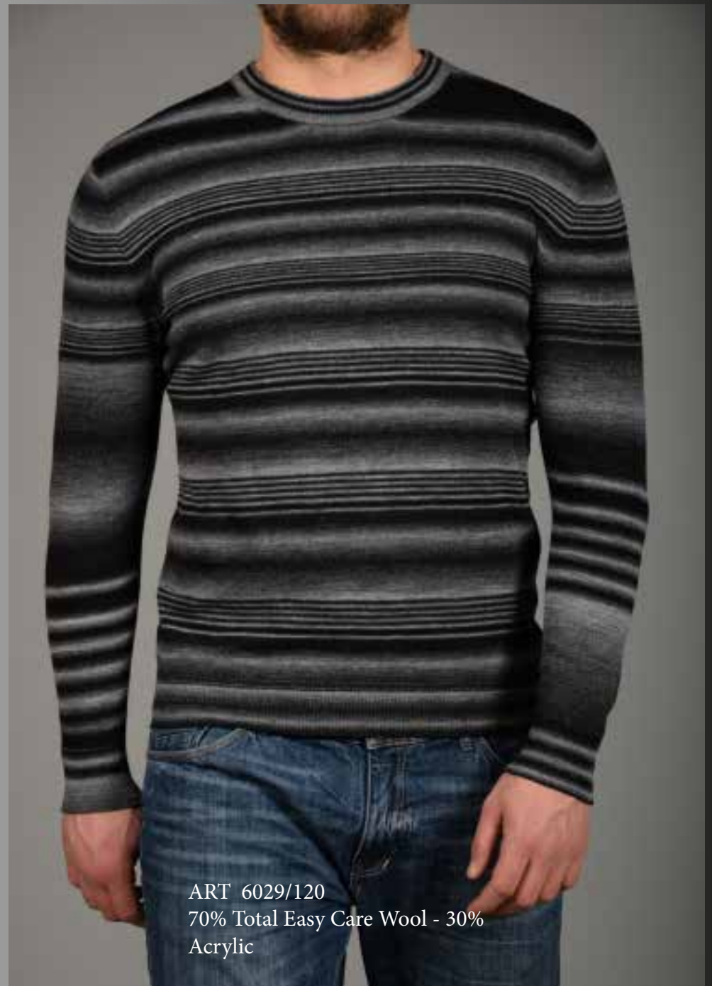
ART 6029/120 70% Total Easy Care Wool - 30% Acrylic