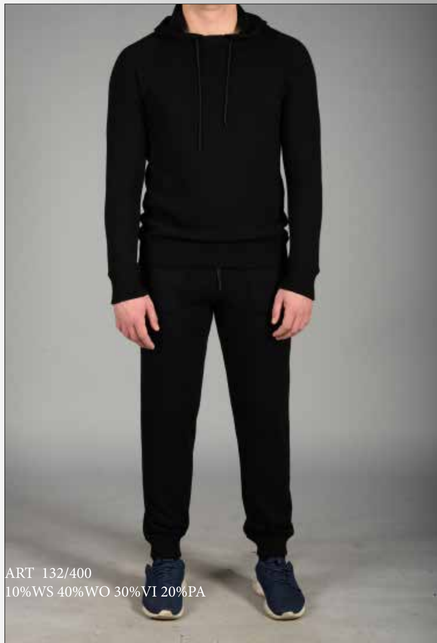
ART 132/400 10%WS 40%WO 30%VI 20%PA