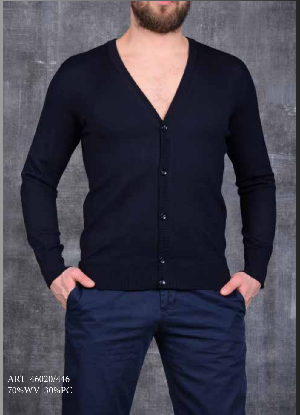
ART 46020/446 70%WV 30%PC