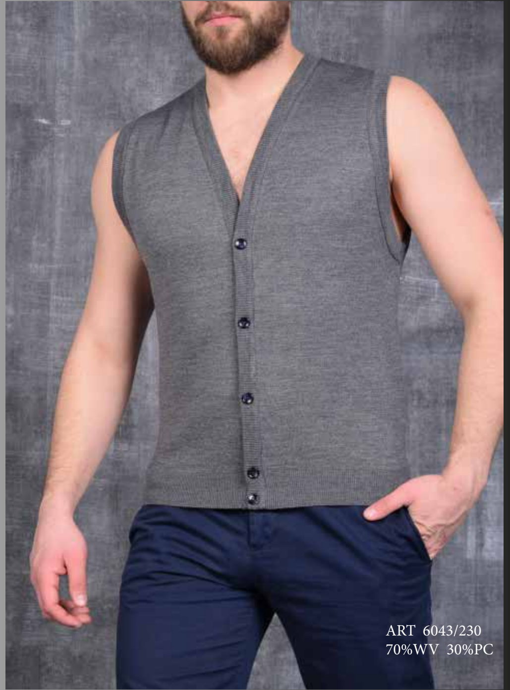
ART 6043/230 70%WV 30%PC