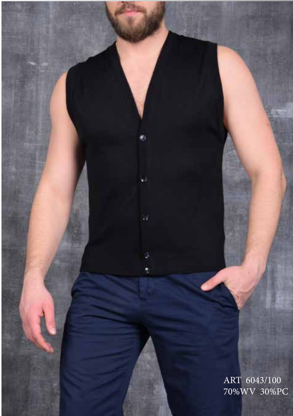
ART 6043/100 70%WV 30%PC