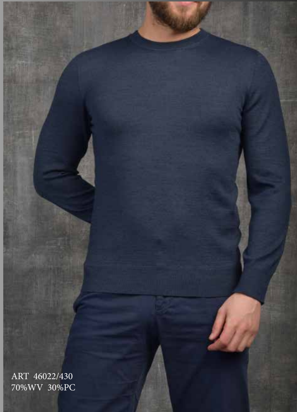
ART 46022/430 70%WV 30%PC