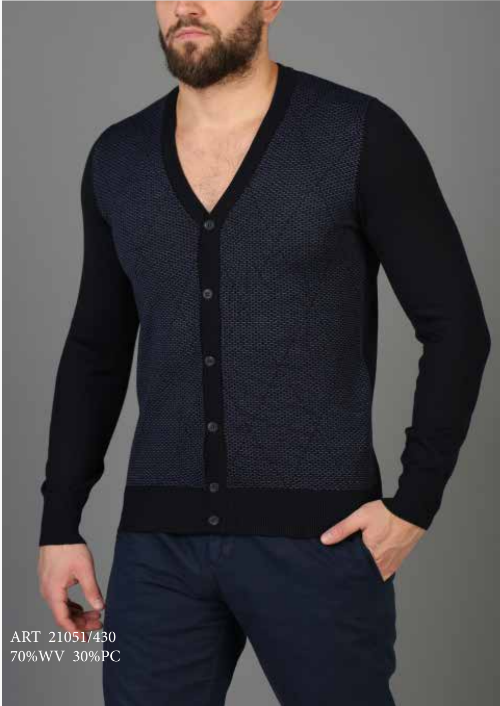
ART 21051/430 70%WV 30%PC