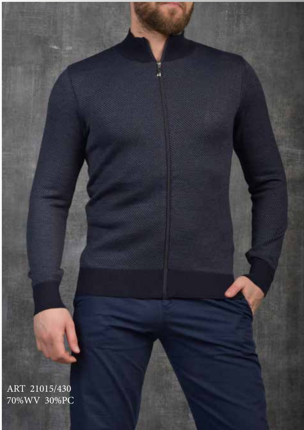
ART 21015/430 70%WV 30%PC