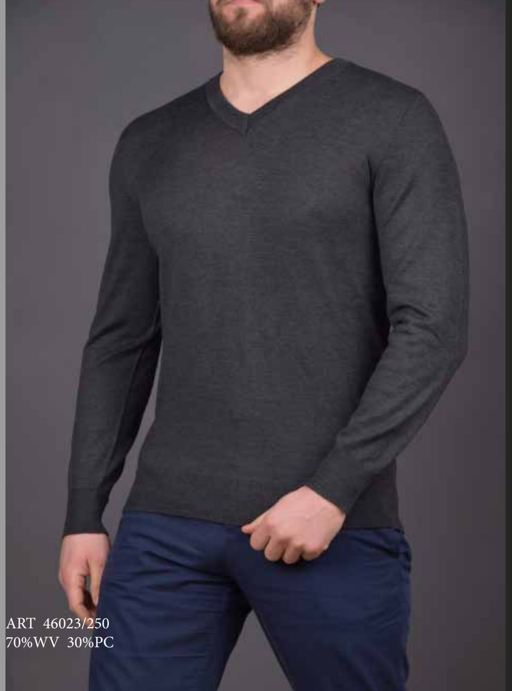
ART 46023/250 70%WV 30%PC