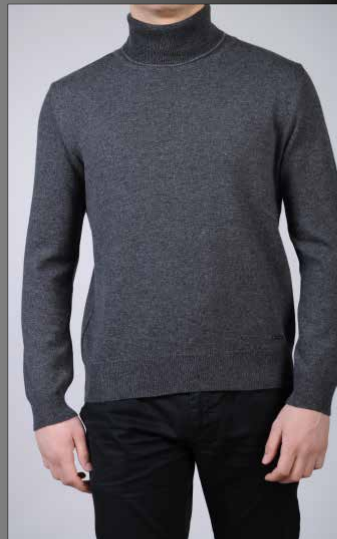
ART 2346e/253 10%WS 40%WO 30%VI 20%PA