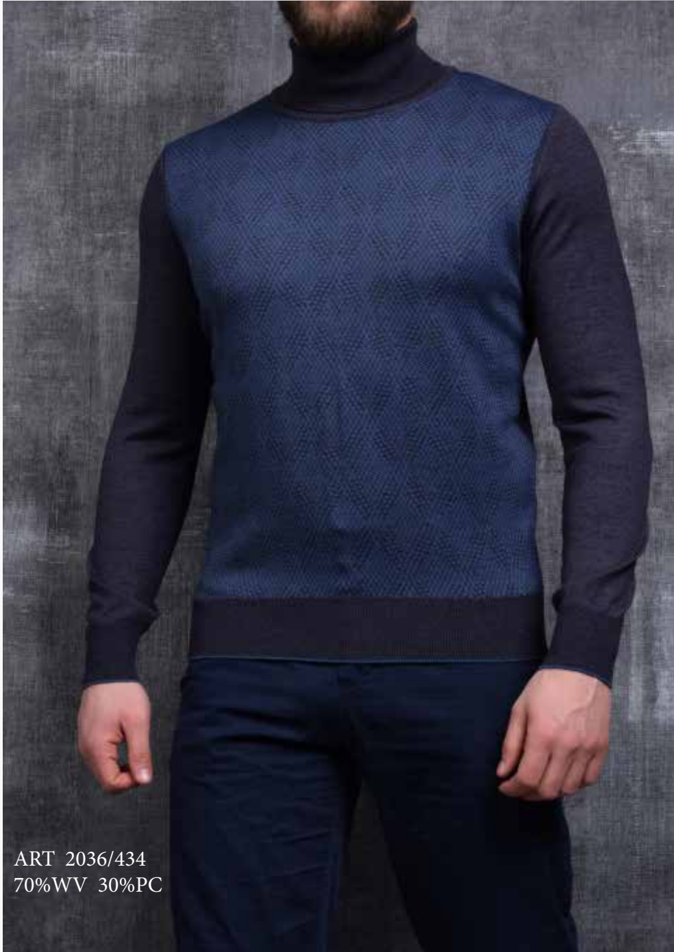
ART 2036/434 70%WV 30%PC