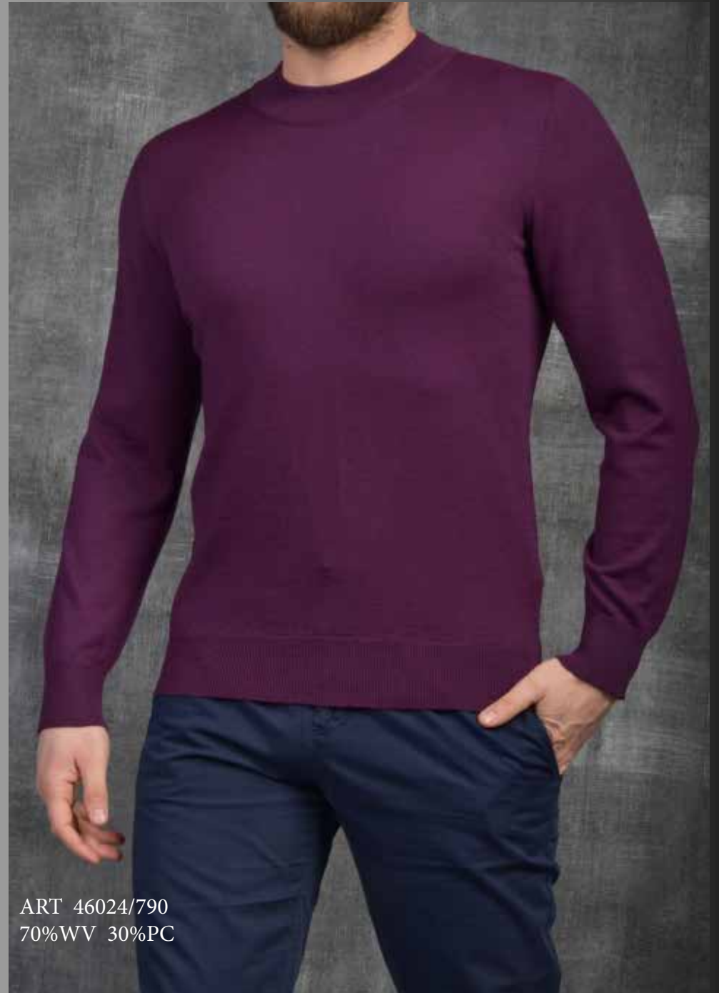
ART 46024/790 70%WV 30%PC