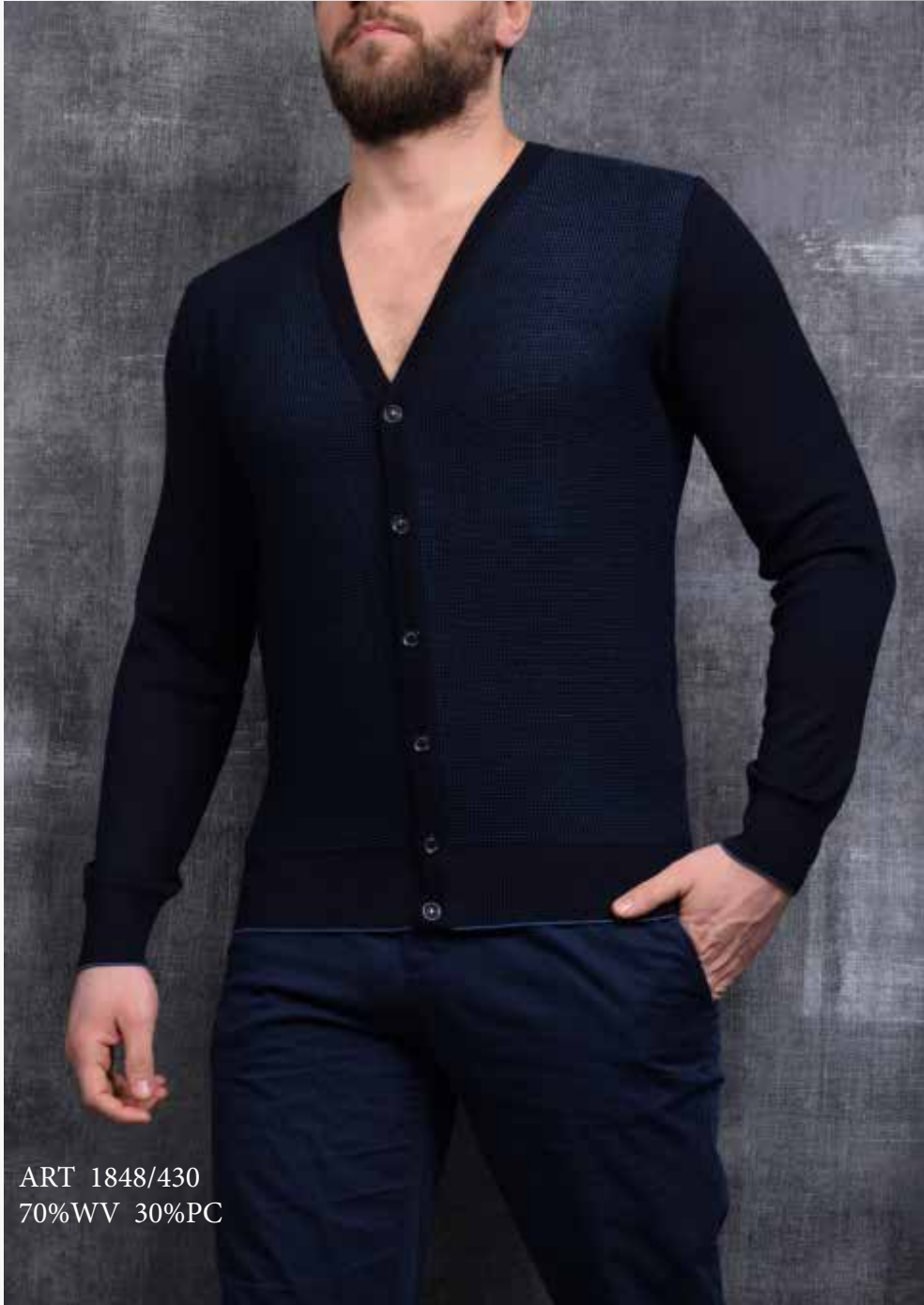
ART 1848/430 70%WV 30%PC