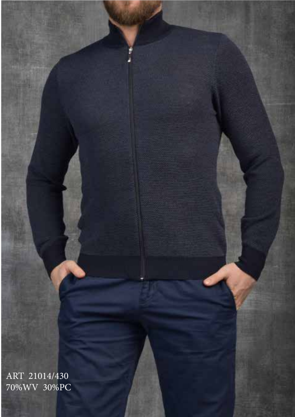
ART 21014/430 70%WV 30%PC