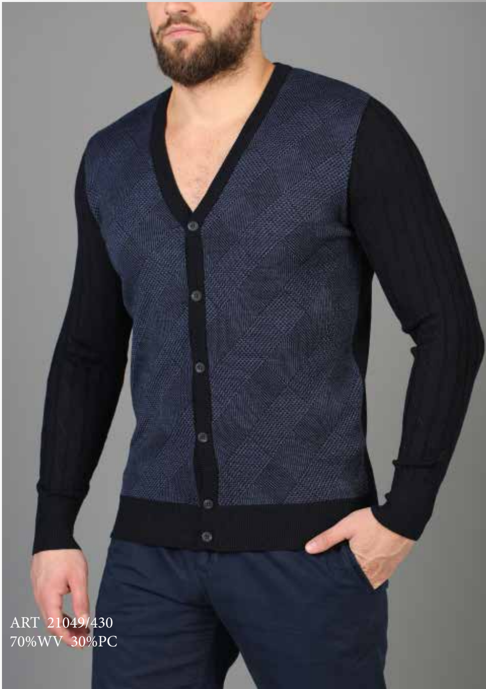
ART 21049/430 70%WV 30%PC