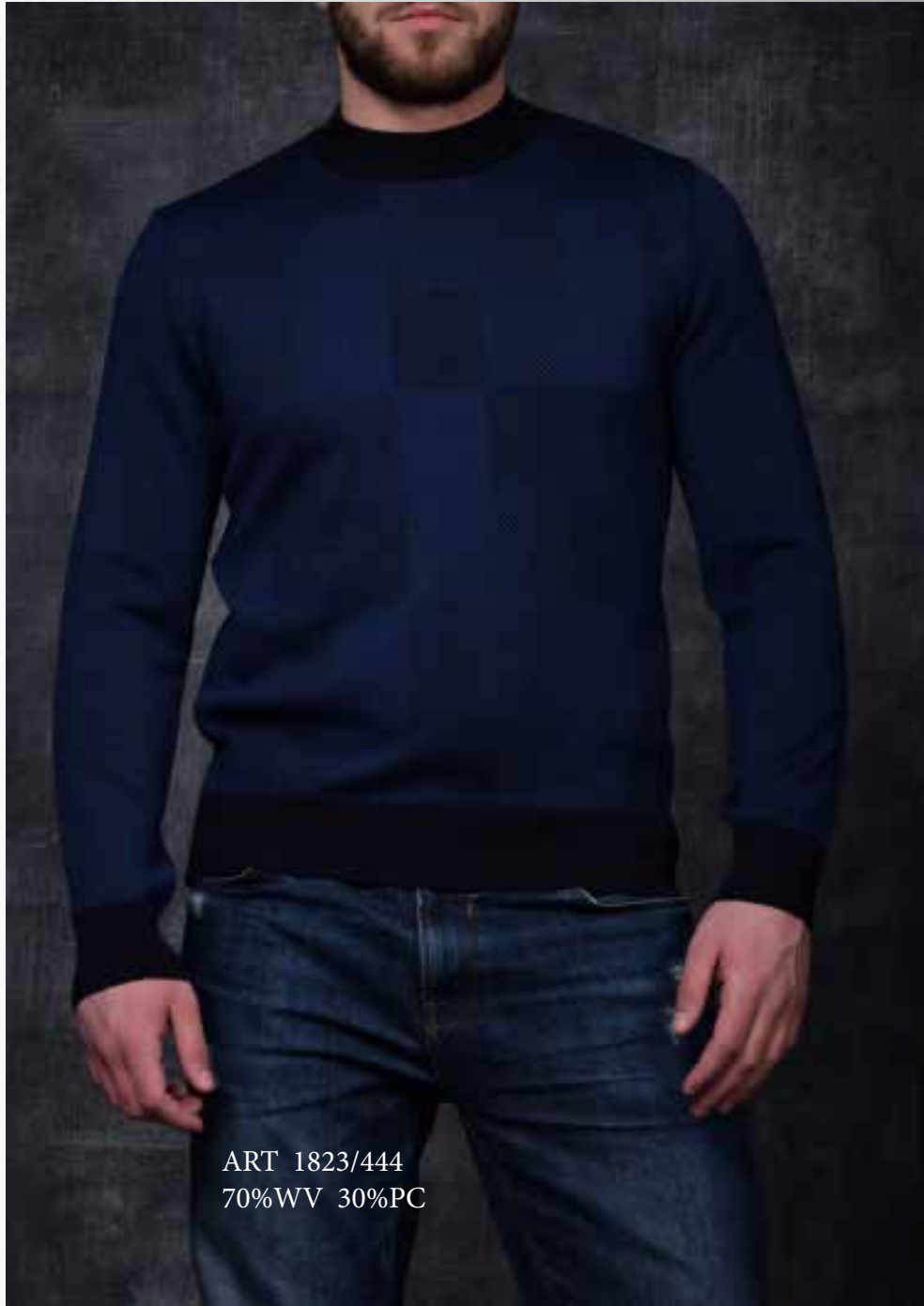
ART 1823/444 70%WV 30%PC