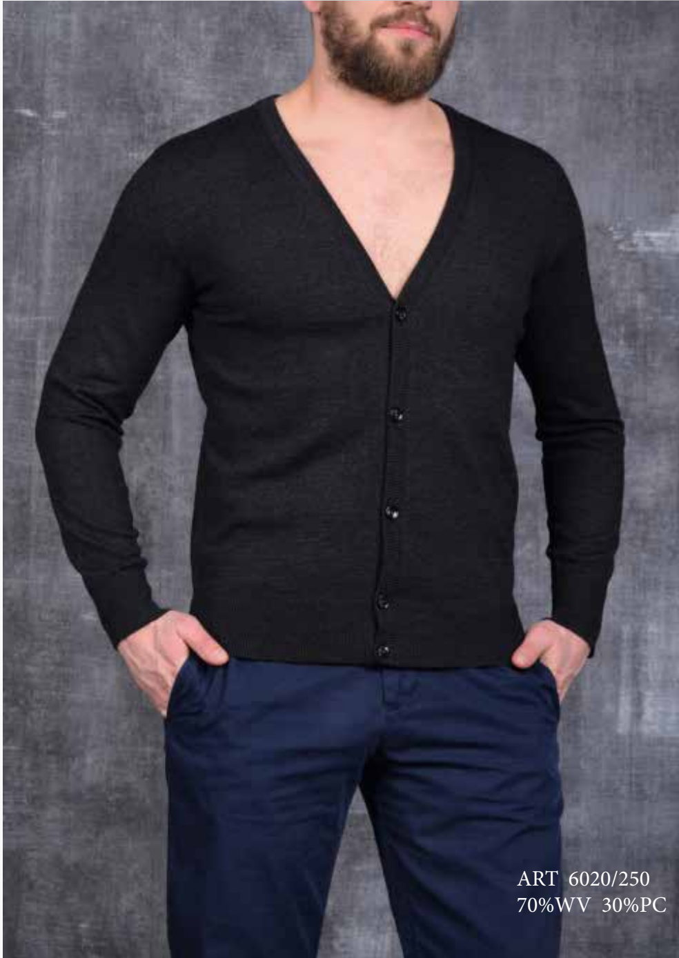
ART 6020/250 70%WV 30%PC