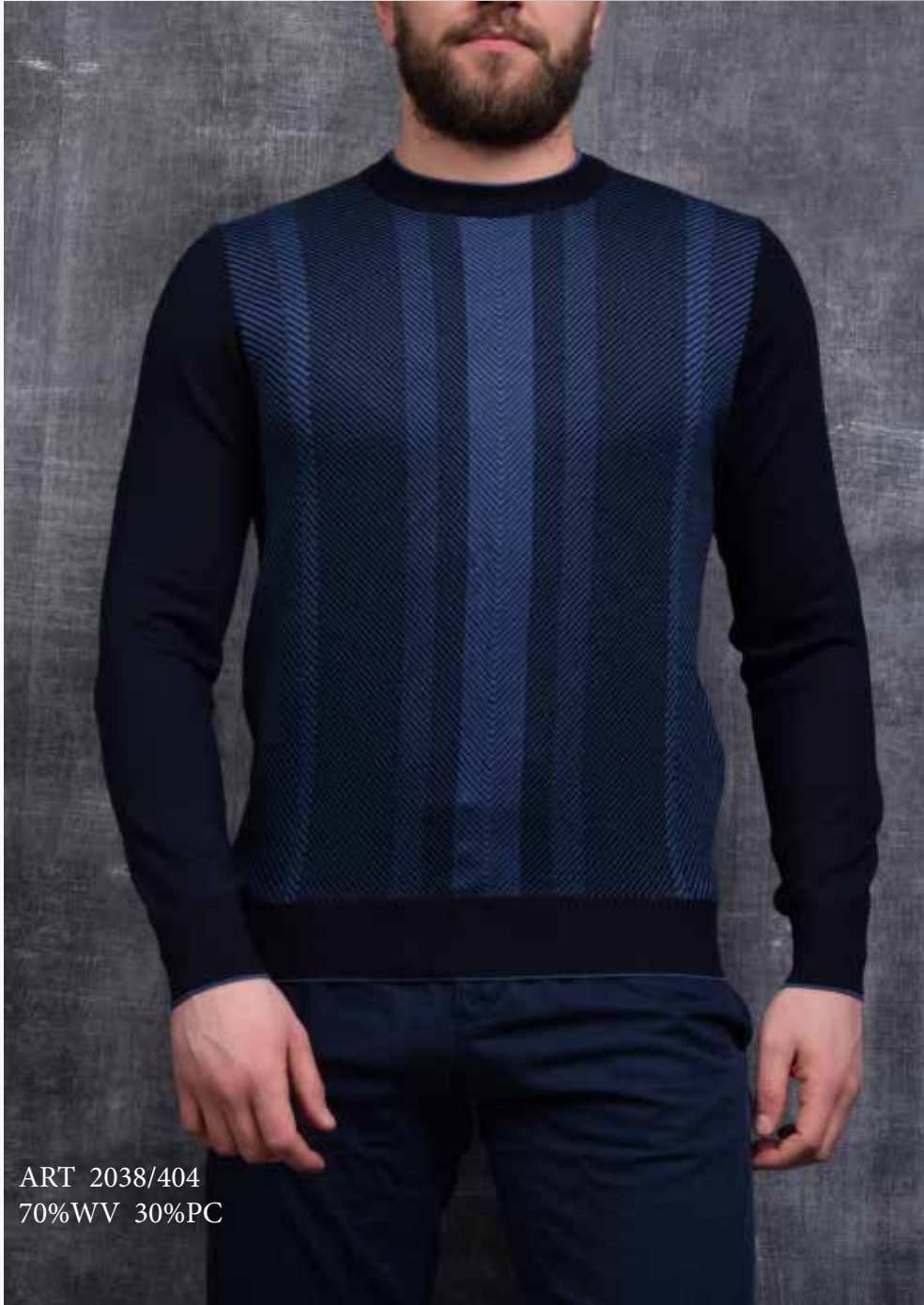
ART 2038/404 70%WV 30%PC