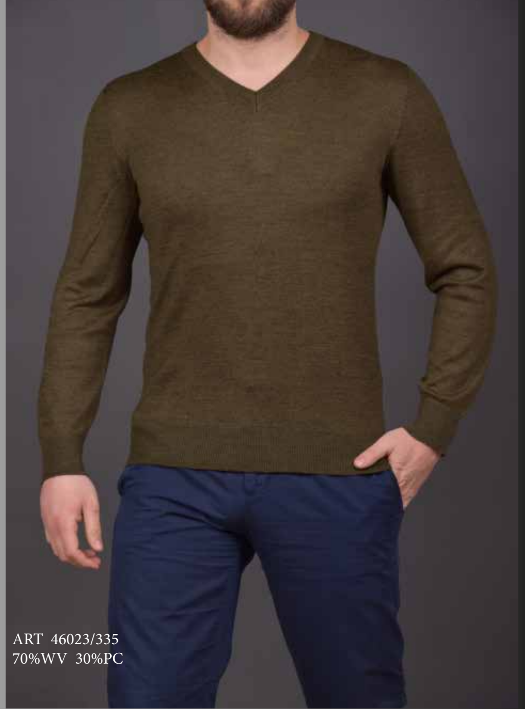
ART 46023/335 70%WV 30%PC