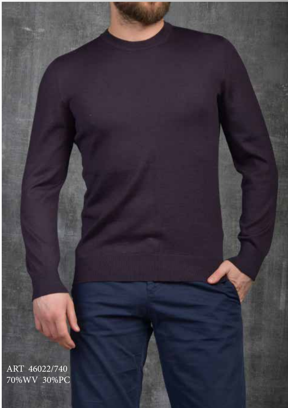
ART 46022/740 70%WV 30%PC