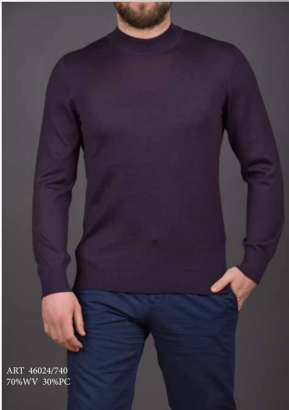
ART 46024/740 70%WV 30%PC