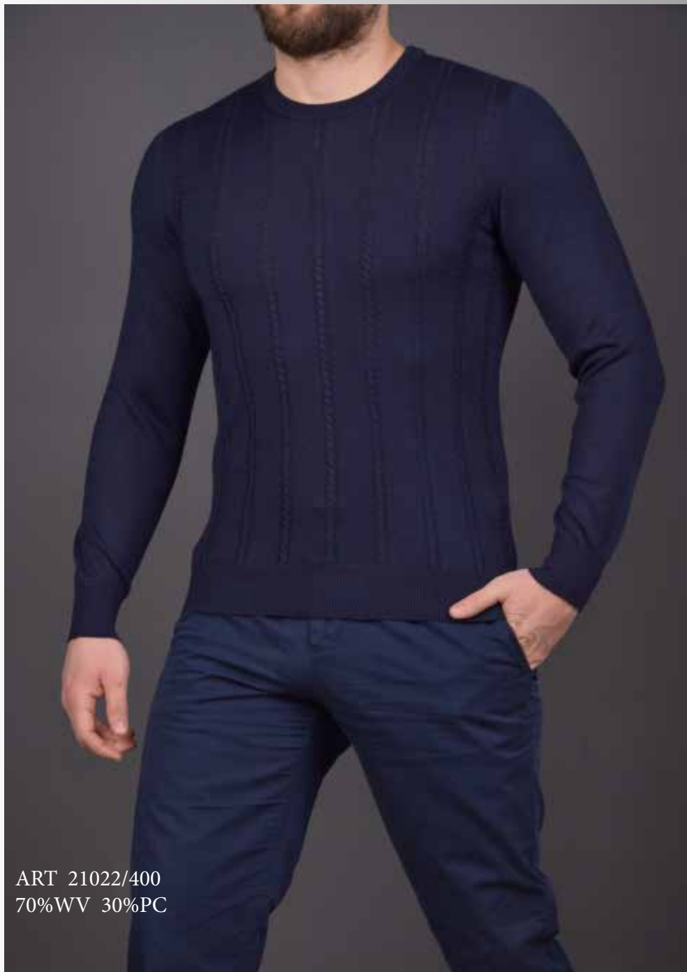
ART 21022/400 70%WV 30%PC