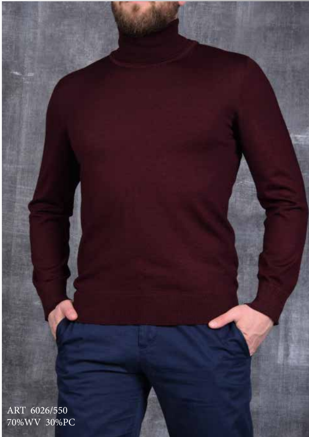
ART 6026/550 70%WV 30%PC