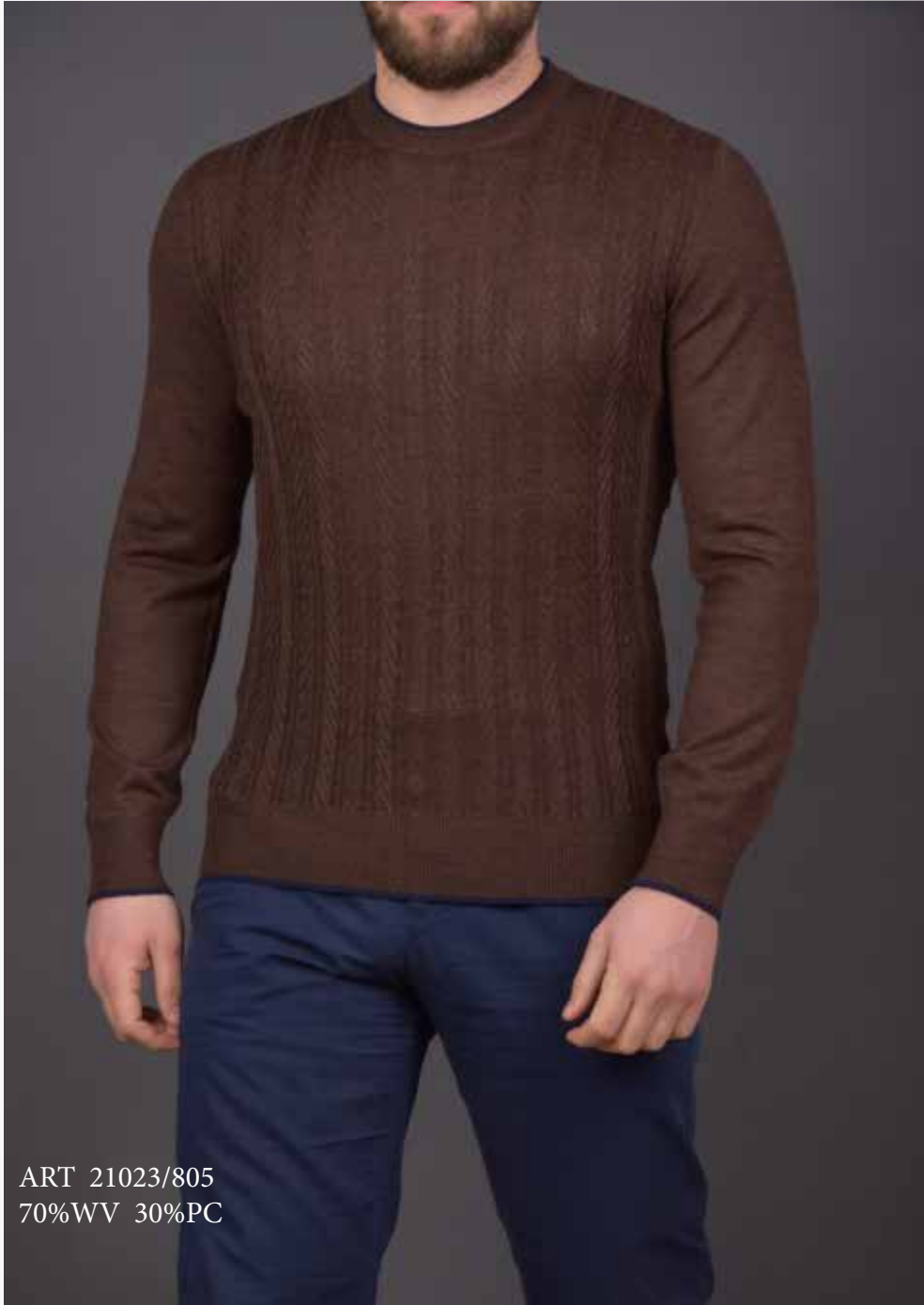
ART 21023/805 70%WV 30%PC