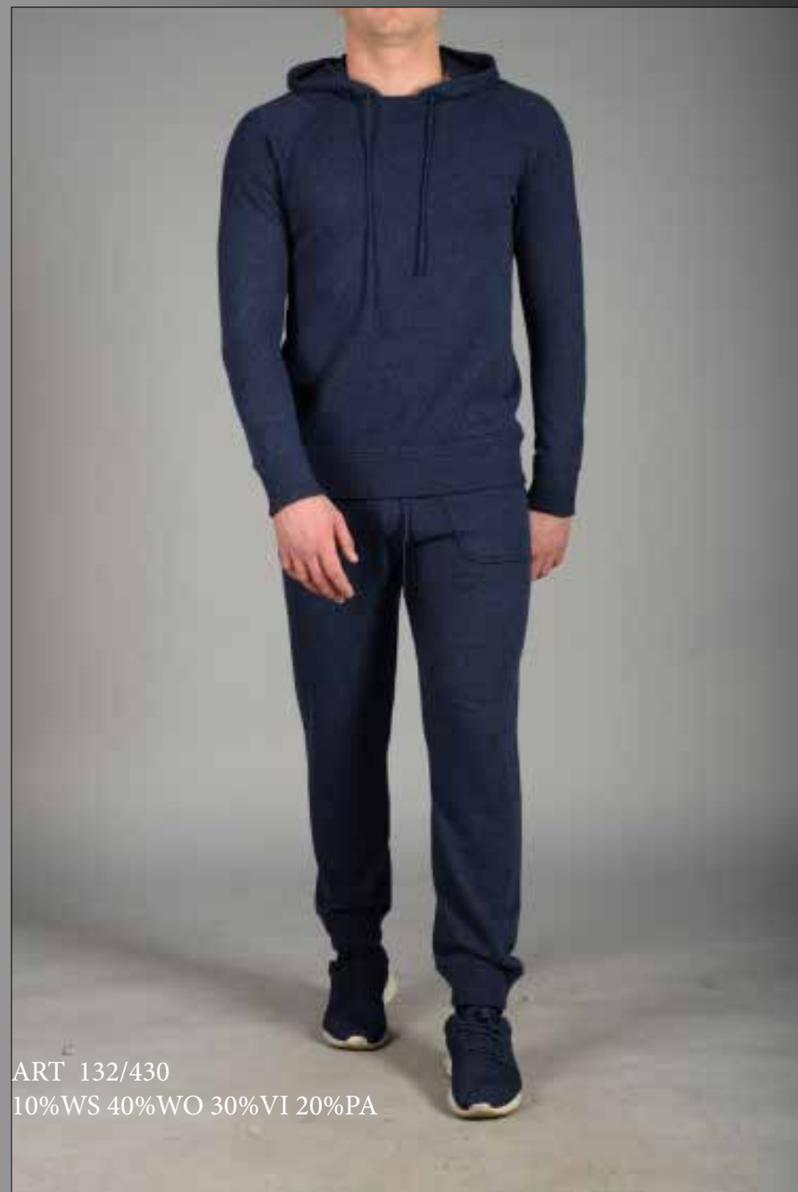
ART 132/430 10%WS 40%WO 30%VI 20%PA