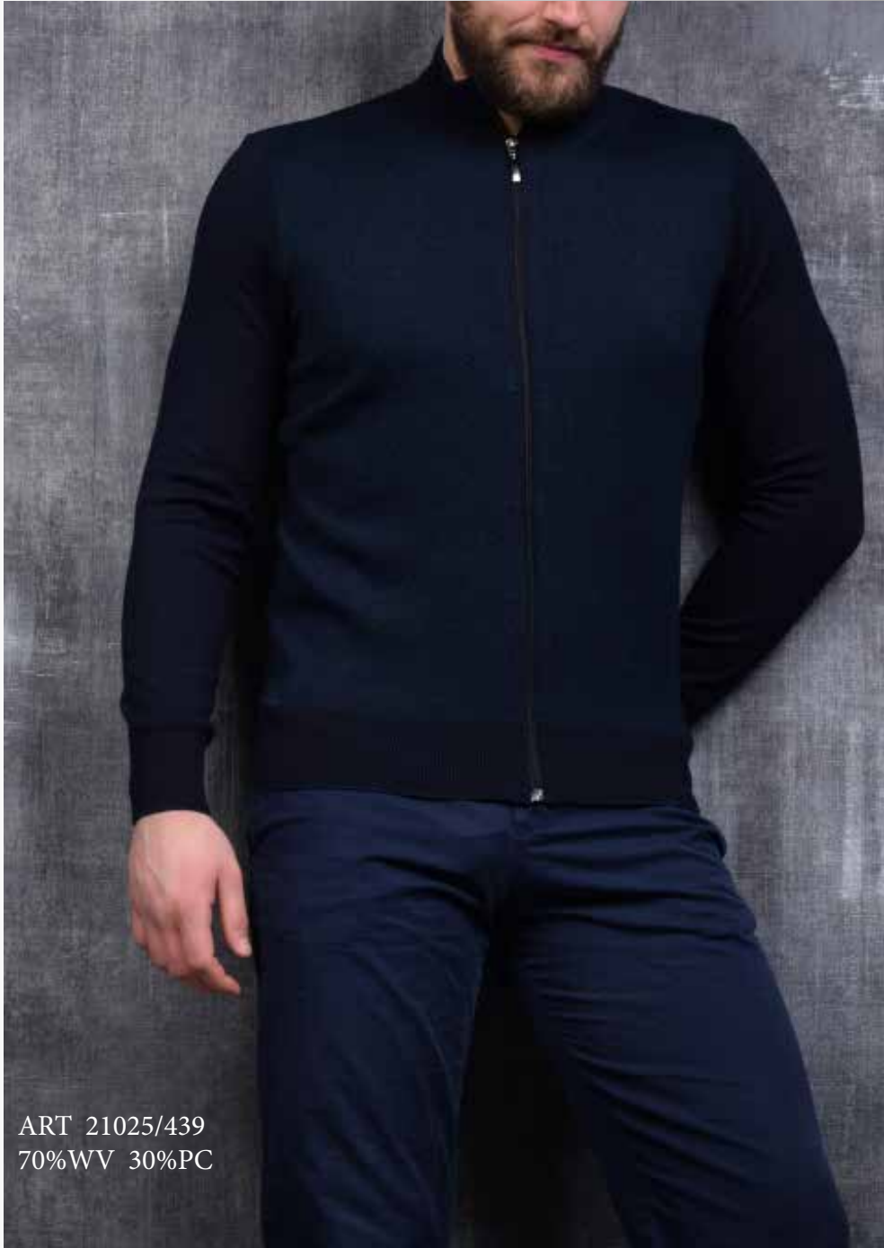
ART 21025/439 70%WV 30%PC