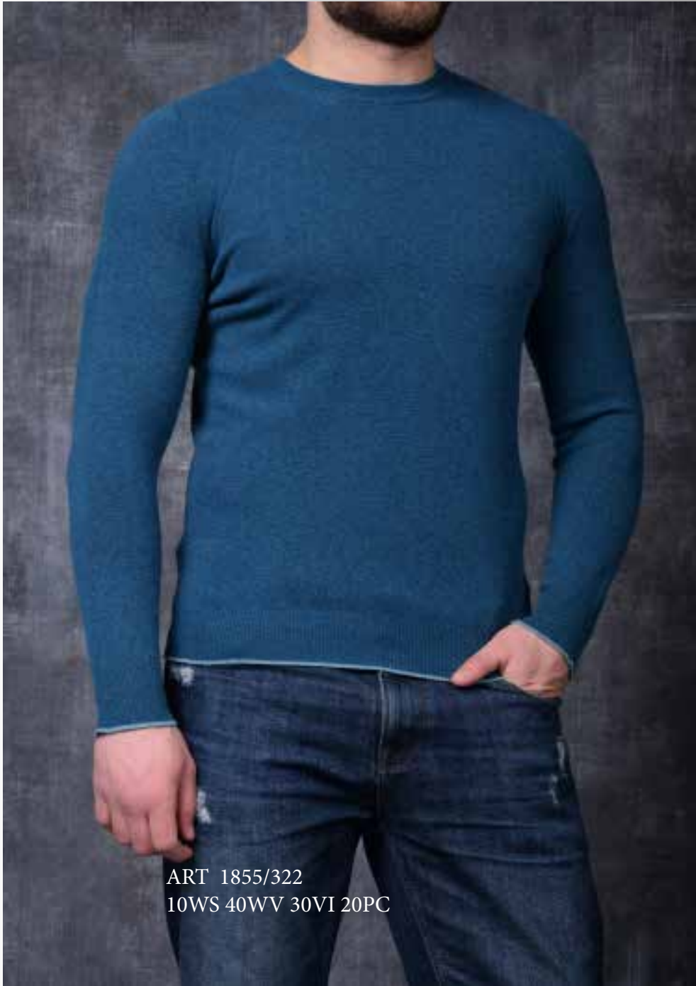
ART 1855/322 10WS 40WV 30VI 20PC