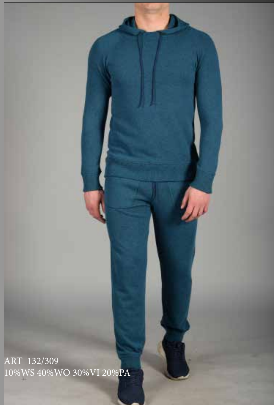
ART 132/309 10%WS 40%WO 30%VI 20%PA