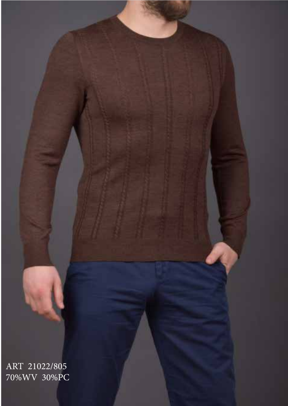
ART 21022/805 70%WV 30%PC