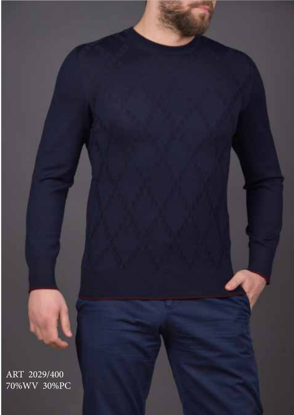
ART 2029/400 70%WV 30%PC