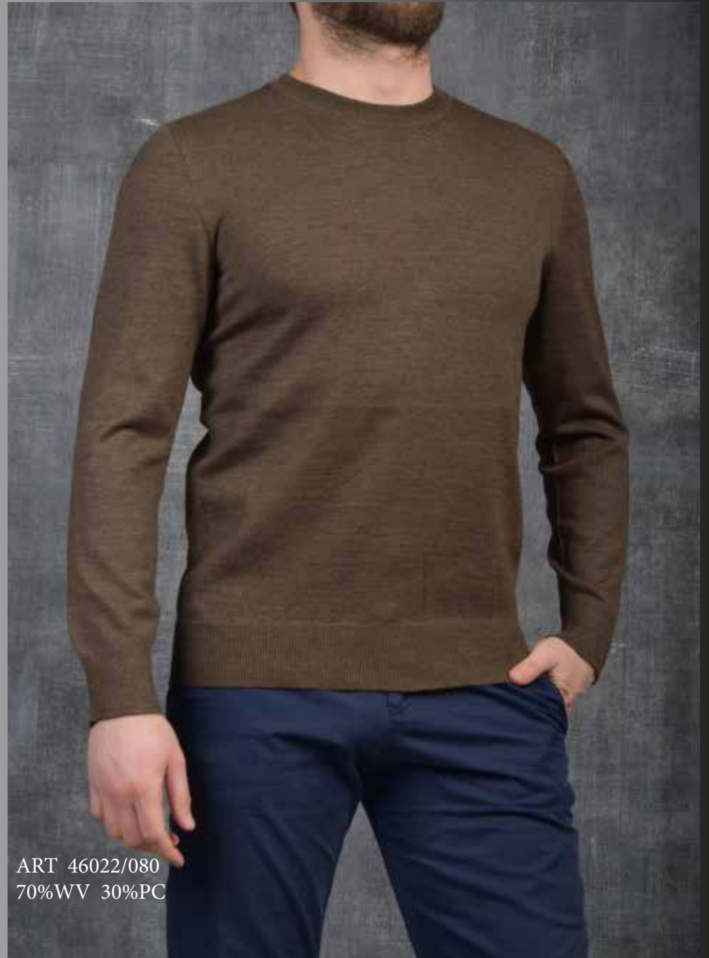
ART 46022/080 70%WV 30%PC