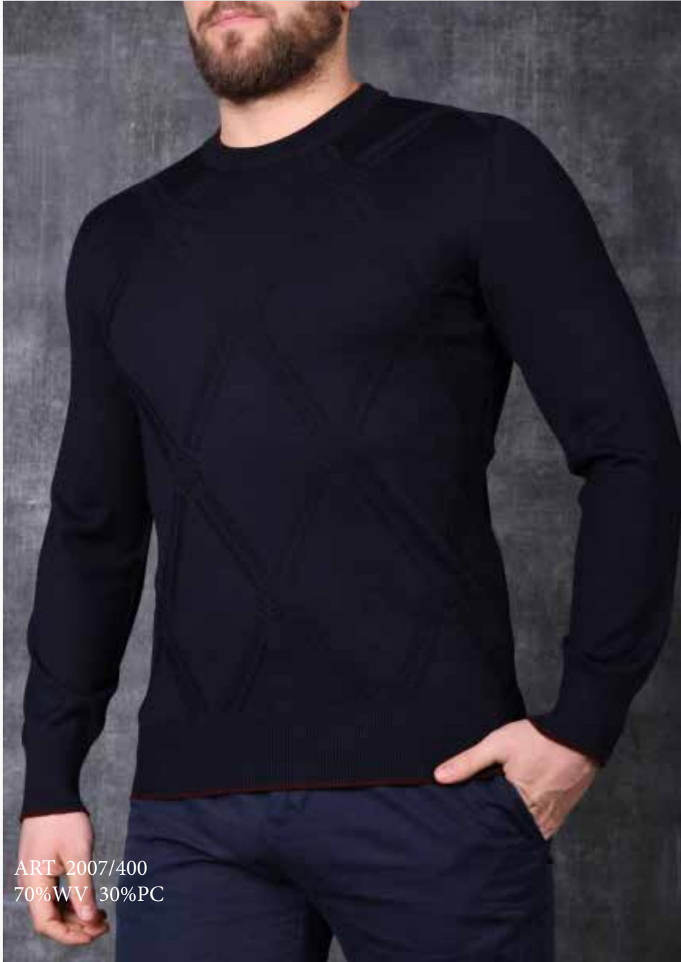
ART 2007/400 70%WV 30%PC