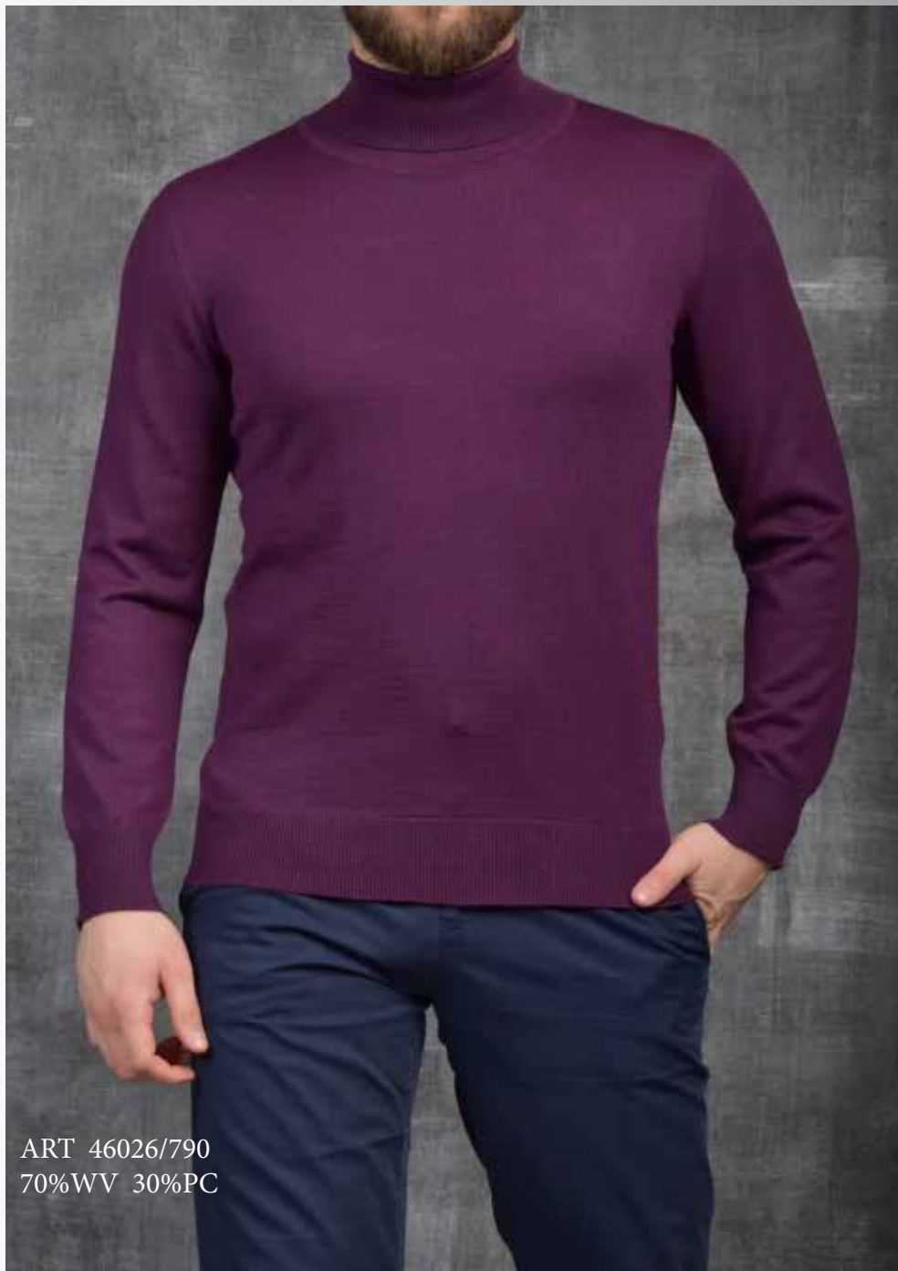
ART 46026/790 70%WV 30%PC