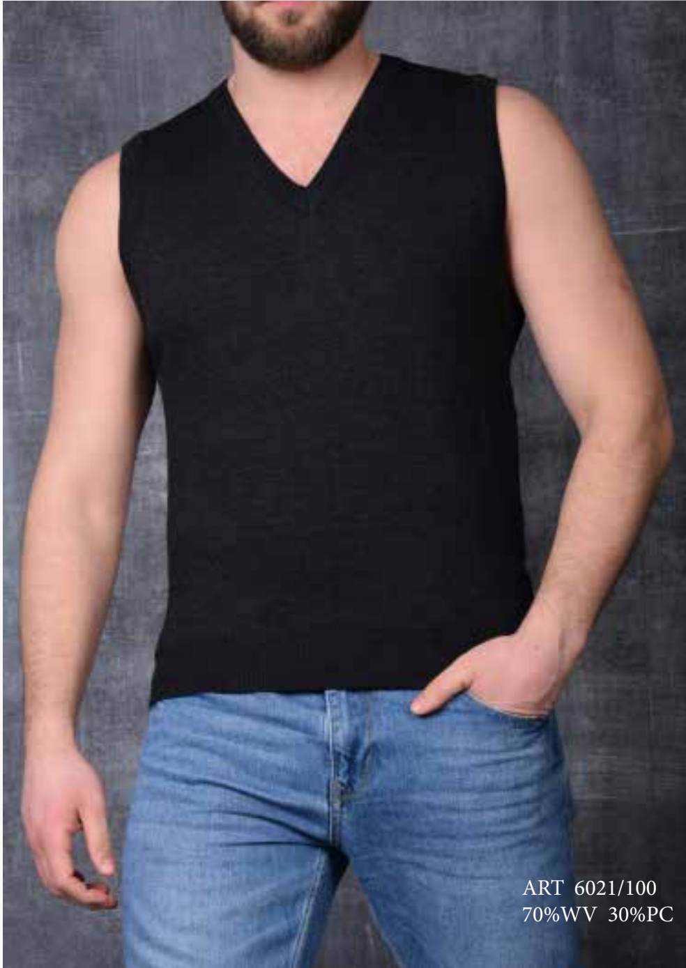
ART 6021/100 70%WV 30%PC