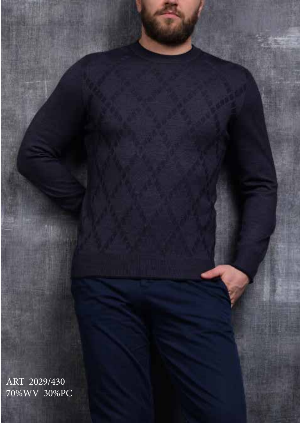
ART 2029/430 70%WV 30%PC