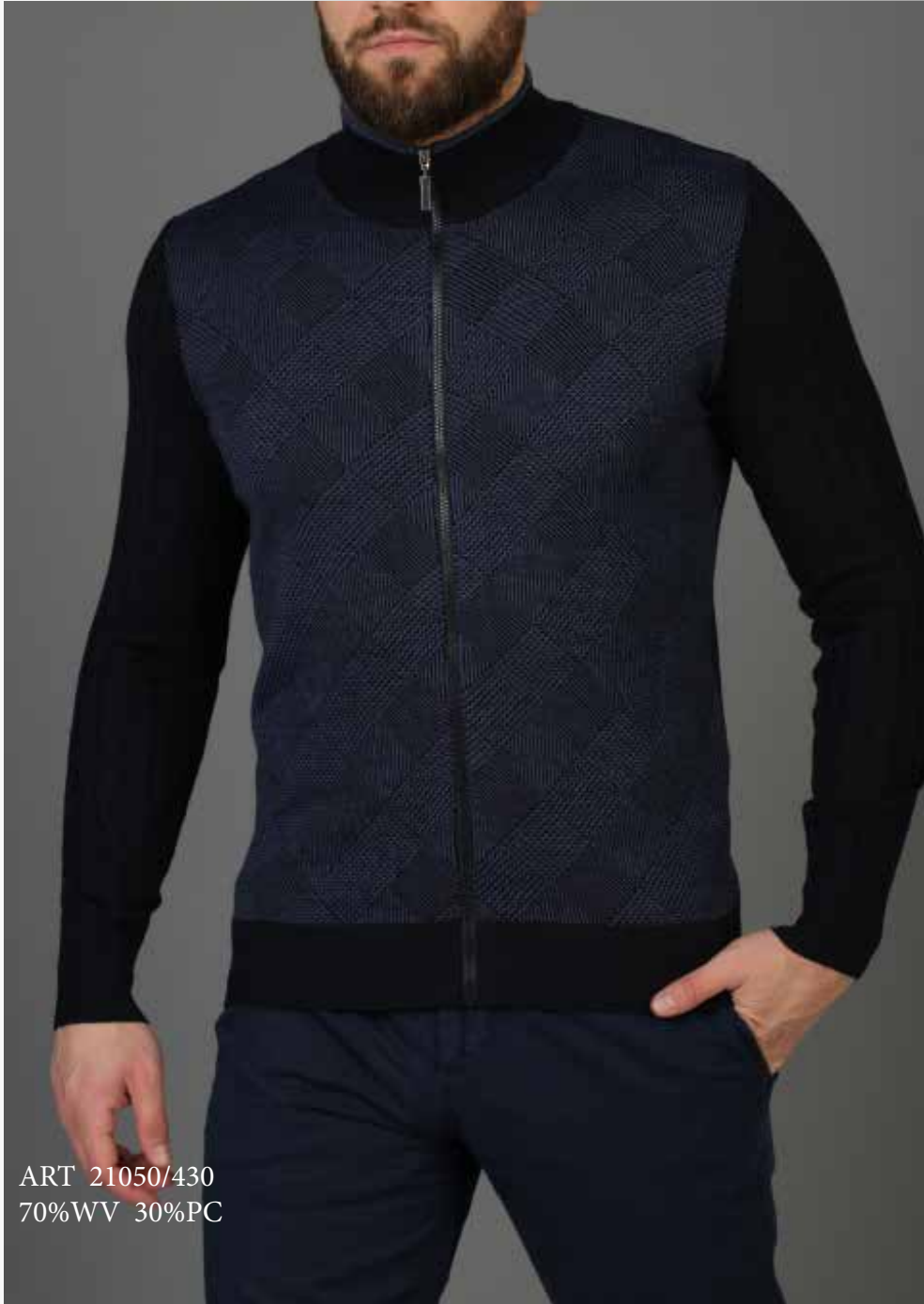
ART 21050/430 70%WV 30%PC