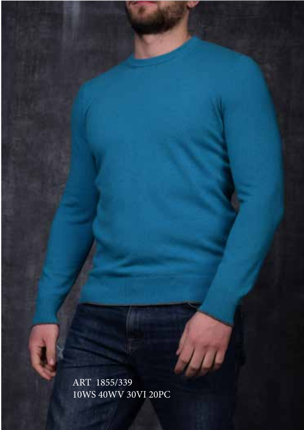
ART 1855/339 10WS 40WV 30VI 20PC