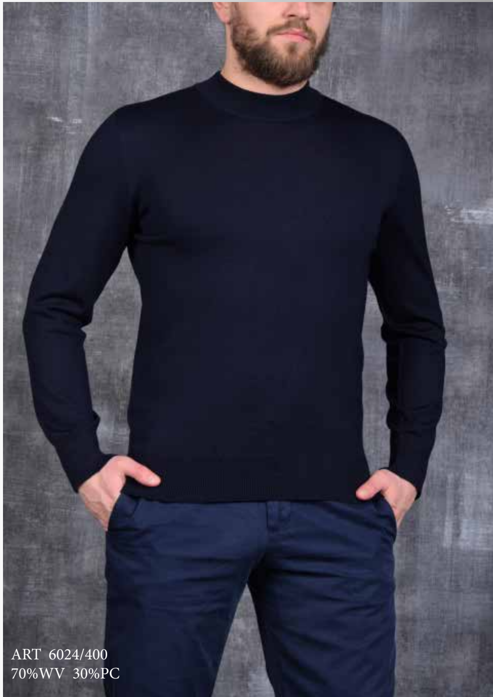
ART 6024/400 70%WV 30%PC