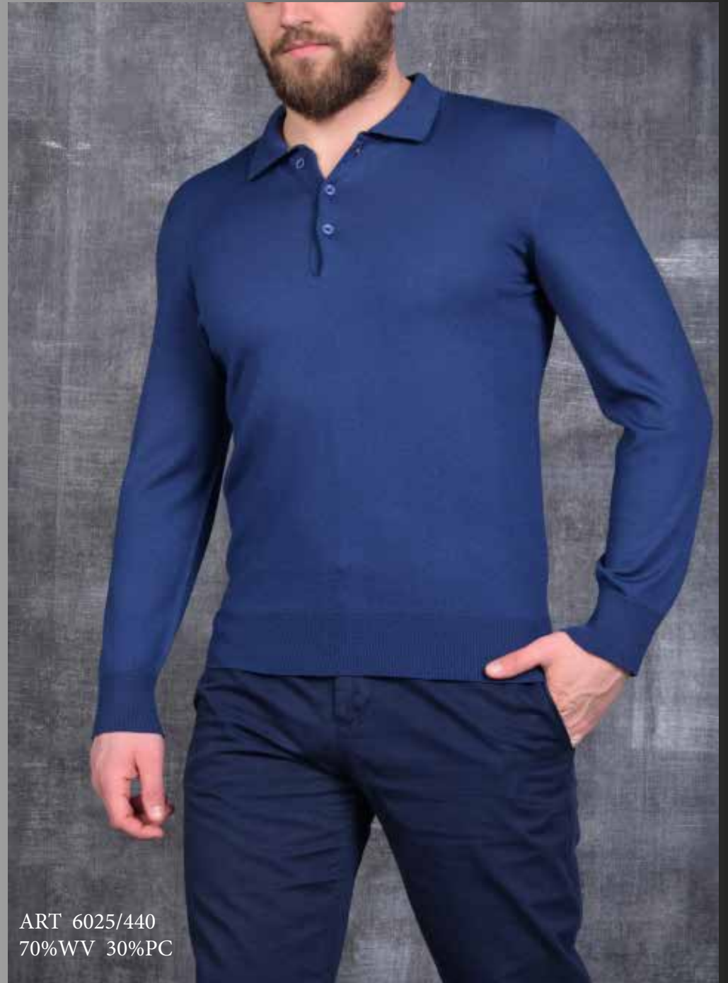
ART 6025/440 70%WV 30%PC