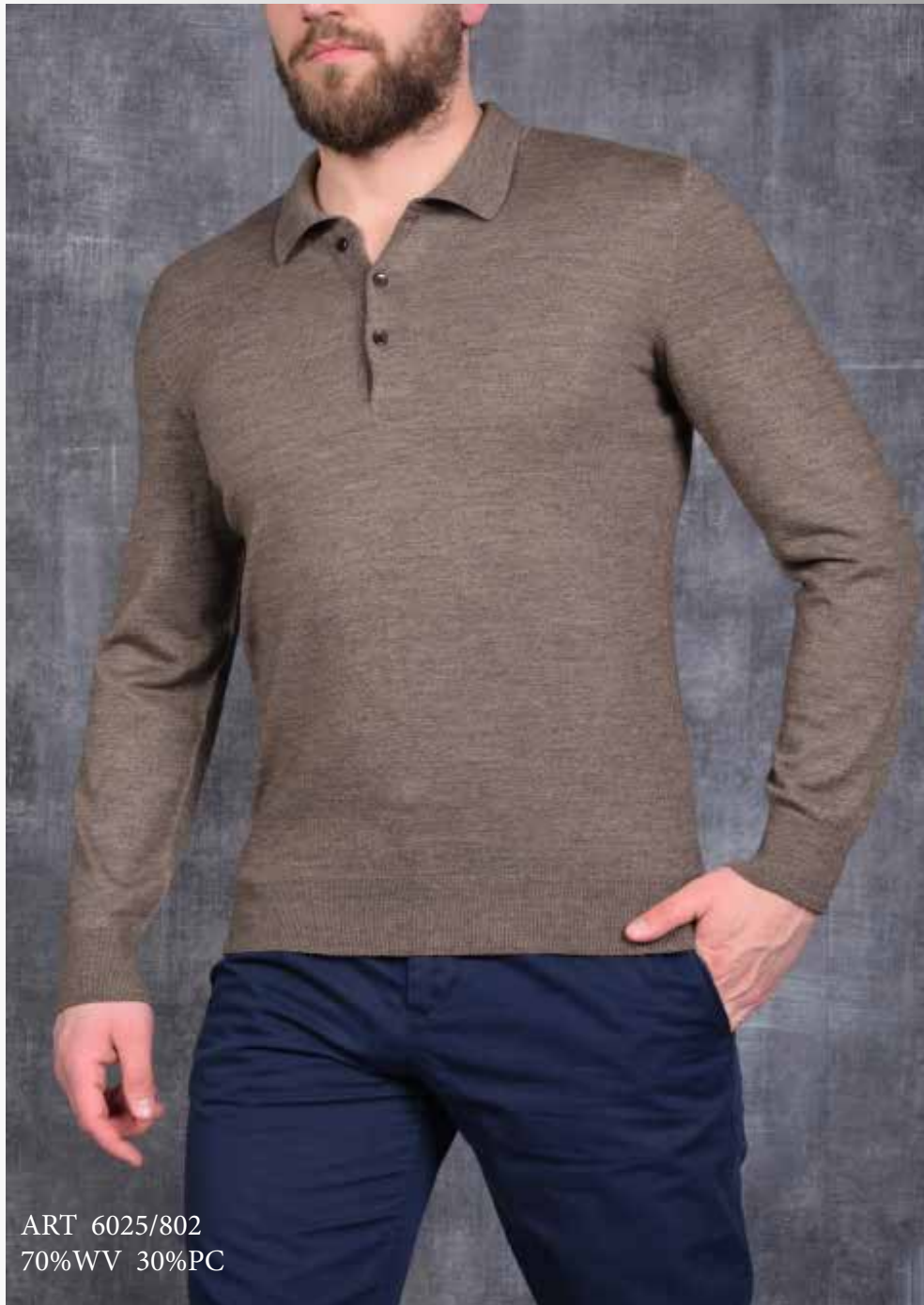
ART 6025/802 70%WV 30%PC