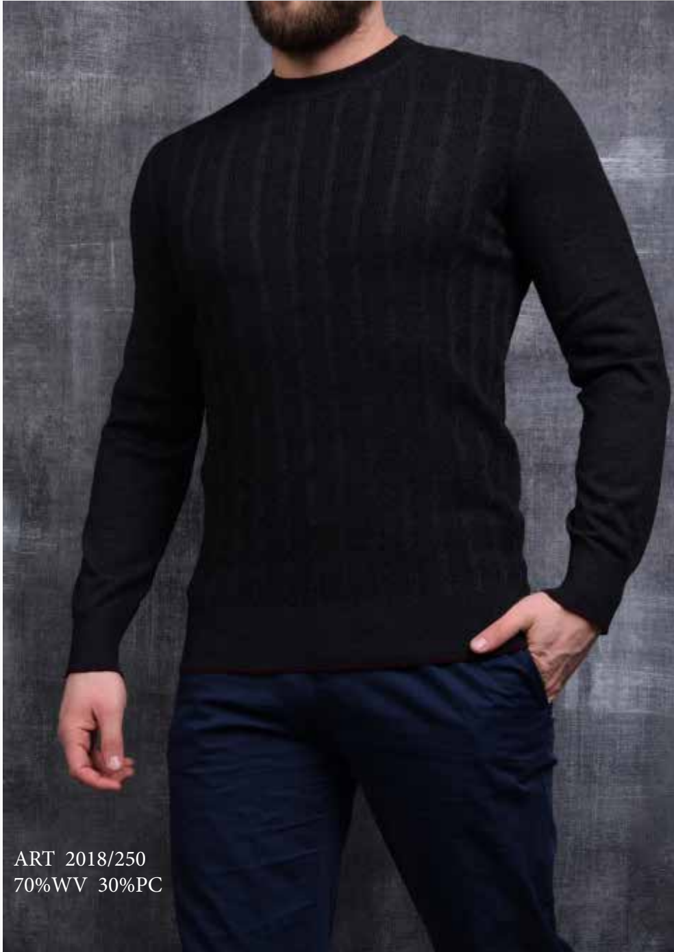
ART 2018/250 70%WV 30%PC