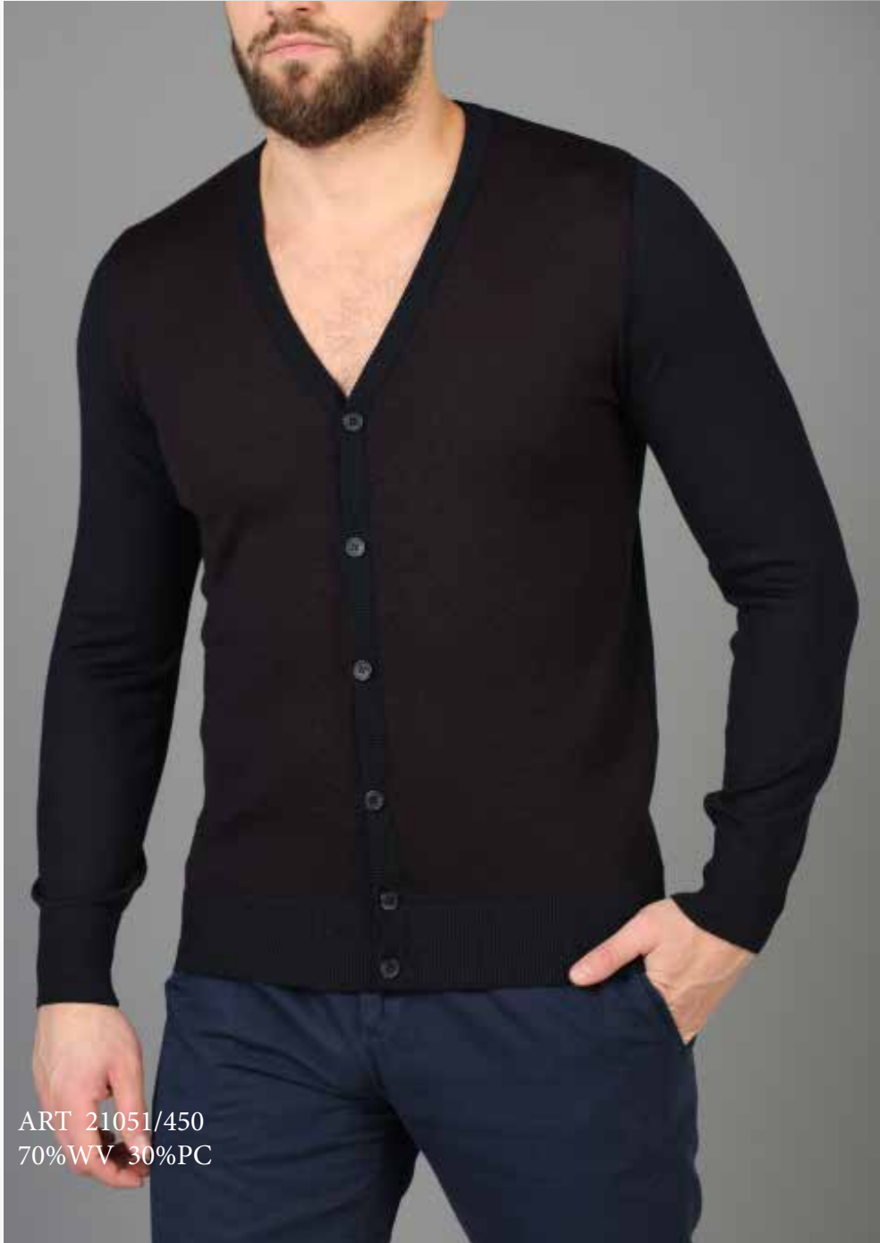
ART 21051/450 70%WV 30%PC