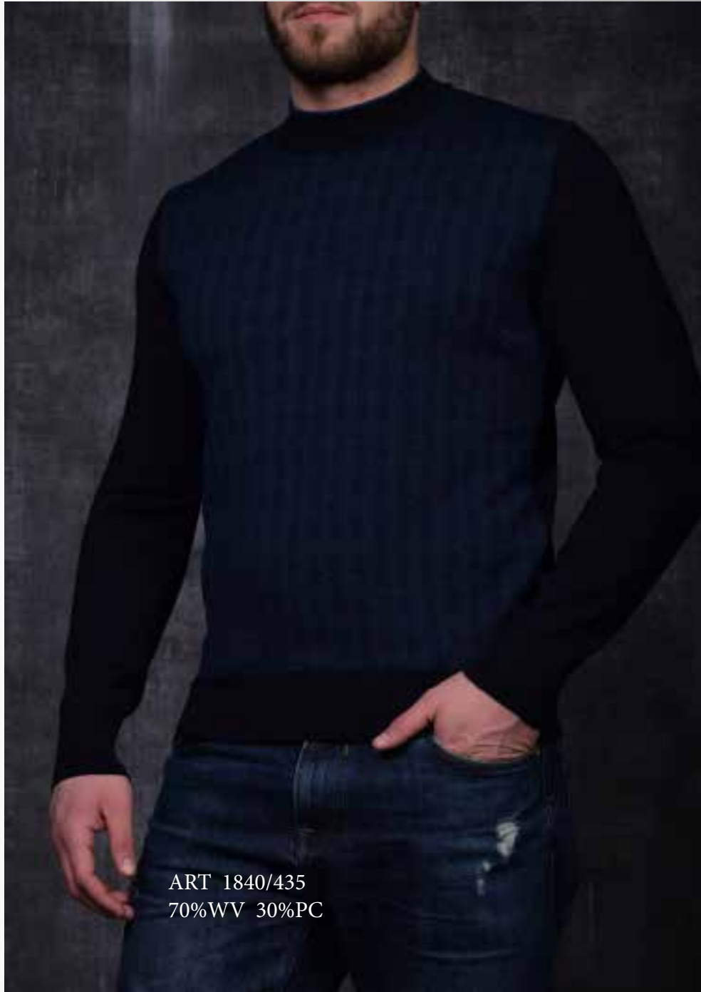
ART 1840/435 70%WV 30%PC