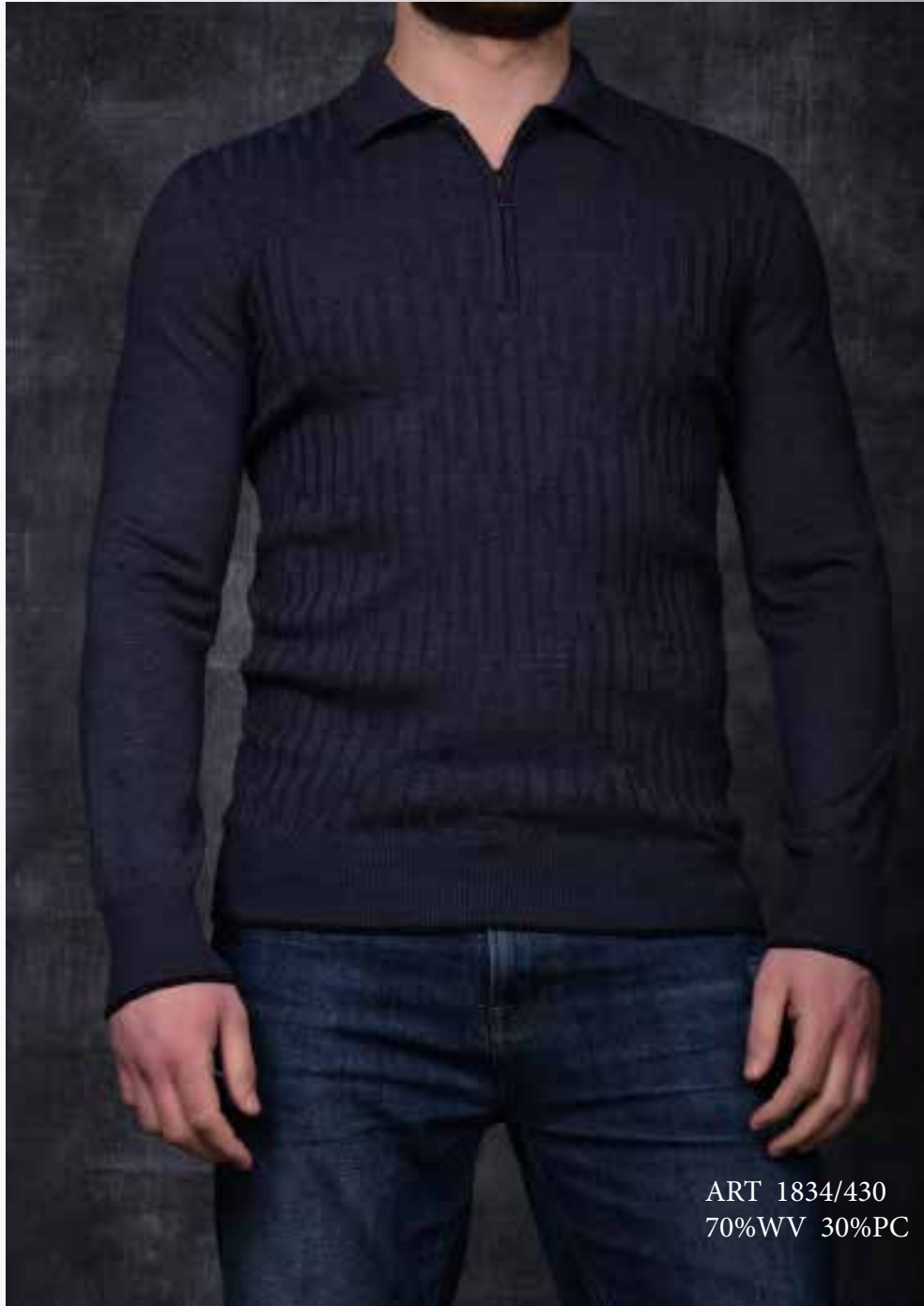
ART 1834/430 70%WV 30%PC