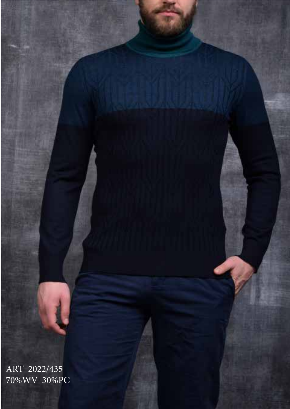
ART 2022/435 70%WV 30%PC