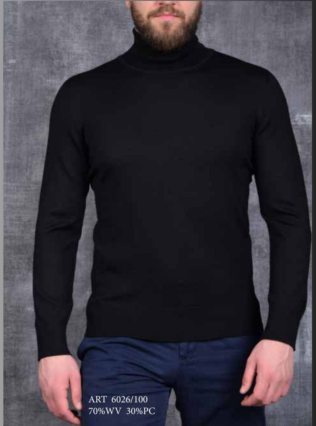
ART 6026/100 70%WV 30%PC