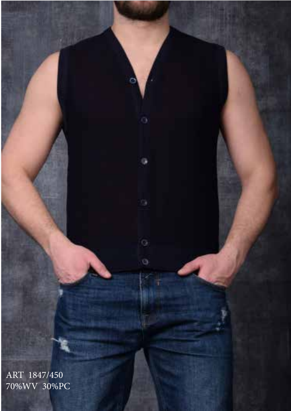
ART 1847/450 70%WV 30%PC