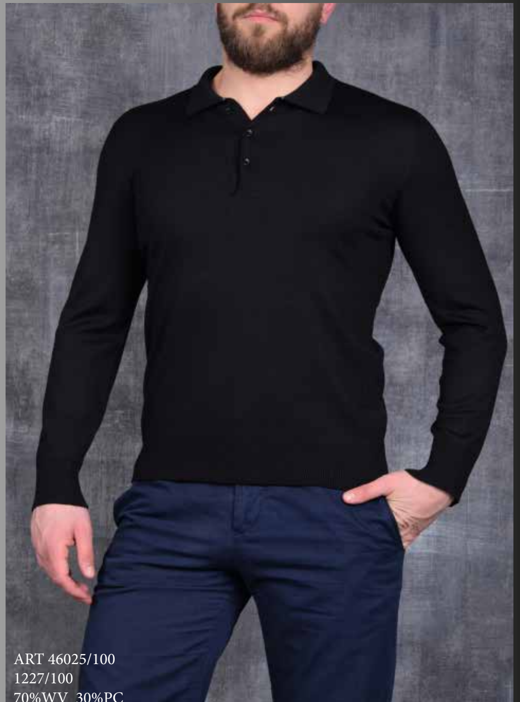
ART 46025/100 1227/100 70%WV 30%PC