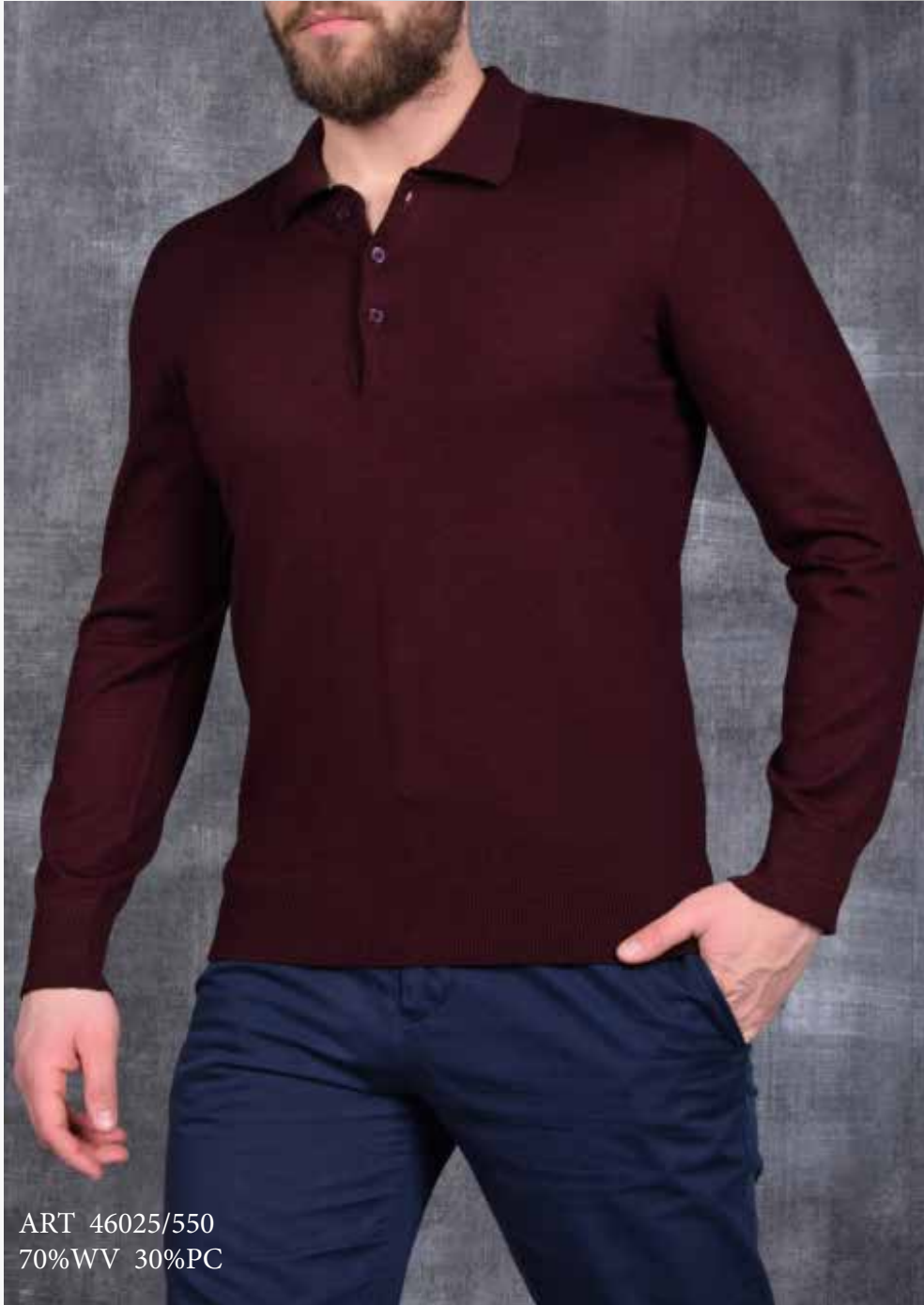
ART 46025/550 70%WV 30%PC