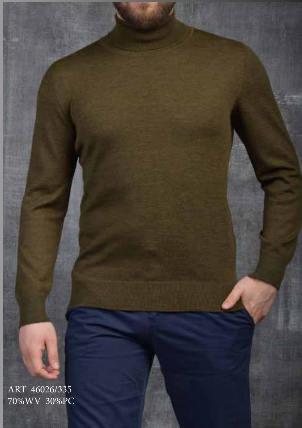
ART 46026/335 70%WV 30%PC