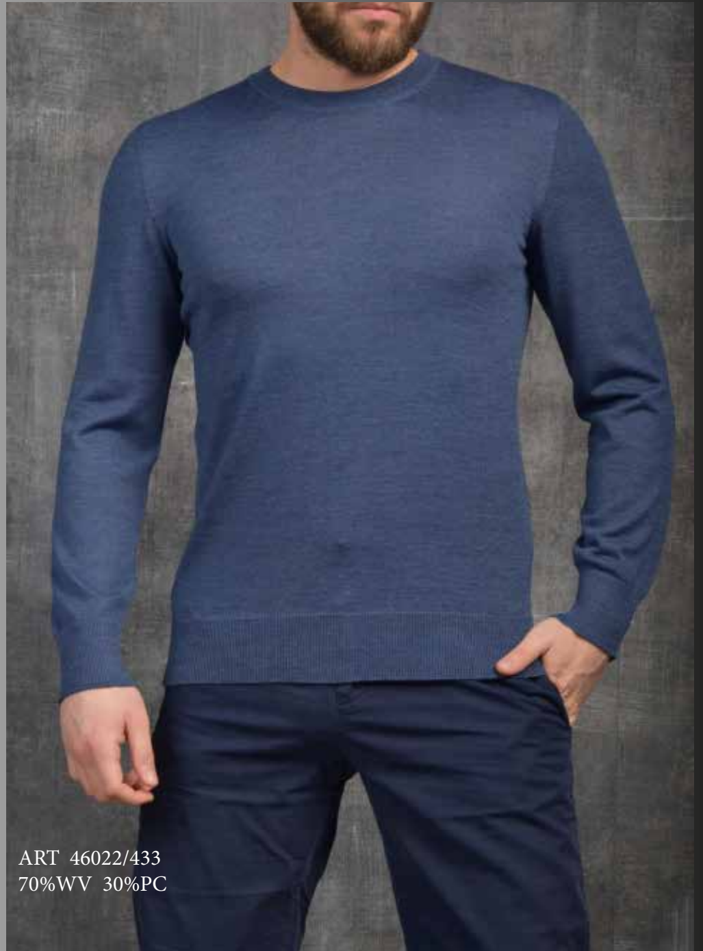
ART 46022/433 70%WV 30%PC