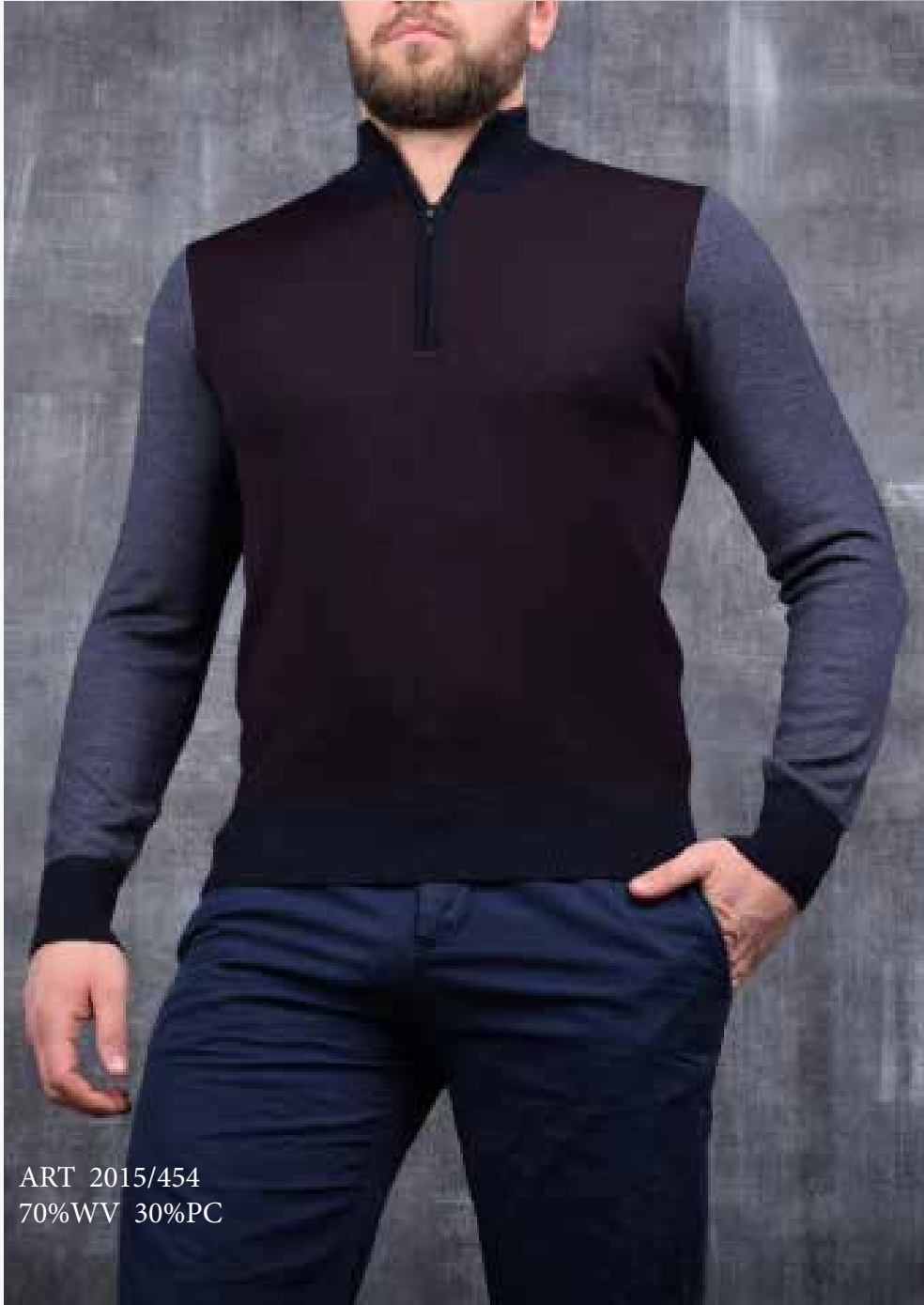
ART 2015/454 70%WV 30%PC