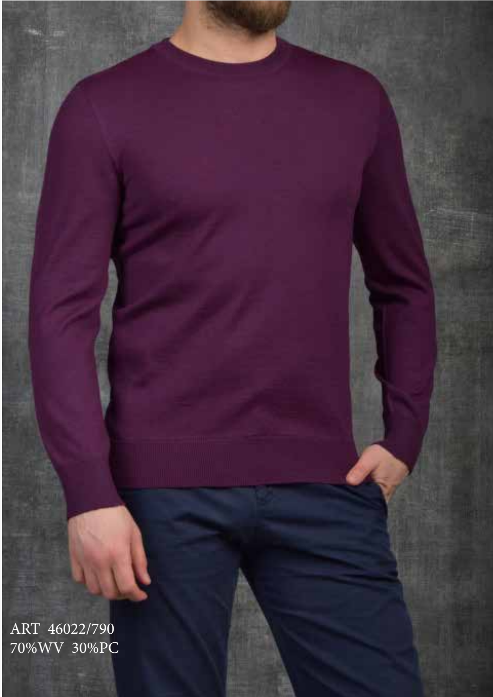
ART 46022/790 70%WV 30%PC