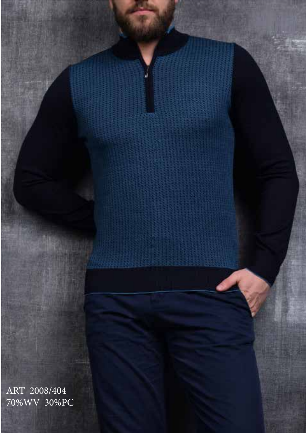
ART 2008/404 70%WV 30%PC