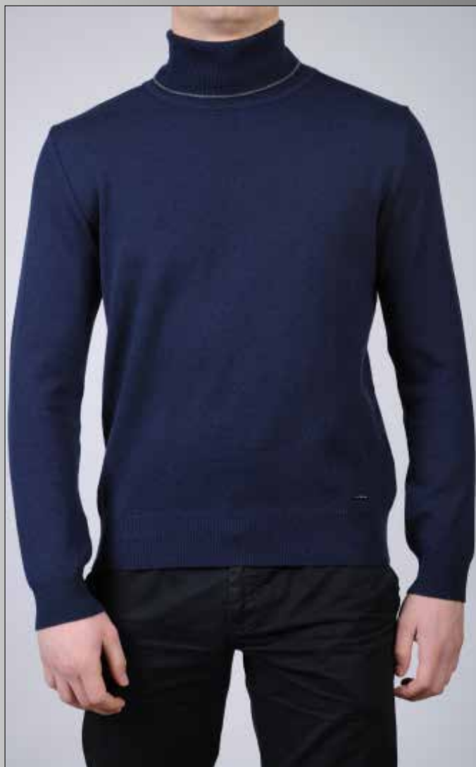
ART 2346e/420 10%WS 40%WO 30%VI 20%PA