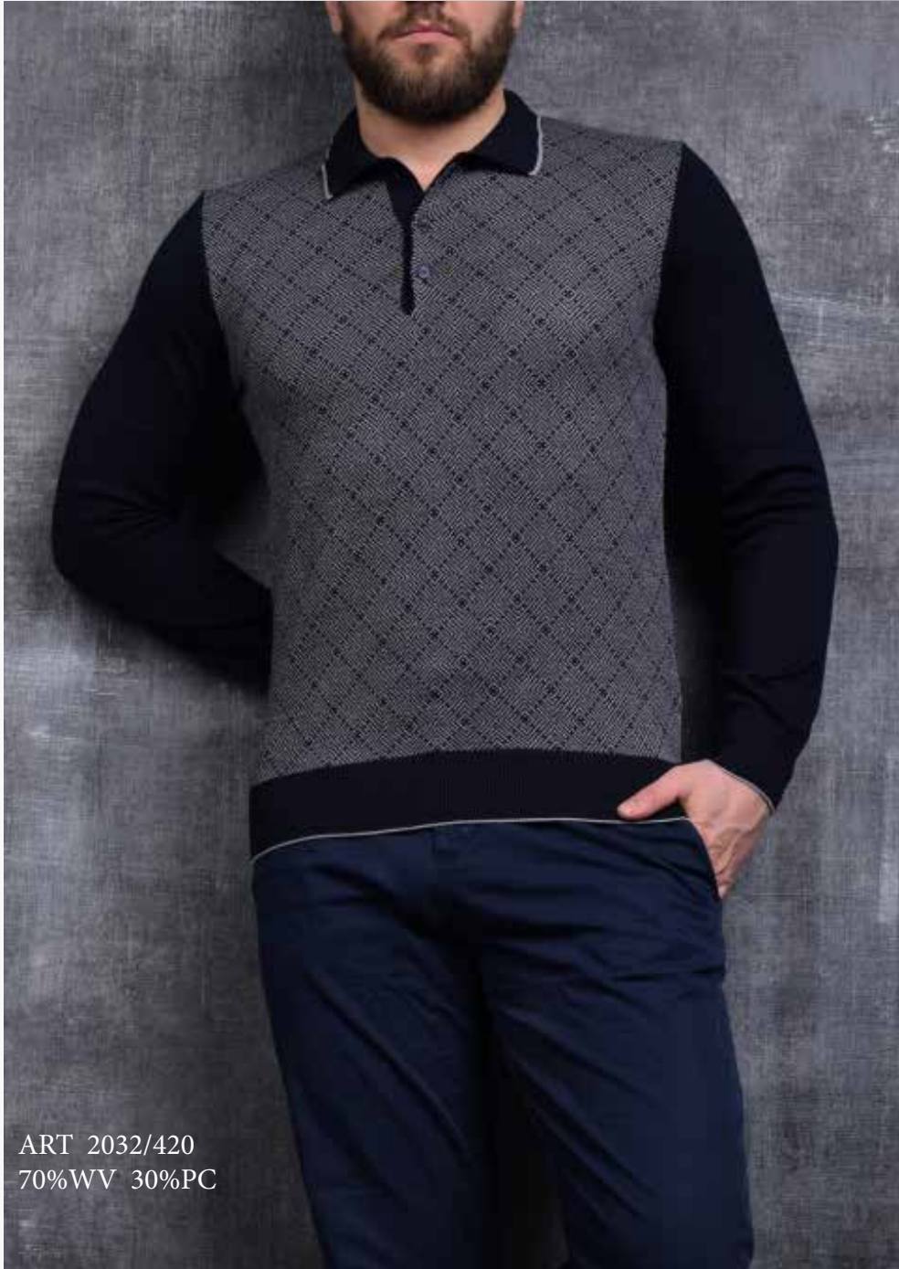
ART 2032/420 70%WV 30%PC