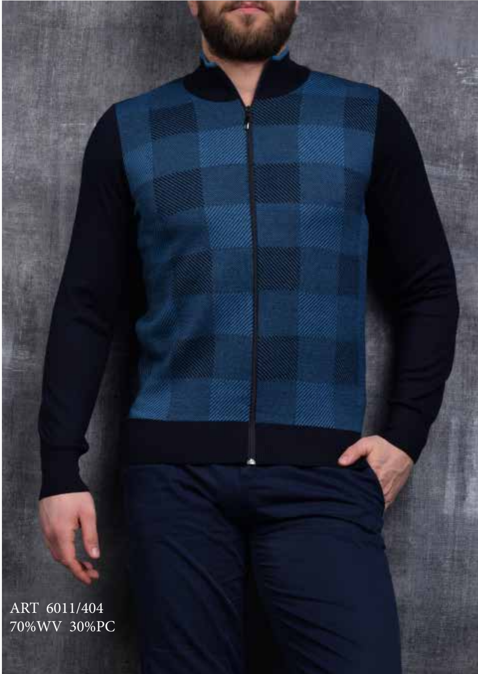
ART 6011/404 70%WV 30%PC