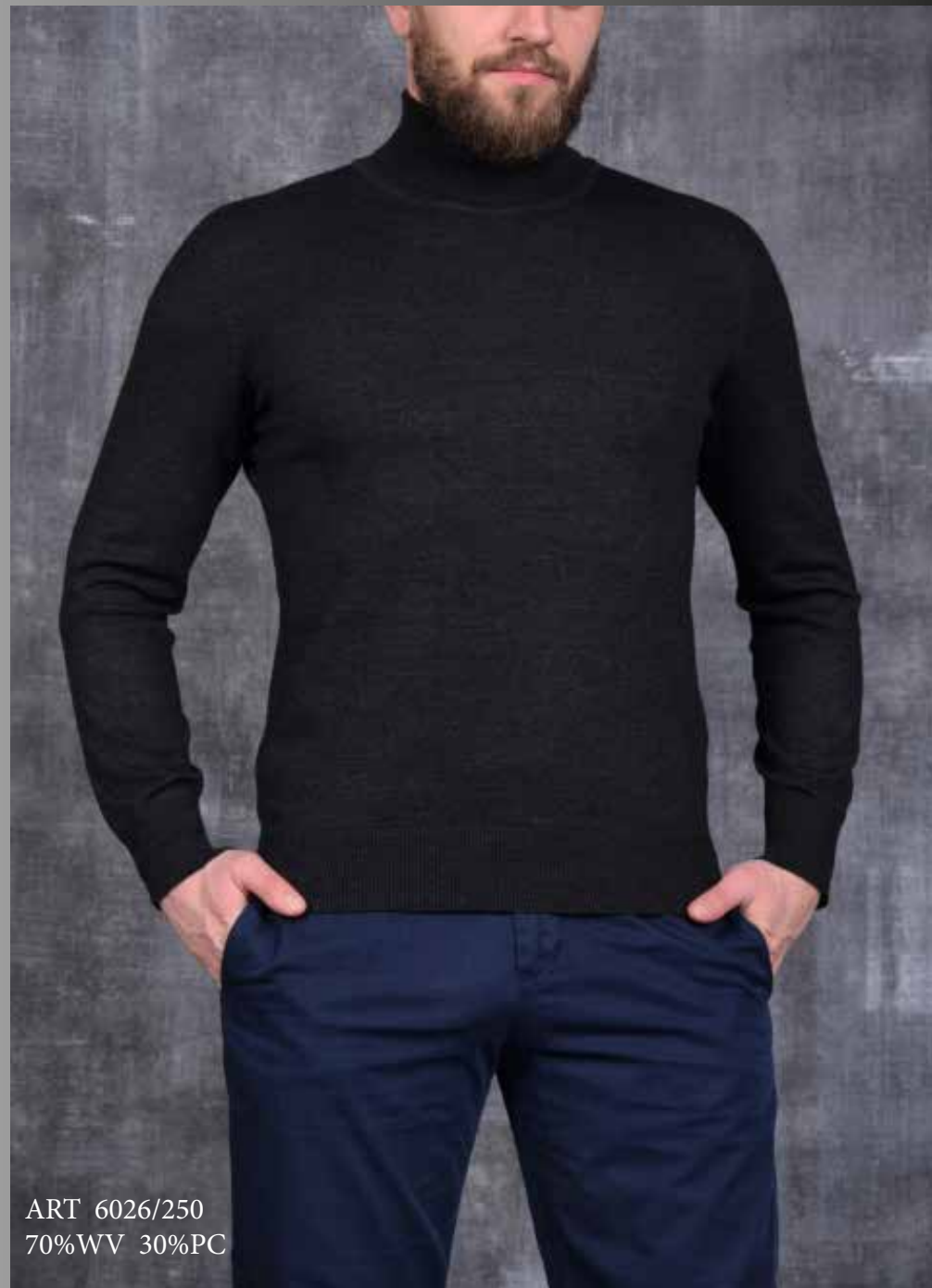
ART 6026/250 70%WV 30%PC