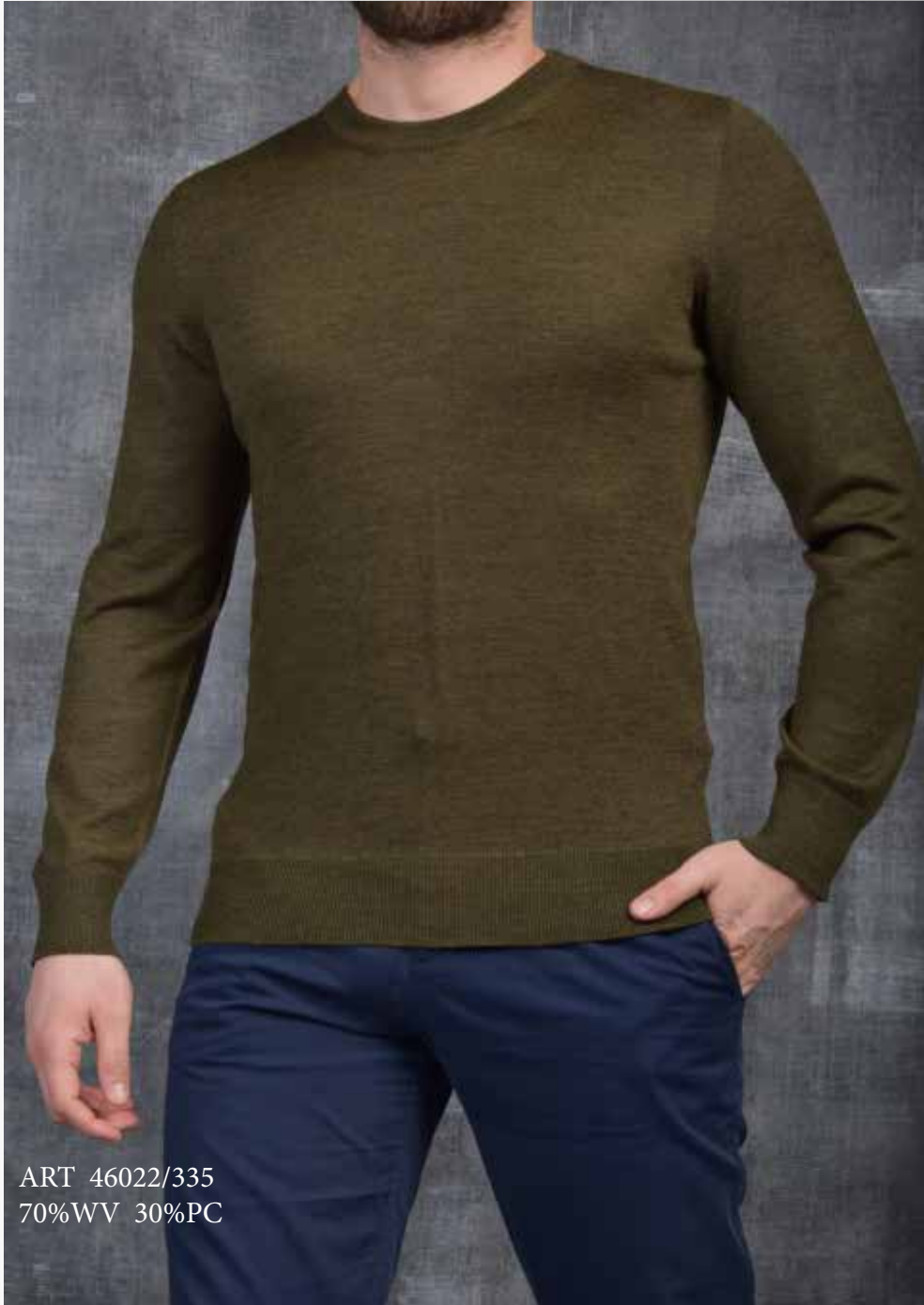
ART 46022/335 70%WV 30%PC