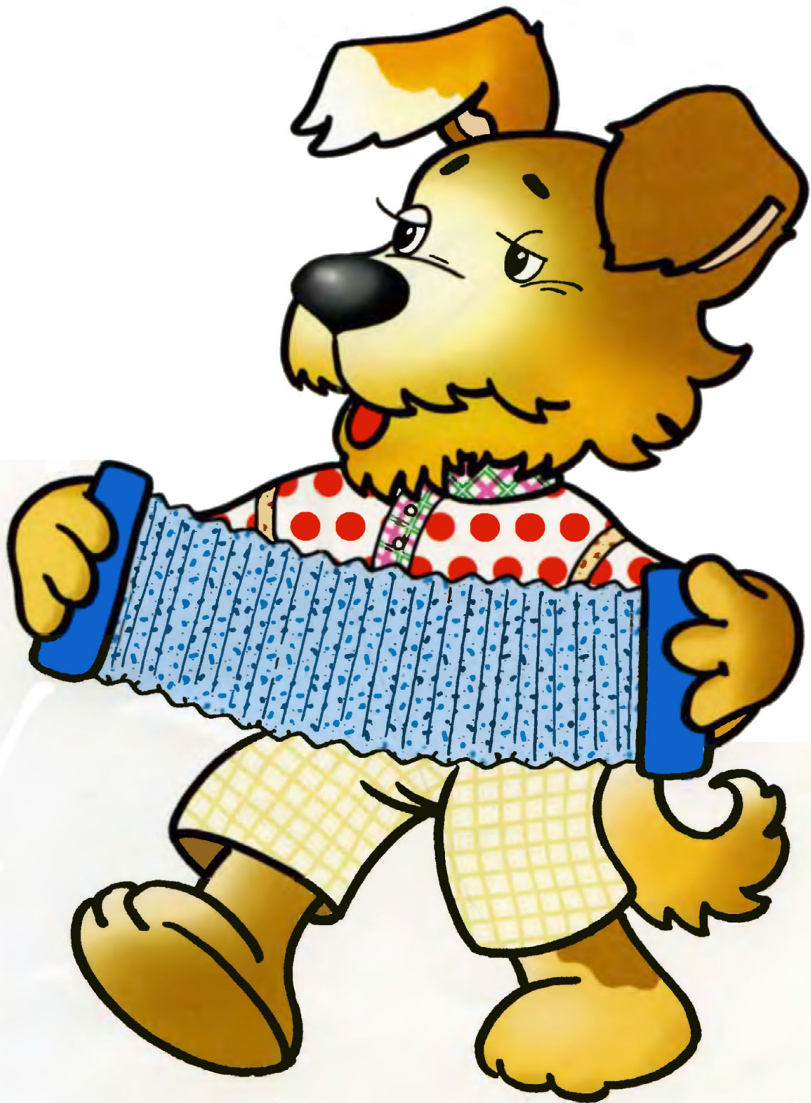
ПЁС – ЧЁРНЫЙ НОС