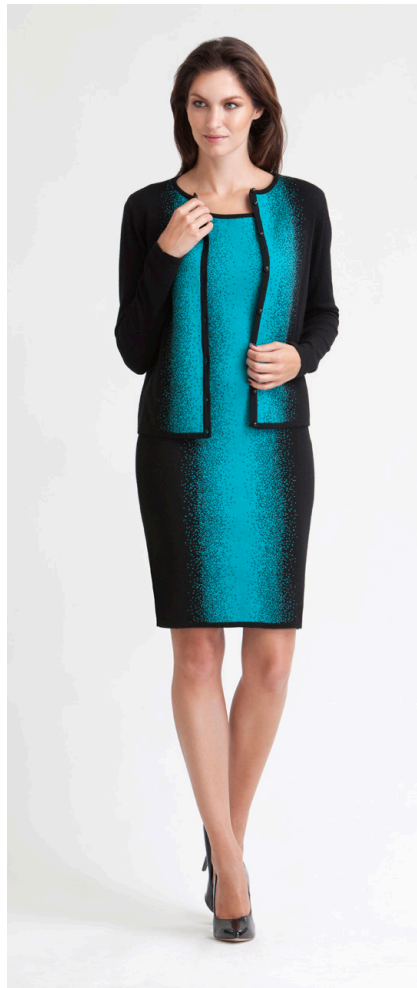
Кардиган: 1520,- Платье: 1690,-

ПЛАТЬЕ: 314-W005-DR1 Состав: 100% шелк Цвета: бирюзовый, фиолетовый Размер: XS, S, M, L, XL