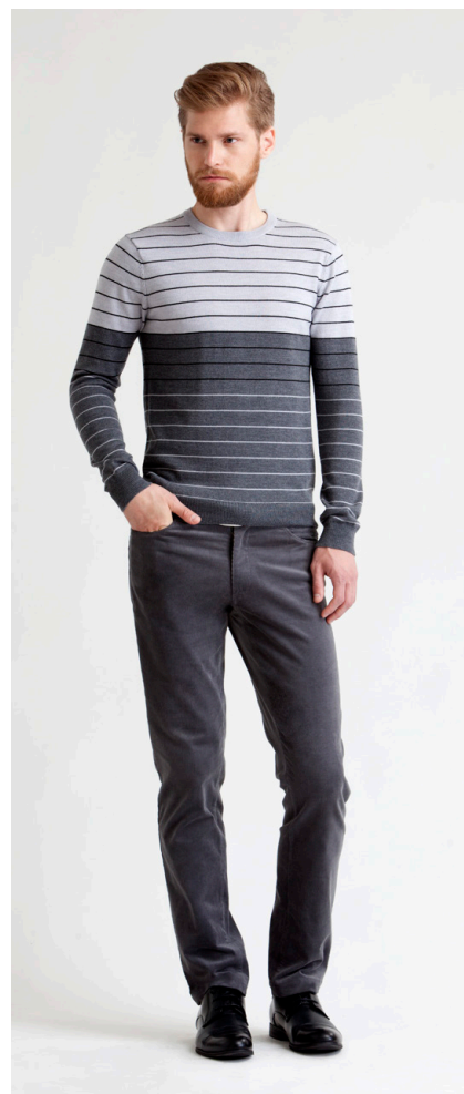
Джемпер: 1180,- Брюки: 1290,-

БРЮКИ: 114-W083-P2 Состав: 98% хлопок, 2% спандекс Цвета: черный, бежевый, серый Размер: S, M, L, XL, XXL, XXXL