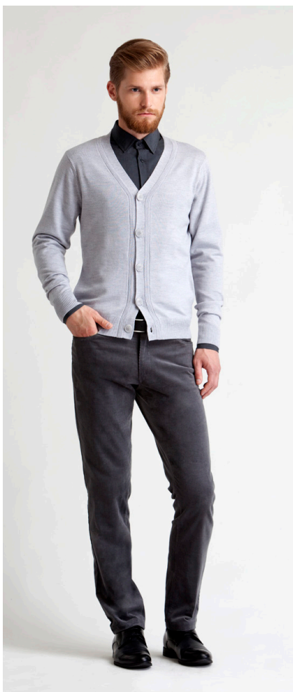
Кардиган: 1700,- Брюки: 1290,-

КАРДИГАН: 114-K074-CN2 Состав: 100% шерсть мериноса Цвета: светло-серый меланж, темно-синий Размер: S, M, L, XL, XXL, XXXL