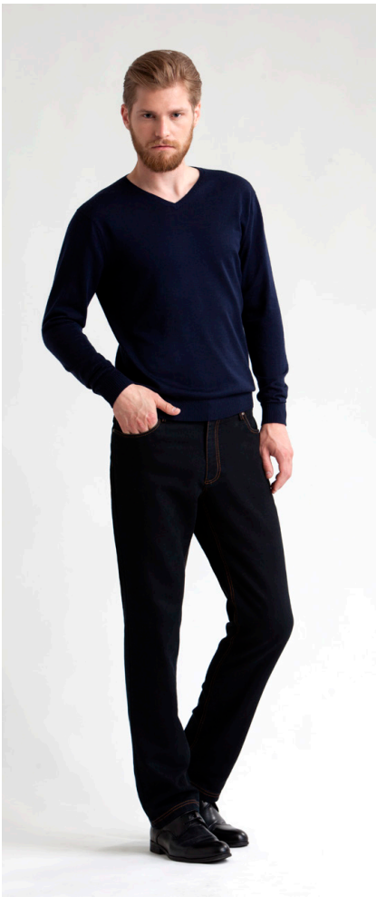
Пуловер : 1520,- Джинсы: 1270,-

ПУЛОВЕР: 114-K076-JR2 Состав: 100% шерсть мериноса Цвета: синий, светло-серый меланж, темно-синий Размер: S, M, L, XL, XXL, XXXL