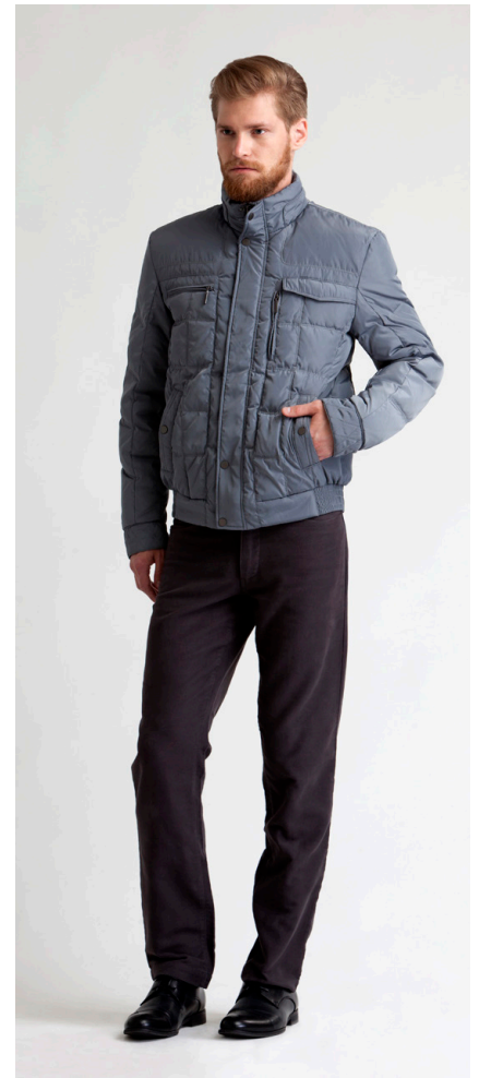
Пуховик: 2670,- Брюки: 1550,-

БРЮКИ: 114-W097-P3 Состав: 100% хлопок Цвета: черный, темно-серый, темно-коричневый Размер: S, M, L, XL, XXL, XXXL