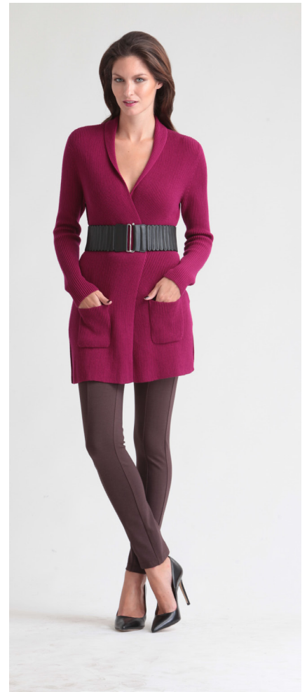
Кардиган: 1700,- Брюки: 1200,-

ПЛАТЬЕ: 314-W045-DR4 Состав: 50% шерсть, 50% полиэстер Цвета: темно-серый меланж, бордовый Размер: XS, S, M, L, XL, XXL