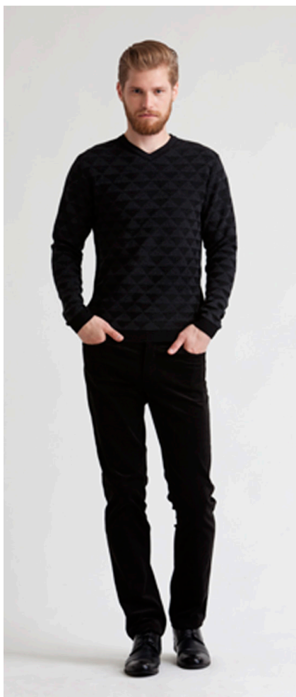
Пуловер: 1400,- Брюки: 1290,-

БРЮКИ: 114-W083-P2 Состав: 98% хлопок, 2% спандекс Цвета: черный, бежевый, серый Размер: S, M, L, XL, XXL, XXXL