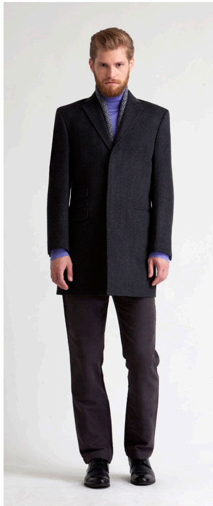
Пальто: 5690,- Брюки: 1550,-

ДЖИНСЫ: 114-W093-PJ4 Состав: 93% хлопок, 6.5% полиэстер, 0.5% спандекс Цвета: черный, темно-синий Размер: S, M, L, XL, XXL, XXXL