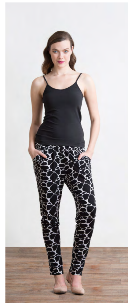
Топ: 340,- Брюки: 1110,-

Цвета: черный Состав: 74% хлопок, 24% пэ, 2% спандекс Размеры: XS, S, M, L, XL