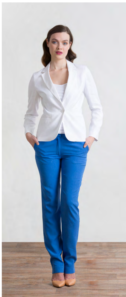
Пиджак: 2690,- Брюки: 1330,-