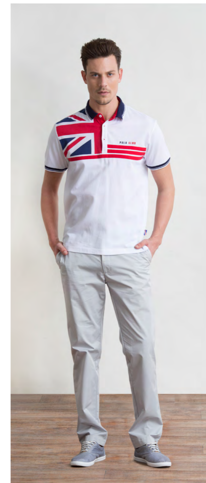
Поло: 1040,- Брюки: 1470,-

Цвет: темно-синий Состав: 100% хлопок Размеры: S, M, L, XL, XXL, XXXL