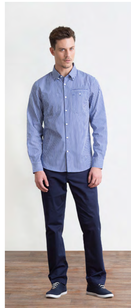
Рубашка: 1190,- Брюки: 1330,-

Цвет: черный Состав: 98% хлопок, 2% спандекс Размеры: S, M, L, XL, XXL, XXXL