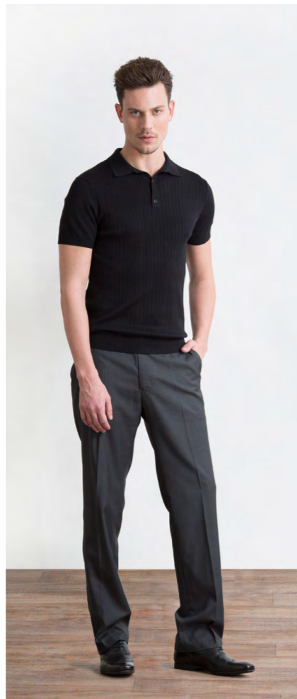
Джемпер-поло: 1200,- Брюки: 1410,-

Цвета: черный, серый, темно-синий Состав: 97% хлопок, 3% спандекс Размеры: S, M, L, XL, XXL, XXXL