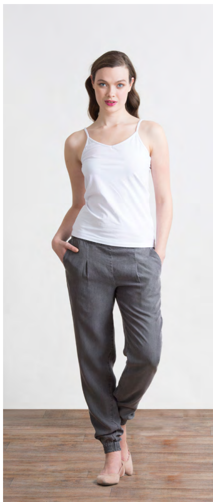
Топ: 340,- Брюки: 1290,-