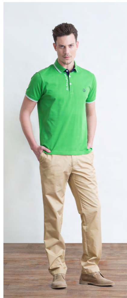
Поло: 1010,- Брюки: 1250,-

Цвет: синий Состав: 98% хлопок, 2% спандекс Размеры: S, M, L, XL