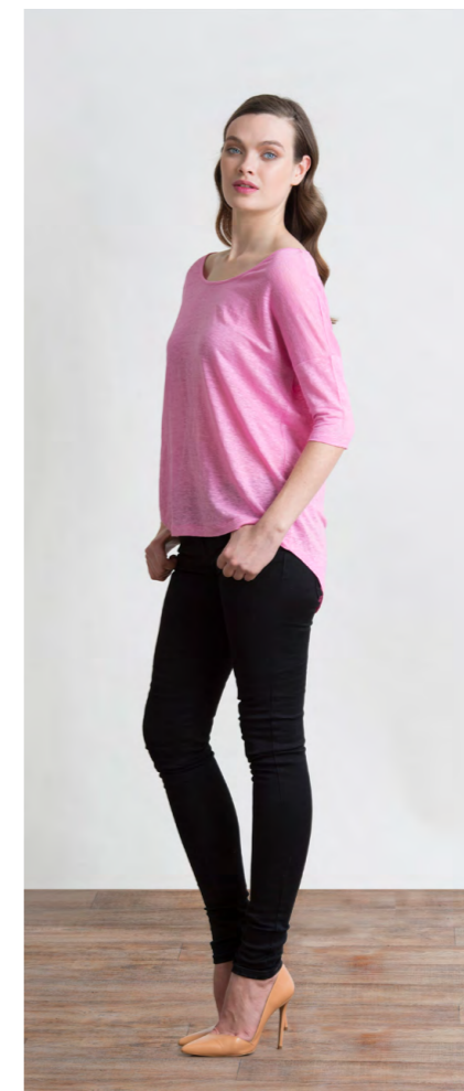
Топ: 1110,- Джинсы: 1080,-

ДЖИНСЫ: 414-W087-PJ1 Цвета: черный Состав: 74% хлопок, 24% пэ, 2% спандекс Размеры: XS, S, M, L, XL