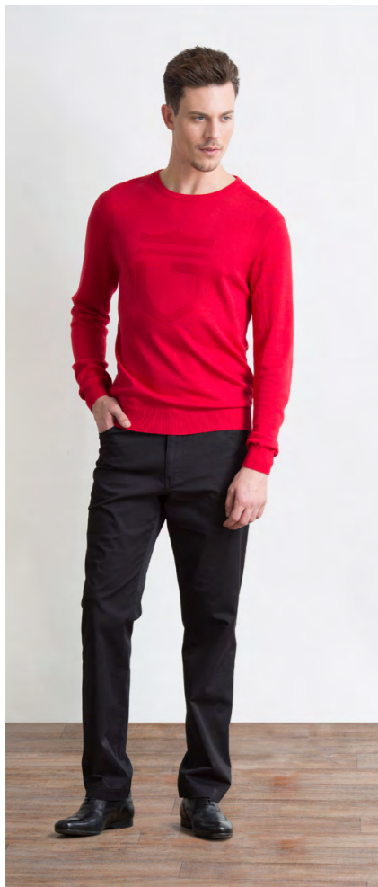
Джемпер: 1260,- Брюки: 1330,-