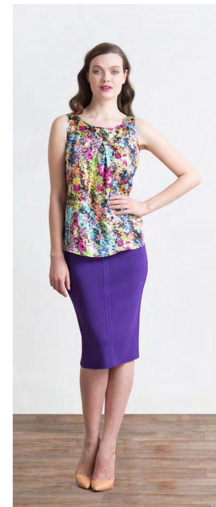
Топ: 1370,- Юбка: 1120,-

Цвета: черный, фиолетовый Состав: 65% вискоза, 35% нейлон Размеры: XS, S, M, L, XL, XXL