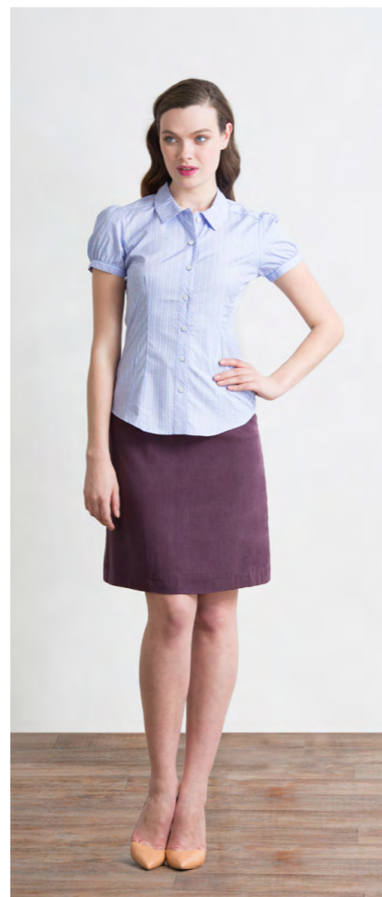
Рубашка: 1080,- Юбка: 1200,-

Цвета: серый меланж, темно-синий меланж Состав: 45% вискоза, 55% пэ Размеры: XS, S, M, L, XL, XXL