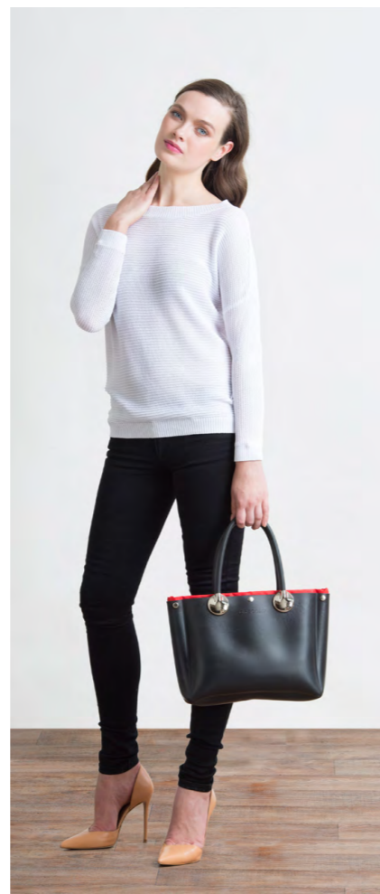
Джемпер: 1250,- Джинсы: 1080,-

Цвета: темно-синий Состав: 74% хлопок, 24% пэ, 2% спандекс Размеры: XS, S, M, L, XL, XXL