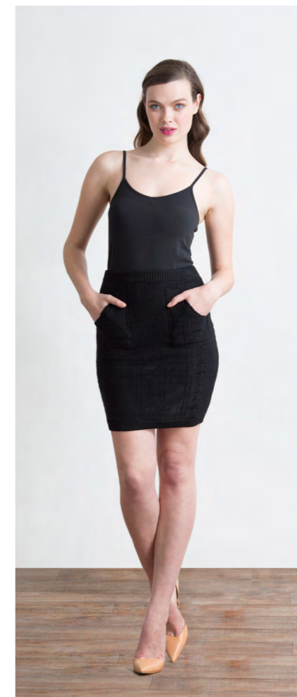
Топ: 340,- Юбка вязаная: 1100,-

Цвета: черно-белый принт Состав: 95% вискоза, 5% эластан Размеры: XS, S, M