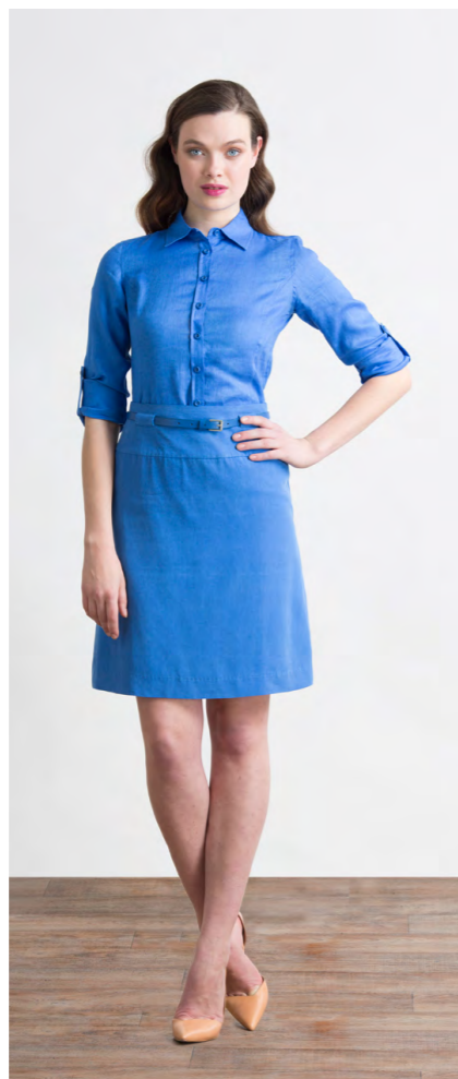
Рубашка: 1200,- Юбка: 1200,-

Цвета: коричневый, синий Состав: 30% лен, 70% вискоза Размеры: XS, S, M, L, XL, XXL