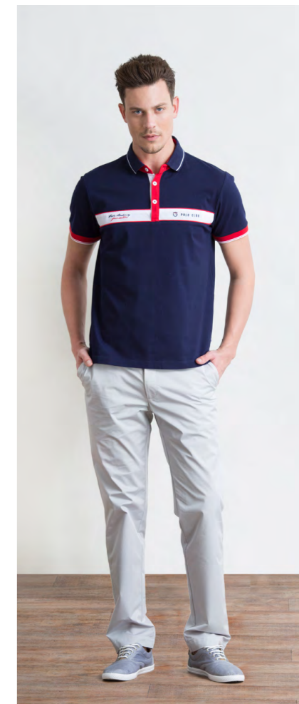
Поло: 1060,- Брюки: 1470,-

Цвета: светло-синий, светло-серый Состав: 97% хлопок, 3% спандекс Размеры: S, M, L, XL, XXL