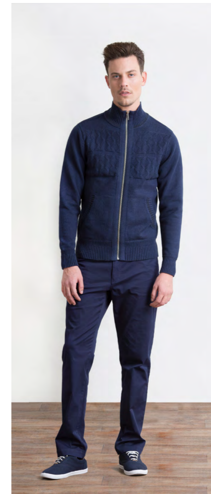
Кардиган: 1580,- Брюки: 1330,-

Цвета: черный, серый, темно-синий Состав: 97% хлопок, 3% спандекс Размеры: S, M, L, XL, XXL, XXXL