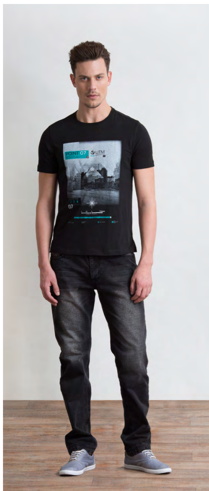
Футболка: 830,- Джинсы: 1250,-