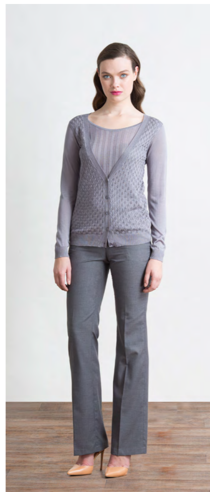
Джемпер: 1490,- Брюки: 1310,-

БРЮКИ: 414-W013-P1 Цвета: серый меланж, темно-синий меланж Состав: 45% вискоза, 55% пэ Размеры: XS, S, M, L, XL, XXL