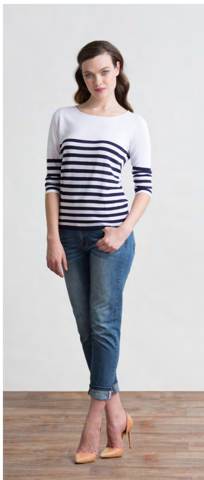
Джемпер: 1020,- Джинсы: 1080,-

ДЖЕМПЕР: 414-K022-JR1 Цвета: темно-синий, зеленый Состав: 100% вискоза Размеры: XS, S, M, L, XL, XXL