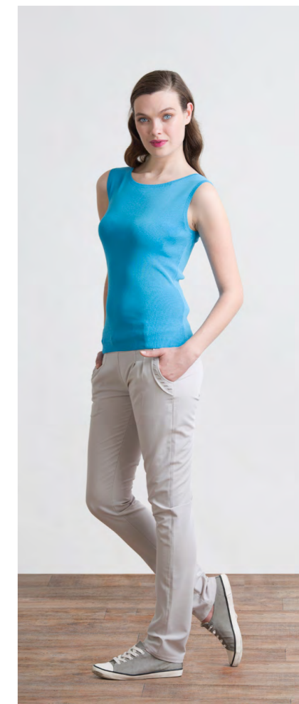
Топ: 1080,- Брюки: 1660,-

Цвета: голубой Состав: 74% хлопок, 24% пэ, 2% спандекс Размеры: XS, S, M, L, XL