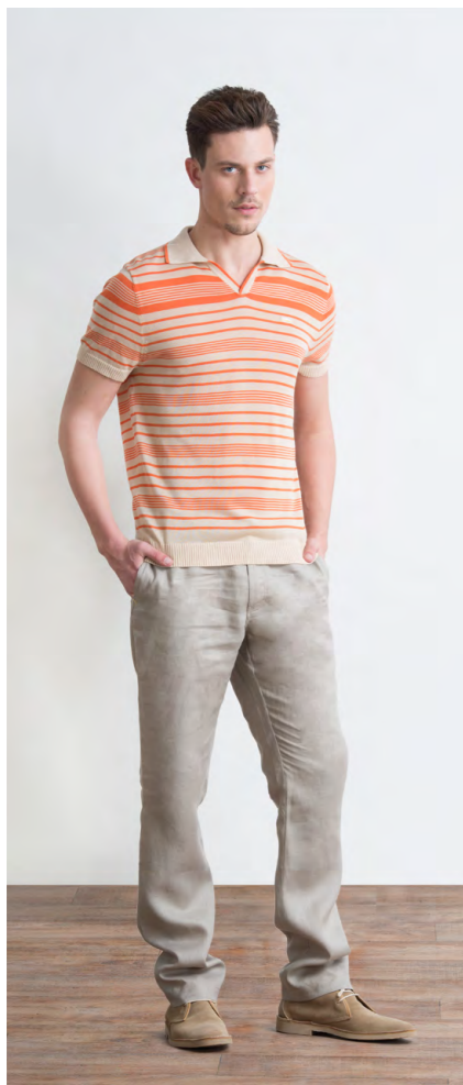
Джемпер-поло: 1120,- Брюки: 1410,-