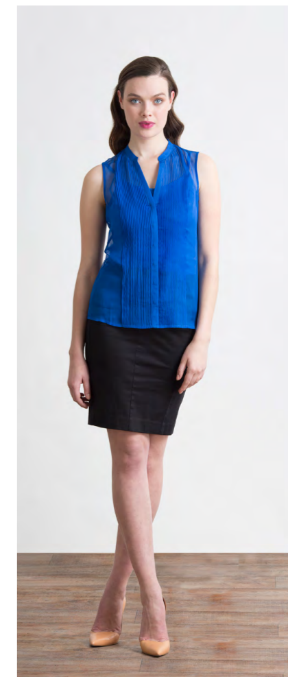
Блуза: 1170,- Юбка: 1110,-

Цвета: серый меланж, темно-синий меланж Состав: 45% вискоза, 55% пэ Размеры: XS, S, M, L, XL, XXL