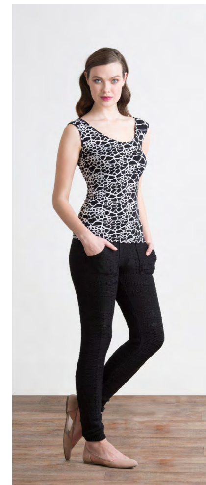
Топ: 560,- Леггинсы вязаные: 1540,-

Цвета: черный Состав: 50% район, 25% вискоза, 25% нейлон Подкладка: 95% пэ, 5% эластан Размеры: XS, S, M, L