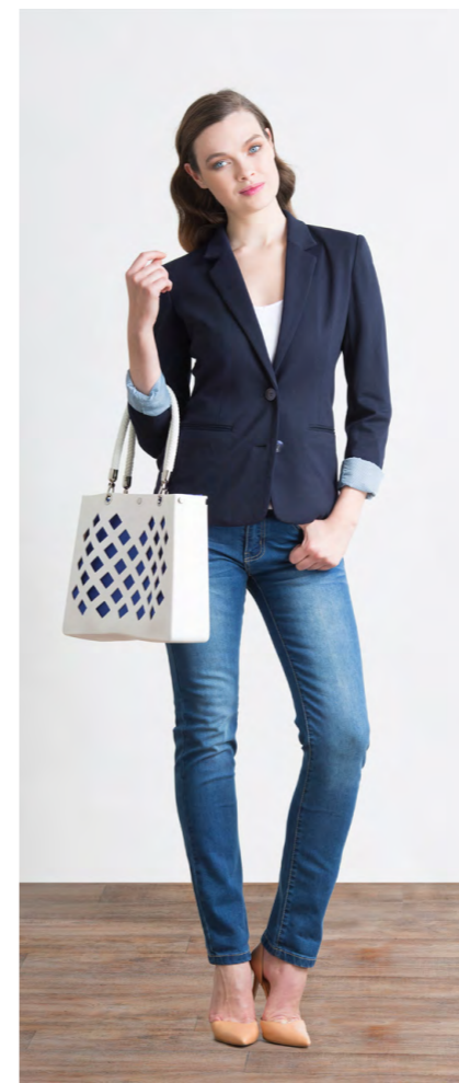
Пиджак: 2030,- Джинсы: 1080,-

Цвета: черный Состав: 74% хлопок, 24% пэ, 2% спандекс Размеры: XS, S, M, L, XL