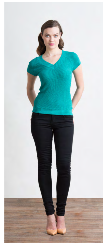
Джемпер: 1120,- Джинсы: 1080,-

БРЮКИ: 414-W076-P1 Цвета: кремовый, темно-синий Состав: 75% пэ, 20% район, 5% спандекс Ремень: 100% полиуретан Размеры: XS, S, M, L, XL