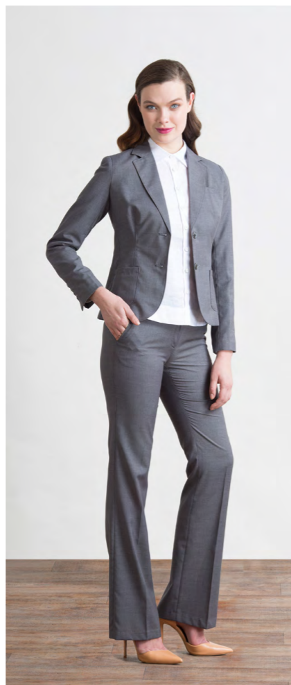
Пиджак: 1920,- Брюки: 1310,-

БРЮКИ: 414-W013-P1 Цвета: серый меланж, темно-синий меланж Состав: 45% вискоза, 55% пэ Размеры: XS, S, M, L, XL, XXL