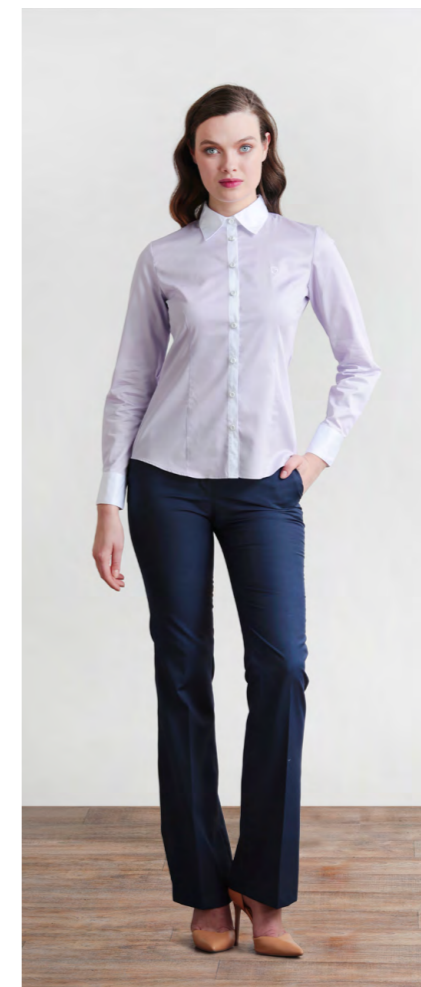
Рубашка: 1260,- Брюки: 1310,-

Цвета: черный, бежевый Состав: 97% хлопок, 3% спандекс Размеры: XS, S, M, L, XL