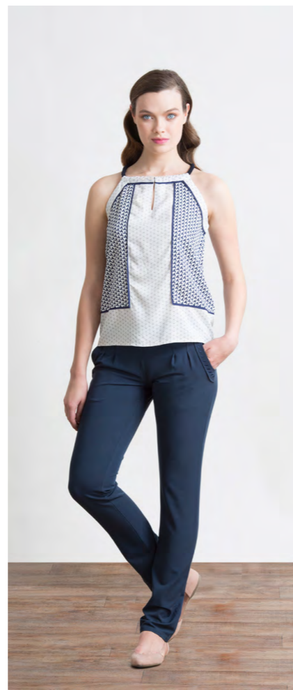
Топ: 1270,- Брюки: 1660,-

ТРЕНЧ: 414-O185-CT1 Цвета: черный, светло-бежевый Состав: 65% пэ, 35% хлопок Подкладка: 55% пэ, 45% вискоза Размеры: XS, S, M, L, XL, XXL