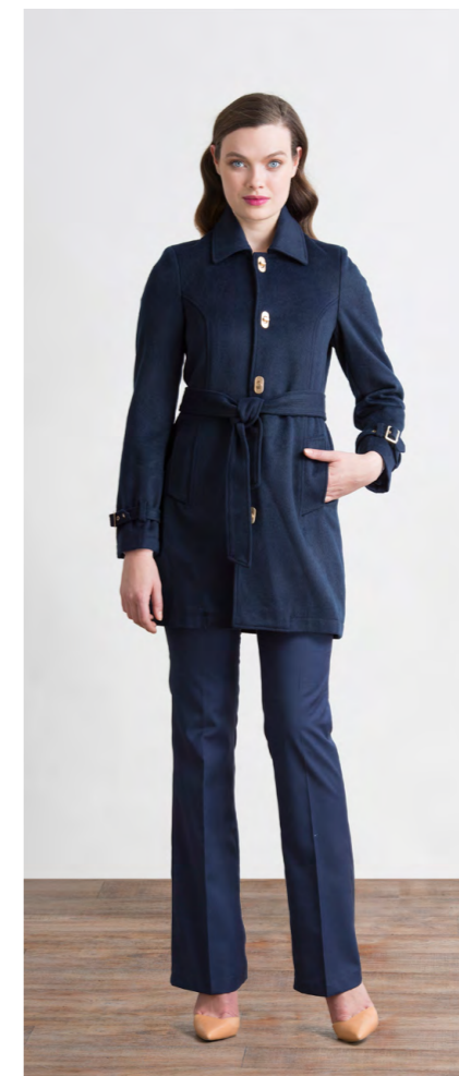
Пальто: 3750,- Брюки: 1310,-

ПЛАТЬЕ: 414-C006-DR1 Цвета: серый меланж Состав: 40% вискоза, 60% пэ Размеры: XS, S, M, L, XL, XXL