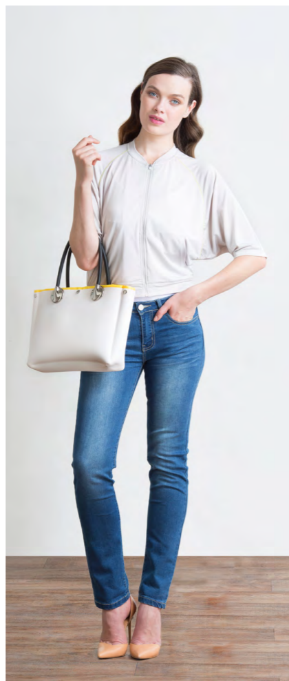
Жакет: 1120,- Джинсы: 1080,-

Цвета: темно-синий, бирюзовый Состав: 100% хлопок Размеры: XS, S, M, L, XL