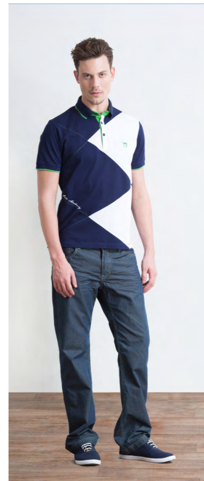
Поло: 1000,- Джинсы: 1250,-

Цвет: синий, светло-серый, бежевый Состав: 80% хлопок, 20% пэ Размеры: S, M, L, XL, XXL