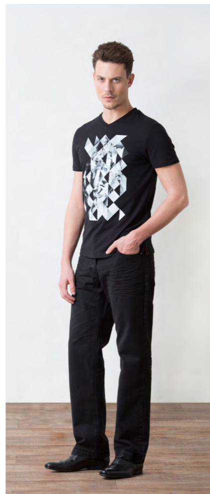
Футболка: 750,- Джинсы: 1250,-

Цвет: черный Состав: 100% хлопок Размеры: S, M, L, XL