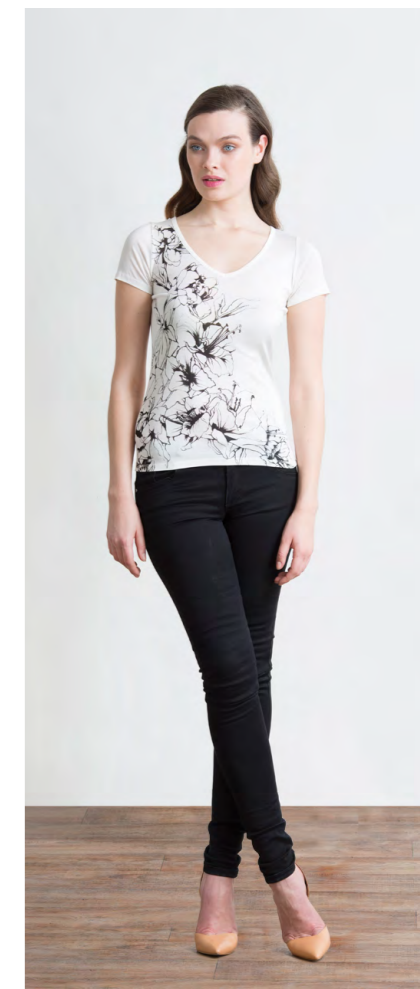
Топ: 1110,- Джинсы: 1080,-

ДЖИНСЫ: 414-W087-PJ1 Цвета: черный Состав: 74% хлопок, 24% пэ, 2% спандекс Размеры: XS, S, M, L, XL