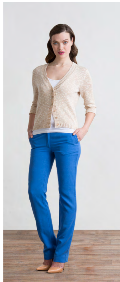
Кардиган: 1210,- Брюки: 1330,-

Цвета: коричневый, синий Состав: 30% лен, 70% вискоза Подкладка: 95% пэ, 5% эластан Размеры: XS, S, M, L, XL, XXL