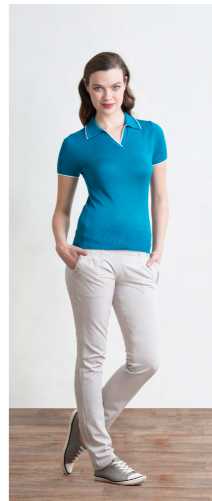
Джемпер-поло: 820,- Брюки: 1660,-

Цвета: коричневый, синий Состав: 30% лен, 70% вискоза Размеры: XS, S, M, L, XL, XXL