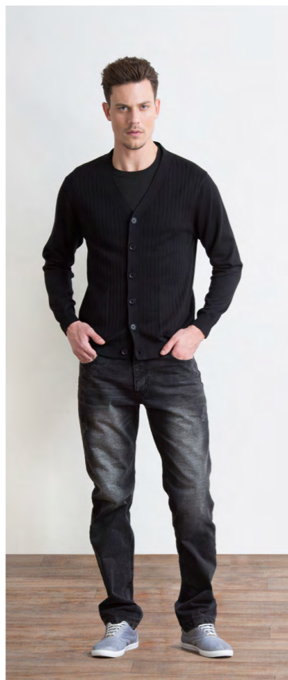
Кардиган 1370,- Джинсы: 1250,-

Цвет: черный Состав: 100% хлопок Размеры: S, M, L, XL