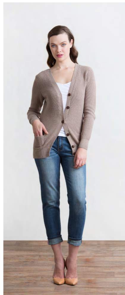
Кардиган: 1330,- Джинсы: 1080,-

ДЖИНСЫ: 414-W088-PJ1 Цвета: синий Состав: 100% хлопок Размеры: XS, S, M, L, XL