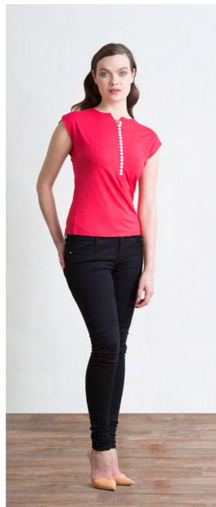
Топ: 910,- Джинсы: 1080,-

Цвета: темно-синий, красный Состав: 95% вискоза, 5% спандекс Размеры: XS, S, M, L, XL, XXL