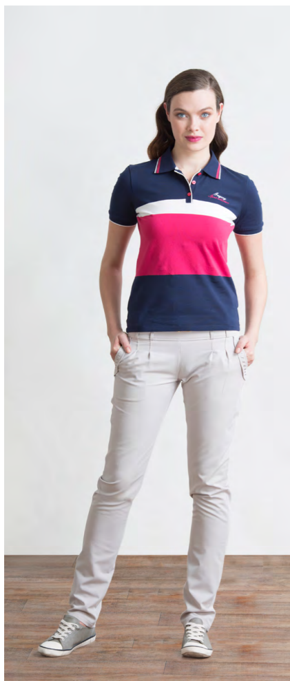
Поло: 1110,- Брюки: 1660,-