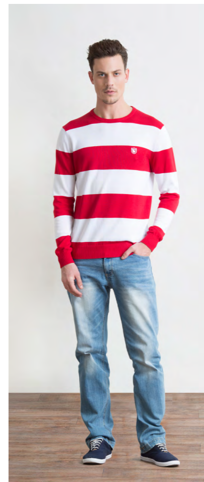
Джемпер: 1200,- Джинсы: 1250,-

Цвет: черный Состав: 98% хлопок, 2% спандекс Размеры: S, M, L, XL, XXL, XXXL