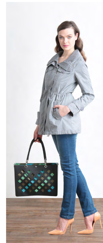
Парка: 2250,- Джинсы: 1080,-

Цвета: синий Состав: 74% хлопок, 24% пэ, 2% спандекс Размеры: XS, S, M, L, XL, XXL