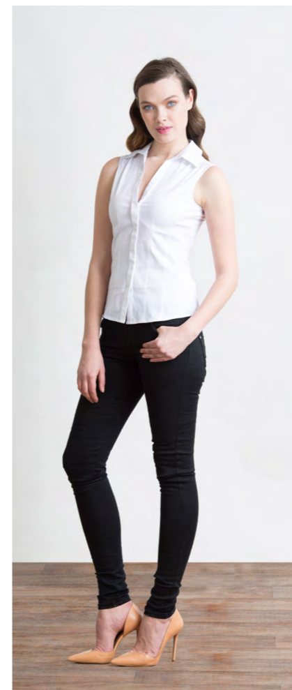
Блуза: 1140,- Джинсы: 1080,-

ДЖИНСЫ: 414-W088-PJ1 Цвета: синий Состав: 100% хлопок Размеры: XS, S, M, L, XL