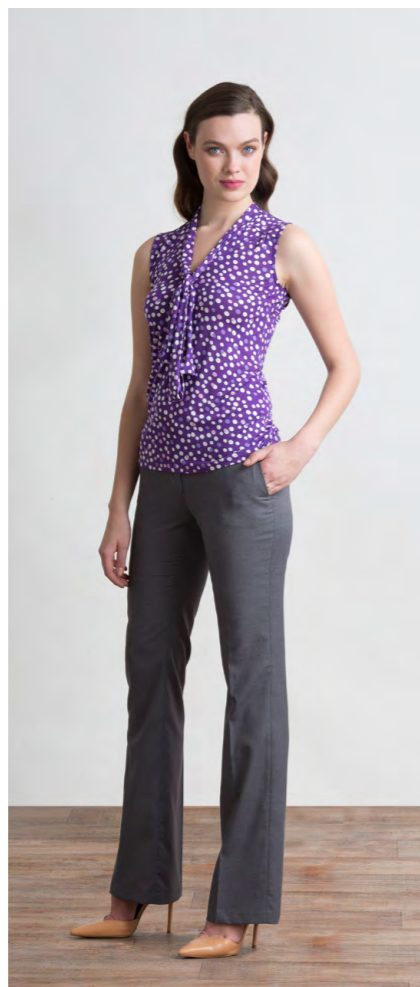
Топ: 1020,- Брюки: 1310,-

Цвета: коричневый, синий Состав: 30% лен, 70% вискоза Подкладка: 95% пэ, 5% эластан Размеры: XS, S, M, L, XL, XXL