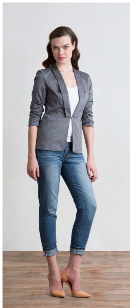
Пиджак: 1870,- Джинсы: 1080,-

ДЖИНСЫ: 414-W088-PJ1 Цвета: синий Состав: 100% хлопок Размеры: XS, S, M, L, XL