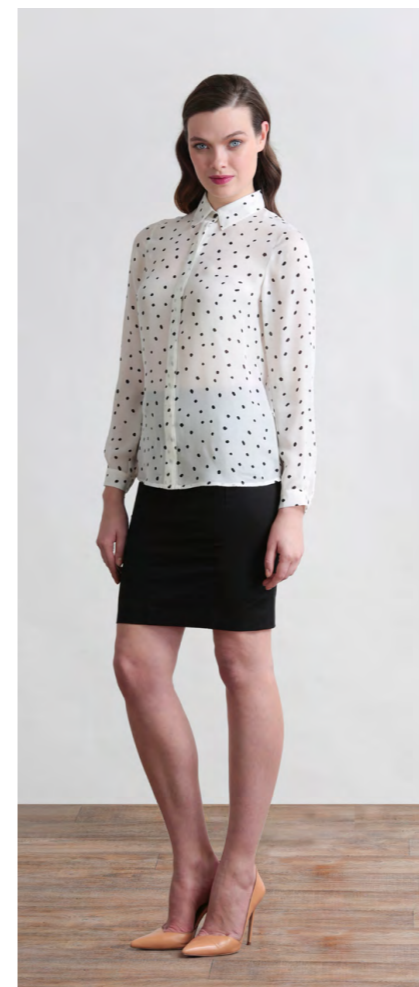
Блуза: 2240,- Юбка: 1110,-

Цвета: коричневый, синий Состав: 30% лен, 70% вискоза Подкладка: 95% пэ, 5% эластан Размеры: XS, S, M, L, XL, XXL