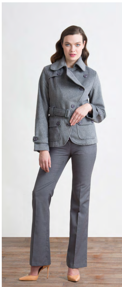
Пальто: 3120,- Брюки: 1310,-

ПАЛЬТО: 414-O095-CT1 Цвета: светло-серый, черный Состав: 50% шерсть, 50% пэ Подкладка: 55% пэ, 45% вискоза Размеры: XS, S, M, L, XL