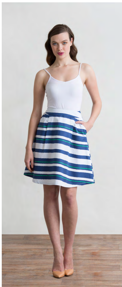
Топ: 340,- Юбка: 1230,-