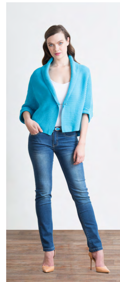
Кардиган: 1230,- Джинсы: 1080,-

Цвета: синий Состав: 74% хлопок, 24% пэ, 2% спандекс Размеры: XS, S, M, L, XL, XXL