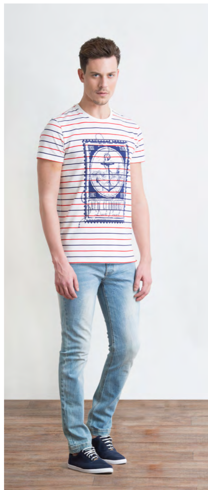
Футболка: 810,- Джинсы: 1250,-

Цвета: бежевый, темно-синий, оливковый Состав: 100% лен Размеры: S, M, L, XL, XXL, XXXL