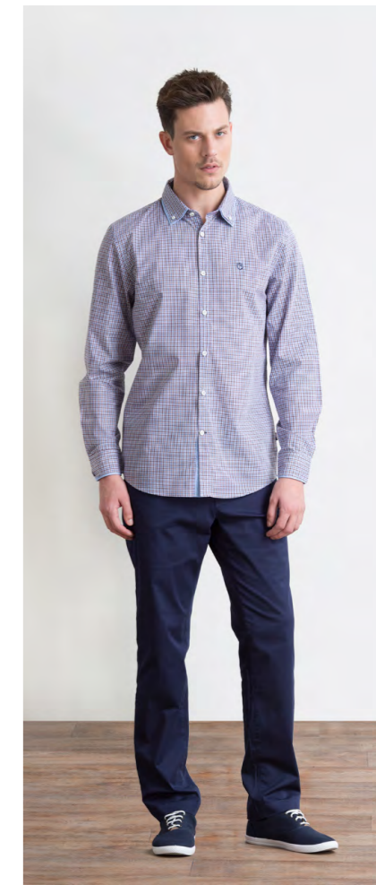
Рубашка: 1230,- Брюки: 1330,-

Цвета: черный, серый, темно-синий Состав: 97% хлопок, 3% спандекс Размеры: S, M, L, XL, XXL, XXXL