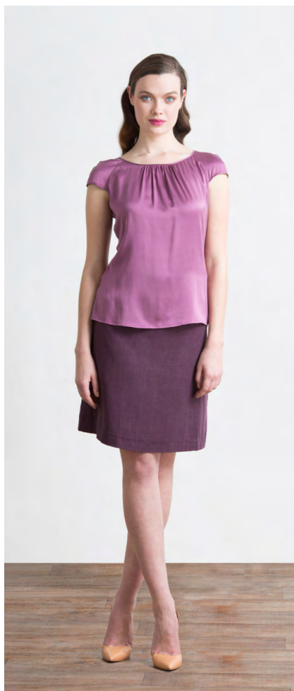
Топ: 1270,- Юбка: 1200,-