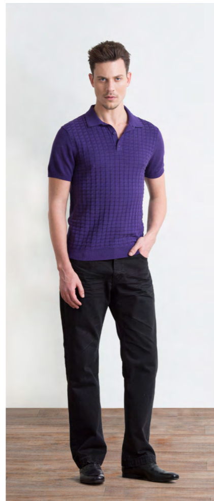
Джемпер-поло: 1200,- Джинсы: 1250,-

Цвета: темно-серый меланж, серый меланж Состав: 45% вискоза, 55% пэ Размеры: S, M, L, XL, XXL, XXXL