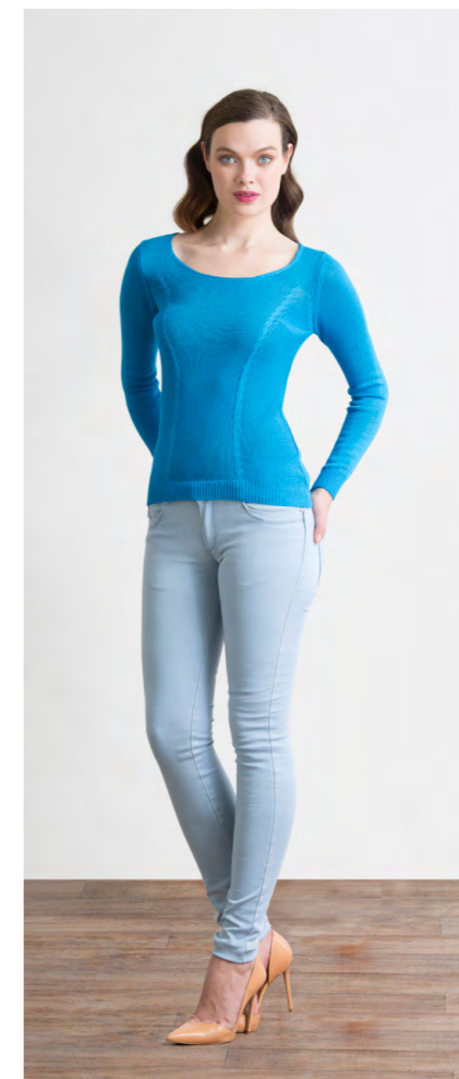
Джемпер: 1310,- Джинсы: 1080,-

Цвета: кремовый, темно-синий Состав: 75% пэ, 20% район, 5% спандекс Ремень: 100% полиуретан Размеры: XS, S, M, L, XL