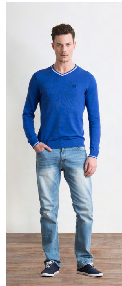
Джемпер: 1290,- Джинсы: 1250,-

Цвет: синий Состав: 99% хлопок, 1% эластан Размеры: S, M, L, XL, XXL, XXXL