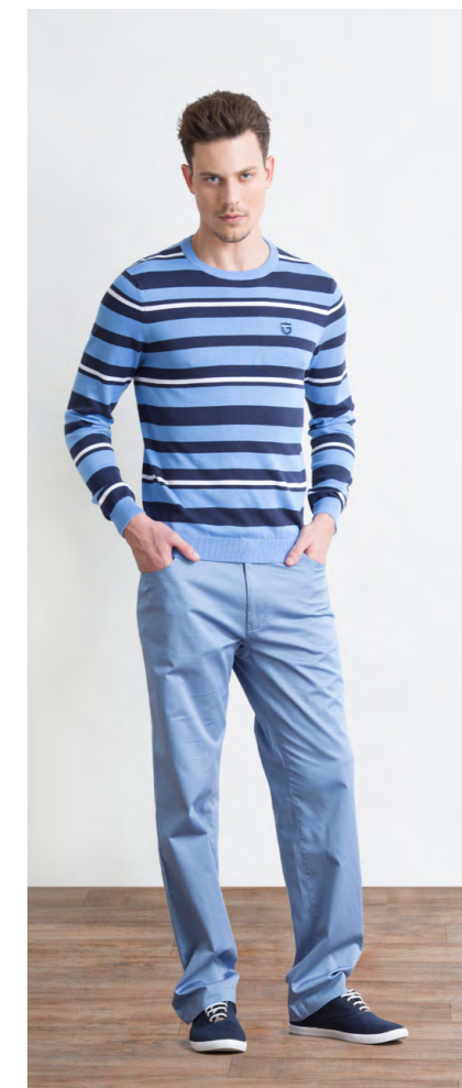
Рубашка: 1230,- Брюки: 1470,-

Цвет: синий Состав: 99% хлопок, 1% эластан Размеры: S, M, L, XL, XXL, XXXL