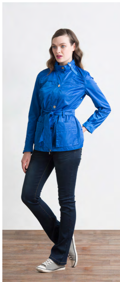
Куртка: 1750,- Джинсы: 1080,-

Цвета: синий, светло-серый Состав: 100% тенсел Размеры: XS, S, M, L, XL