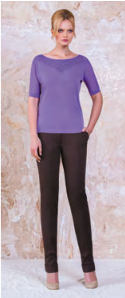
Джемпер: 1020,- Брюки: 1060,-

ДЖЕМПЕР: 413-K096-JRs5 Состав: 80% вискоза, 20% нейлон Цвета: сиреневый, коричневый