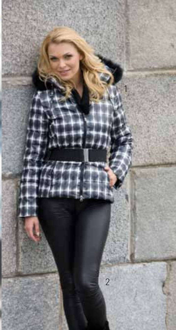
2 LL10-004 Леггинсы из ткани под «искусственную кожу». Цвет: black Размер: 92, 96, 100, 104, 108 Состав: 93% полиэстер, 7% эластан