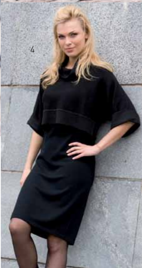
4 4 VIS10-088V Джемпер однотонный укороченный с короткими рукавами. Воротник «хомут». Цвет: black, d.grey melange, purple Размер: 84, 88, 92, 96, 100 Состав: 50% шерсть, 50% акрил