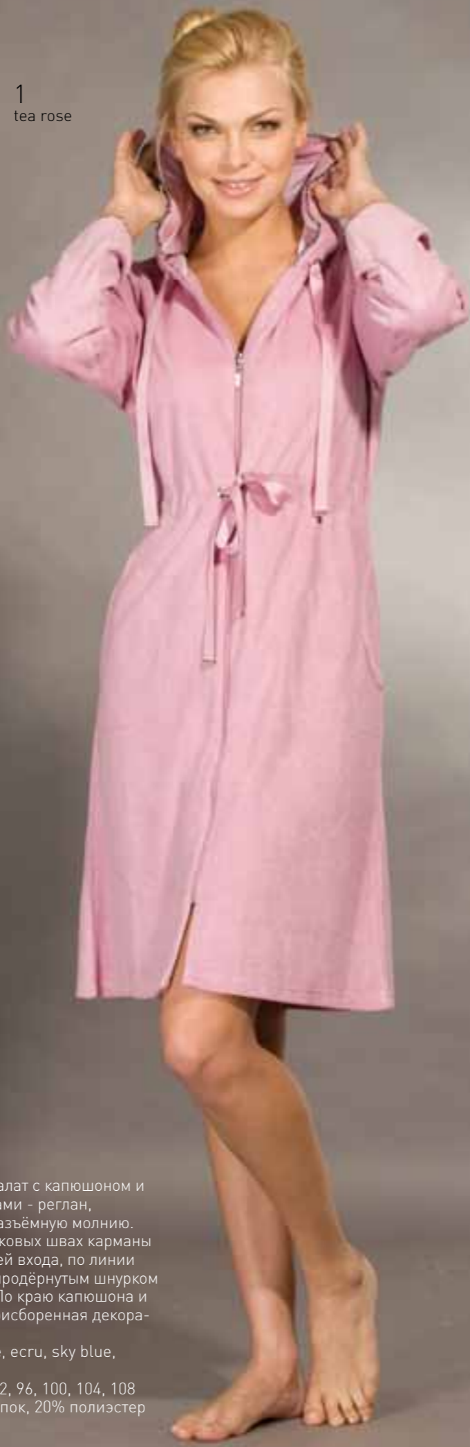
1 tea rose