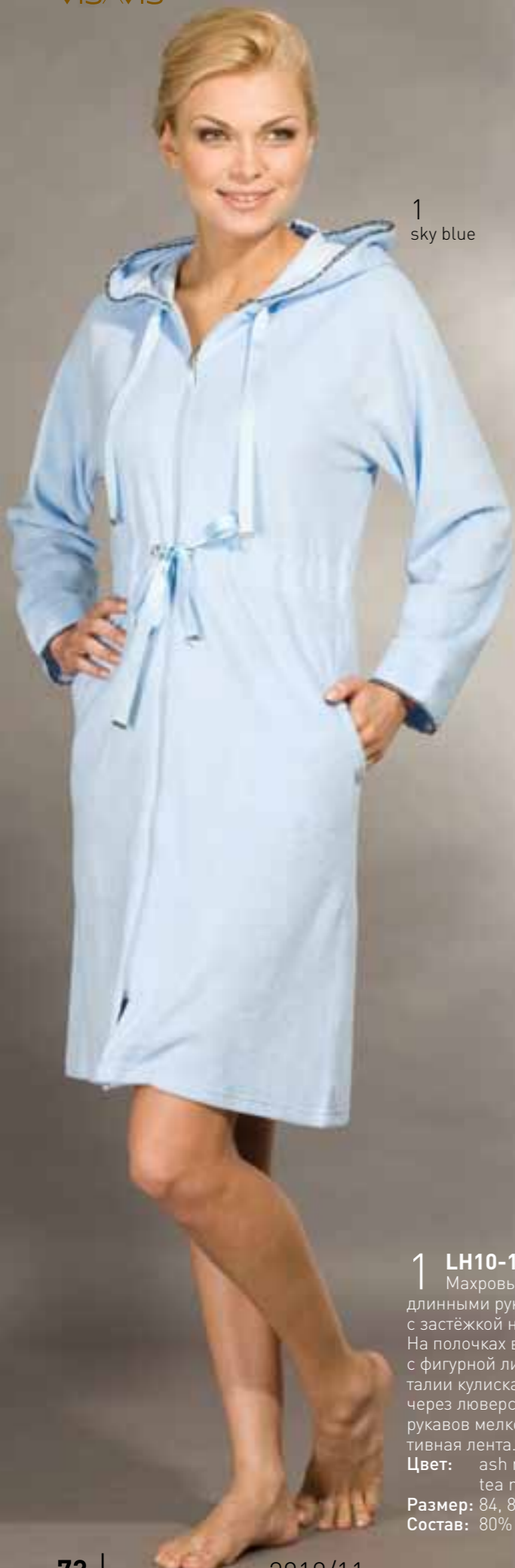
1 sky blue