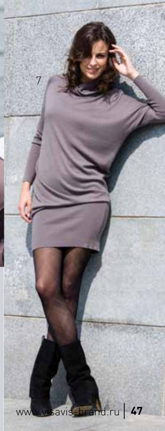
7 VIS10-072D Платье однотонное асимметричного кроя с длинными рукавами, воротник - стойка. Цвет: mate, d.navy, black Размер: 84, 88, 92, 96, 100 Состав: 40% вискоза, 40% полиамид, 20% хлопок