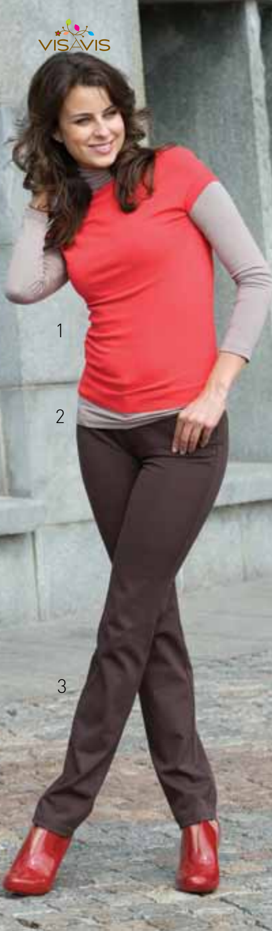
1 VIS10-045V Джемпер однотонный с воротником - лодочка. Рукава короткие. Цвет: black, bordo, coral, dusk Размер: 84, 88, 92, 96, 100, 104 Состав: 78% вискоза, 22% полиамид