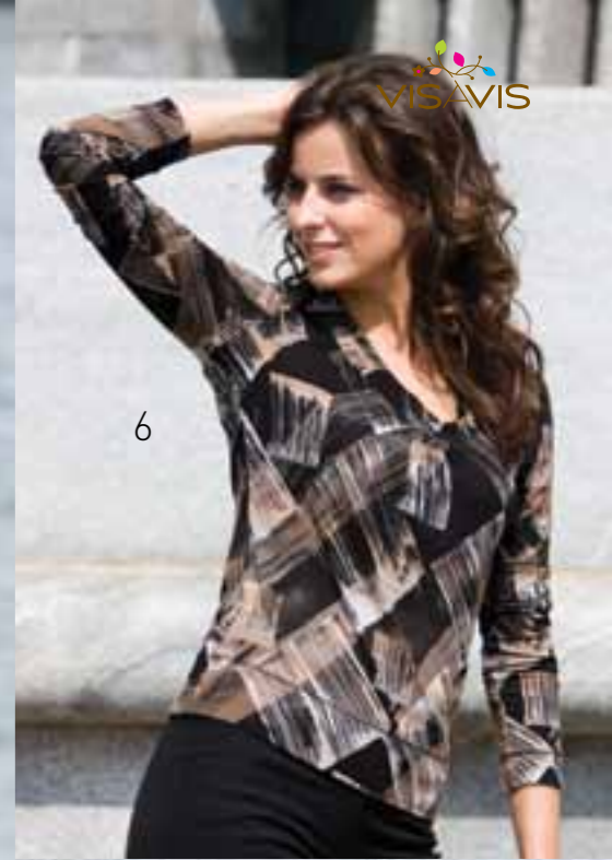
6 LD10-033 Джемпер из принтованного полотна с длинными рукавами. Круглый вырез оформлен планкой. Цвет: brown/print, navy/print Размер: 92, 96, 100, 104, 108, 112 Состав: 95% вискоза, 5% эластан