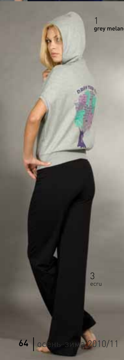
1 grey melange