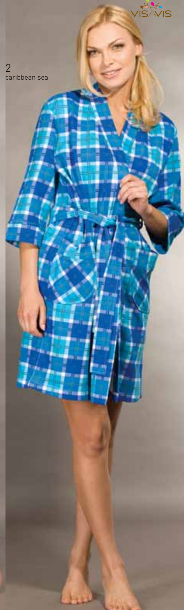
2 caribbean sea

1 LH10-16 Махровый халат с запахом, с рукавами 3/4. На правой полочке накладной карман с вышивкой «собачка». На капюшоне вышивка «собачка». Цвет: antique, ecru, iris Размер: 84, 88, 92, 96, 100, 104 Состав: 80% хлопок, 20% полиэстер