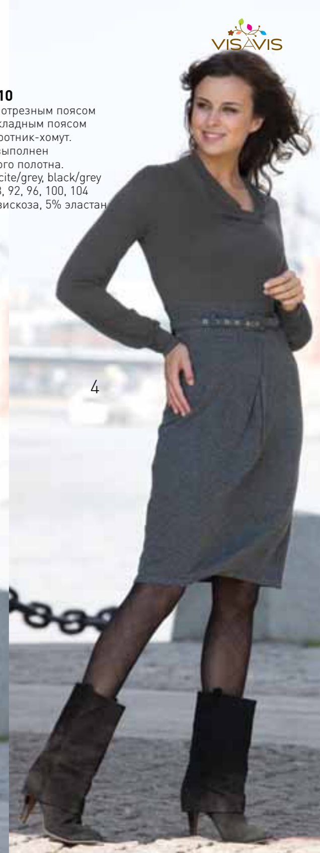
4 DR10-010 Платье с отрезным поясом по талии и накладным поясом с пряжкой, воротник-хомут. Низ изделия выполнен из жаккардового полотна. Цвет: антрацит/серый, черный/серый Размер: 84, 88, 92, 96, 100, 104 Состав: 95% вискоза, 5% эластан