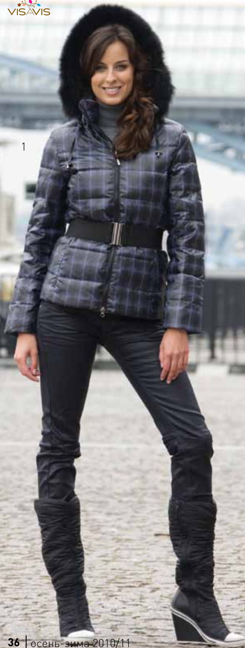
1 K10-46 Пуховик полуприлегающего силуэта, с горизонтальными линиями стежки, из ткани с принтом. Полочка и спинка с рельефами из пройм. Карманы с потайными молниями в рельефах полочек. Воротник - стойка. Рукав втачной одношовный. Застежка на пластиковую молнию-трактор. Капюшон съемный, с молнией. По внешнему краю капюшона - кулиса. меховая опушка крепится пуговицами. Металлическая вешалка и подкладка куртки с фирменным логотипом. Прилагается эластичный пояс с металлической пряжкой. Цвет: grey/black, white/black Размер: 84, 88, 92, 96, 100 Состав: 100% полиэстер (наполнение: 90% пух, 10% перо)