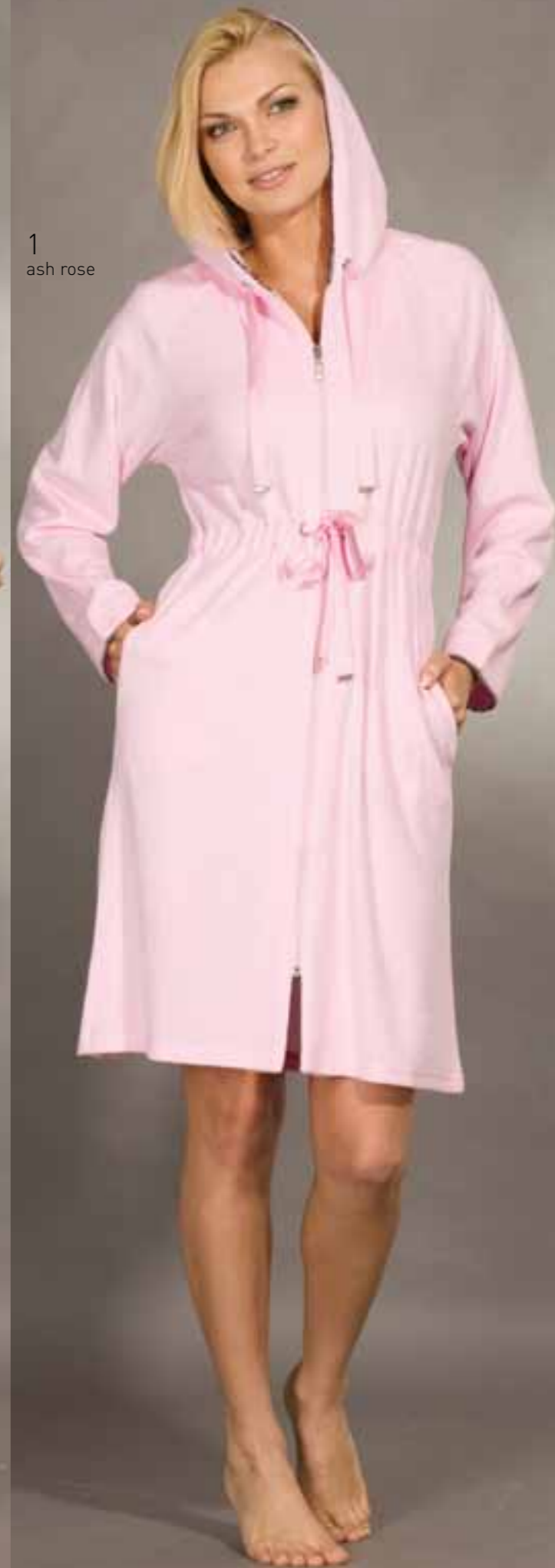
1 ash rose

1 LH10-14 Махровый халат с капюшоном и длинными рукавами - реглан, с застёжкой на разъёмную молнию. На полочках в боковых швах карманы с фигурной линией входа, по линии талии кулиска с продёрнутым шнурком через люверсы. По краю капюшона и рукавов мелко присборенная декоративная лента. Цвет: ash rose, ecru, sky blue, tea rose Размер: 84, 88, 92, 96, 100, 104, 108 Состав: 80% хлопок, 20% полиэстер