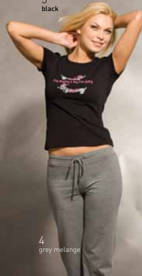
4 grey melange