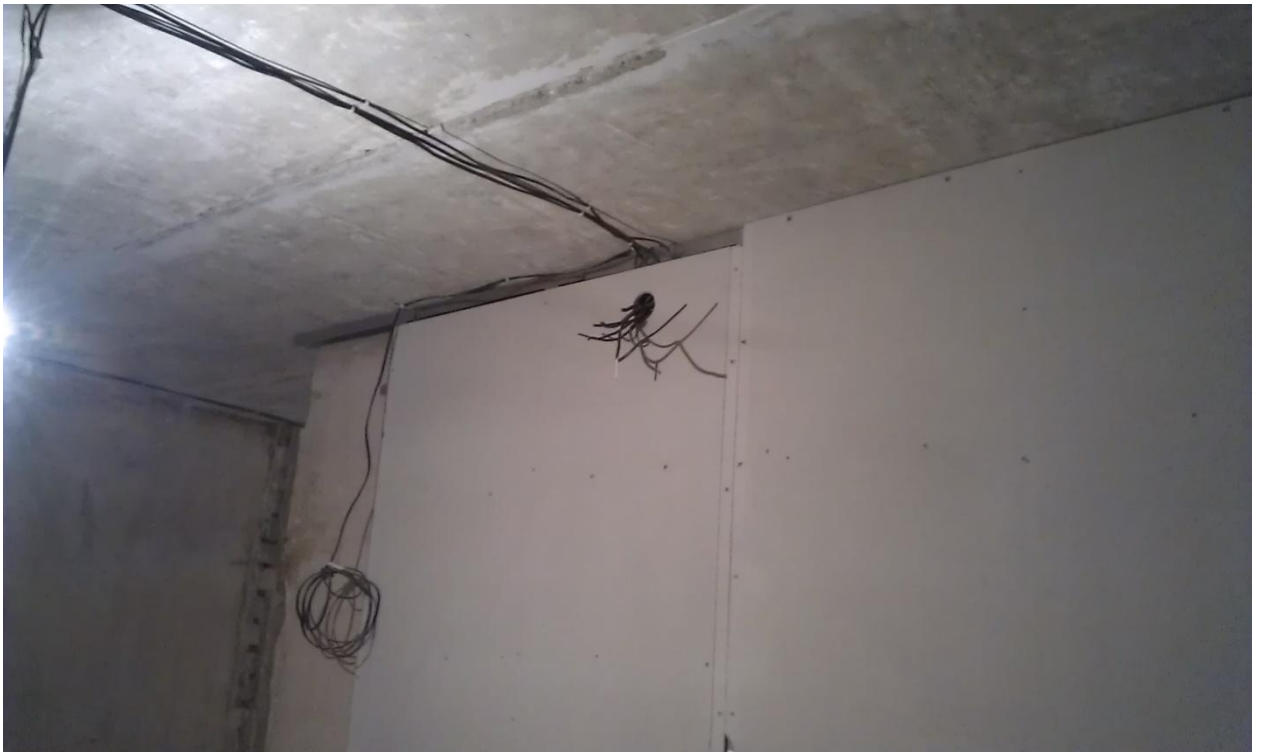
Вторая часть шедевра.